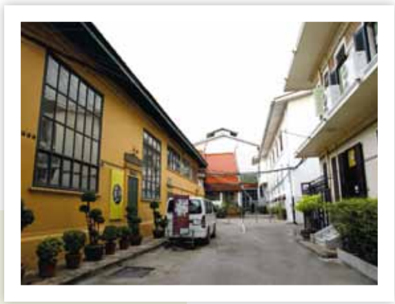
อาคารสำนักงานกรมศิลปากร ตั้งอยู่บนพื้นที่ของวังกลาง

ดังนั้นวังนี้จึงมีชื่อเรียกว่า วังท่าพระ ทรงพระกรุณาโปรดเกล้าฯ ให้สร้างพระราชทาน แต่สมเด็จพระเจ้าหลานเธอ เจ้าฟ้าฯ กรมขุนกษัตราธิราช พระราชนัดดา เป็นที่ประทับ จนสิ้นพระชนม์ ต่อมาพระบาทสมเด็จพระพุทธเลิศหล้านภาลัยพระราชทานให้เป็นที่ประทับของพระเจ้าลูกยาเธอ กรมหมื่นเจษฎาบดินทร์ ครั้นเสด็จเถลิงถวัลยราชสมบัติ เป็นพระบาทสมเด็จพระนั่งเกล้าเจ้าอยู่หัวได้พระราชทานให้เป็นที่ประทับของพระราชโอรส ๓ พระองค์ และได้ประทับต่อมาจนสิ้นพระชนม์ตามลำดับ คือ พระองค์เจ้าลักขณานุคุณ กรมขุนราชสีหวิกรม และกรมหมื่นอดุลยลักษณสมบัติ ต่อมาในสมัยรัชกาลที่ ๕ ได้พระราชทานวังท่าพระให้เป็นที่ประทับของสมเด็จพระเจ้าฟ้ากรมพระยานริศรานุวัดติวงศ์ เจ้านายพระองค์สุดท้ายที่ได้ประทับ ณ วังแห่งนี้ ปัจจุบันวังท่าพระเป็นส่วนหนึ่งของ มหาวิทยาลัยศิลปากร