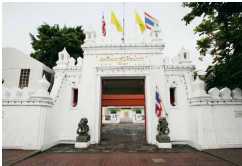
ประตูวังท่าพระในปัจจุบัน

เป็นที่น่าสังเกตว่าเจ้านายผู้ทรงครองวังหลายพระองค์มีพระอัจฉริยภาพและทรงงานด้านการช่างและงานศิลปกรรมแขนงต่างๆ トラบจนในสมัยต่อมาวังทั้งสามเปลี่ยนแปลงบทบาทเป็นหน่วยงานราชการ แต่ก็ยังคงสืบทอดความเป็นสถานที่สำคัญทางการศึกษาศิลปวัฒนธรรมของชาติ กล่าวคือ วังตะวันตกเป็นสถาบันการศึกษาด้านศิลปะ คือ มหาวิทยาลัยศิลปากร ส่วนวังกลางและวังตะวันออก คือ ที่ตั้งของกรมศิลปากรในปัจจุบัน