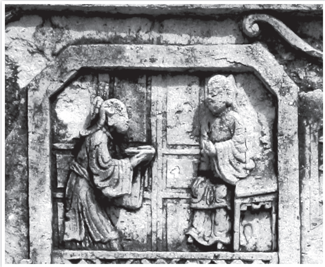
ภาพ “ลูกกตัญญู” บนแผ่นหินสลักภาพจีน แผ่นด้านทิศเหนือของพระที่นั่งพุทไธสวรรย์

ข้าพเจ้าหวังว่า คงมีผู้สนใจได้ตรวจพิจารณาแผ่นภาพหินแกะสลักทั้งสองแผ่นนี้โดยละเอียด เพื่อทำความเข้าใจความหมายของภาพทั้งหมดในลำดับต่อไป.