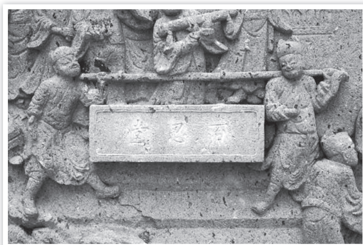
ภาพอักษรจีนอ่านจากขวาไปซ้ายว่า “ป้ายเหรินถาง” บนแผ่นป้าย

อักษรจีนทั้ง ๓ ตัว 堂忍百 อ่านจากขวาไปซ้ายว่า “ป้ายเหรินถาง” เป็นตัวอักษรจีนยุคปัจจุบัน มีความหมายว่า “ศาลแห่งร้อยชั้นดิตรรม” แต่หากจะเข้าใจเรื่องราวจากภาพที่แกะสลักไว้ นั้น จำเป็นต้องค้นคว้าเกี่ยวกับที่มาของเรื่องราวที่เกี่ยวกับอักษรทั้ง ๓ ตัวนี้เสียก่อน ซึ่งข้าพเจ้าได้ค้นคว้ามา และขอเสนอแนะดังต่อไปนี้