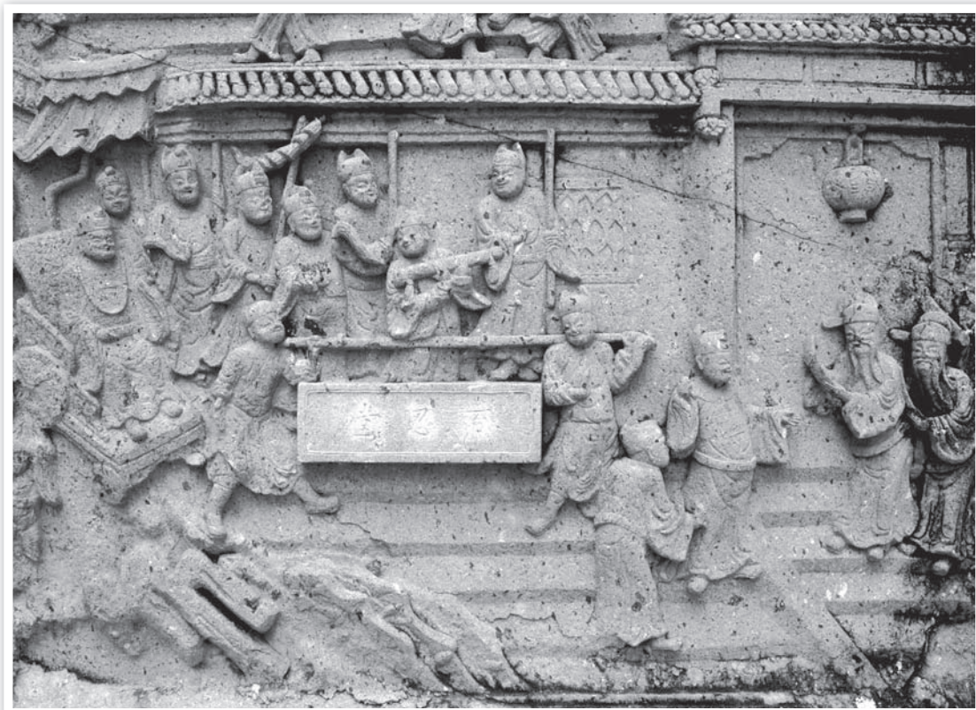
รูปพระเจ้าจักรพรรดิ (ประทับบนเสลี่ยงมีร่มกางข้างบน) พระราชทานป้าย “ศาลแห่งร้อยชั้นดิตรรม” แก่จางกงอี (ชายชราที่มีหนวดเครายืนหน้าสุดของกลุ่มบุคคลขวามือของภาพ)

ขณะนี้ยังไม่มีผู้ใดพิจารณาภาพบนแผ่นหินแกะสลักทั้งสองนี้โดยละเอียดว่าภาพตอนไหน เป็นเรื่องราวอะไร แต่อย่างน้อย แผ่นหินแกะสลักด้านทิศใต้ตรงมุมล่างซ้ายมือ (ดูภาพถ่ายประกอบ) ก็น่าจะเป็นที่เข้าใจได้ว่า เป็นภาพพระเจ้าจักรพรรดิถึงเกาจง ทรงพระราชทานป้าย 堂忍百 “ศาลแห่ง ร้อยชั้นดิตรรม” แก่ผู้เฒ่าจางกงอี เพื่อนำไปประดิษฐานยังศาลบรรพบุรุษของตระกูลจาง โดยมีบุคคล กำลังแบกหามแผ่นป้ายดังกล่าวจนถึงหน้าประตูใหญ่ของคฤหาสน์ของผู้เฒ่าจางกงอี ส่วนแผ่นหินแกะสลักด้านทิศเหนือตรงมุมบนซ้ายมือของภาพ (ดูภาพถ่ายประกอบ) น่าจะหมายถึงภาพของ “ลูกกตัญญู” เป็นอย่างมาก (ตามชั้นดีคำที่ ๒)