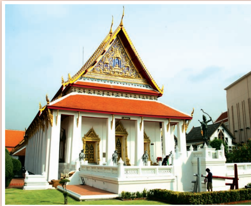
พระที่นั่งพุทธโชศวรชัย

ลักษณะของ “ลับแล” ทั้งสองแผ่นนี้อาจจัดอยู่ในกลุ่มเดียวกับตุ๊กตาจีนสลักหินที่พบประดับประดาตกแต่งร่วมกับอาคารภายในวัดต่าง ๆ ในกรุงเทพฯ - ธนบุรี ที่มีรูปแบบสร้างขึ้นในสมัยรัชกาลที่ ๓ อันเป็นที่รับรู้กันว่า เป็นหินที่ใช้ถ่วงมิให้เรือโคลงในอับเฉาของเรือสำเภาบรรทุกลินค้าที่เดินทางมาจากประเทศจีน