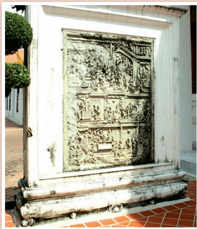
แผ่นหินสลักภาพเรื่องราวภายในกรอบก่ออิฐถือปูนติดตั้งอย่างถาวร ข้างพระที่นั่งพุทไธศวรรย์ด้านทิศใต้