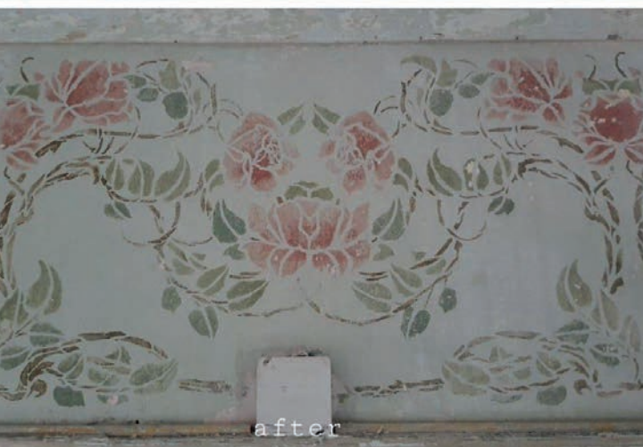
ภาพก่อน-หลังการทำความสะอาด ลวดลายเถาดอกกุหลาบที่พบใหม่

ลวดลาย จึงไม่ได้ให้ความสำคัญโดยคิดว่าเป็นเพียงสีที่เกิดจากการซ้อนทับกันของการใช้งานในยุคหลัง แต่ในระหว่างขั้นตอนการลอกชั้นสีพลาสติกเพื่อเตรียมบูรณะผนังอาคาร ได้มีการค้นพบลวดลายเถาดอกกุหลาบบริเวณคอสองของห้องกลางชั้นบน โดยใช้เทคนิคสแตมป์ (STENCIL) ซึ่งสอดคล้องกับลวดลายบริเวณเพดานที่มีอยู่เดิม การค้นพบบ่งชี้ว่าทำให้ทราบว่าชั้นสีของลวดลายเถาดอกกุหลาบอยู่บนชั้นขัดปูนดำ จึงสันนิษฐานว่าผนังอาคารเดิมนั้นคงมีสีเช่นเดียวกันกับลวดลายเถาดอกกุหลาบด้วยเช่นกัน