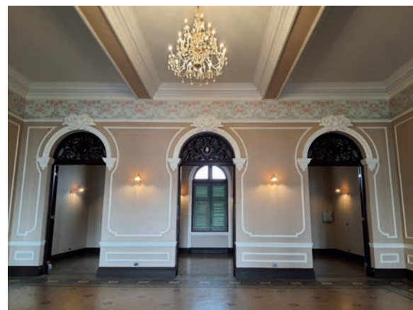
ภาพหลังการบูรณะห้องกลางชั้นบน ที่พบลวดลายเถาดอกกุหลาบ

ลวดลายเถาดอกกุหลาบที่ค้นพบใหม่นั้น นอกจากจะเป็นการค้นพบลวดลายการเขียนภาพตกแต่งผนังอาคารด้วยเทคนิคพิเศษในสมัยนั้นแล้ว ยังเป็นส่วนสำคัญในการสันนิษฐานสีของผนังอาคารเดิม และนำไปสู่การบูรณะโบราณสถานที่ครบถ้วนสมบูรณ์ และคืนสภาพดั้งเดิมของโบราณสถานตามหลักวิชาการอนุรักษ์ของกรมศิลปากรให้ยั่งยืนต่อไป