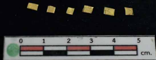
ประติมากรรมรูปเต่าและแผ่นทอง พบจากโบราณสถานสระโบสถ์ อำเภอพิมาย จังหวัดนครราชสีมา