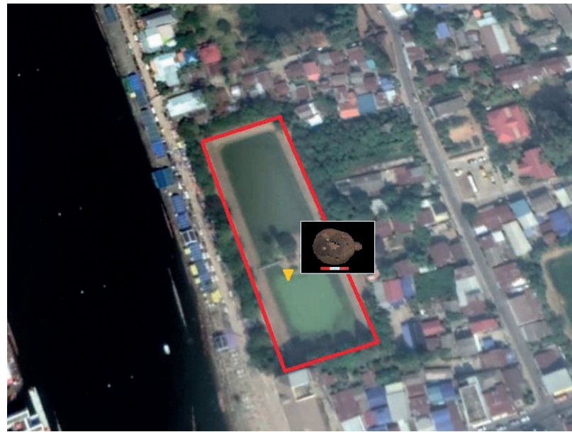
โบราณสถานสระโบสถ์ อำเภอพิมาย จังหวัดนครราชสีมา

รูปแบบแผ่นศิลาฤกษ์ของปราสาทวัฒนธรรม เขมรโบราณที่เคยพบในประเทศไทย แต่เดิมที่เคย ศึกษาและเข้าใจกันมีเฉพาะลักษณะเป็นแผ่นหิน ทรงสี่เหลี่ยมที่มีการเจาะช่องเพื่อบรรจุสิ่งของมงคล เพียงเท่านั้น แต่ในปี ๒๕๖๓ ณ โบราณสถานสระโบสถ์ ซึ่งเป็นสระน้ำโบราณที่ตั้งอยู่บริเวณด้านตะวันตก ของเมืองพิมาย ใกล้กับลำน้ำจักราช ได้ค้นพบ ประติมากรรมรูปเต่าอยู่บริเวณใกล้กับเกาะกลางน้ำ ของโบราณสถานสระโบสถ์ ลักษณะเป็นประติมากรรม รูปเต่าที่ด้านบนกระดองสลักเป็นลวดลายและเจาะช่อง รูปสี่เหลี่ยม ๗ ช่อง ล้อมรอบช่องสามเหลี่ยมขนาด ใหญ่ตรงกลาง ภายในช่องสามเหลี่ยมมีก้อนหินรูป สามเหลี่ยมวางอยู่เมื่อนำก้อนหินสามเหลี่ยมตรงกลางขึ้น และเริ่มทำความสะอาด จึงได้พบชิ้นส่วนแผ่นทอง ขนาดเล็กอยู่ด้านในช่องสี่เหลี่ยมด้านทิศใต้และช่อง สามเหลี่ยมตรงกลาง