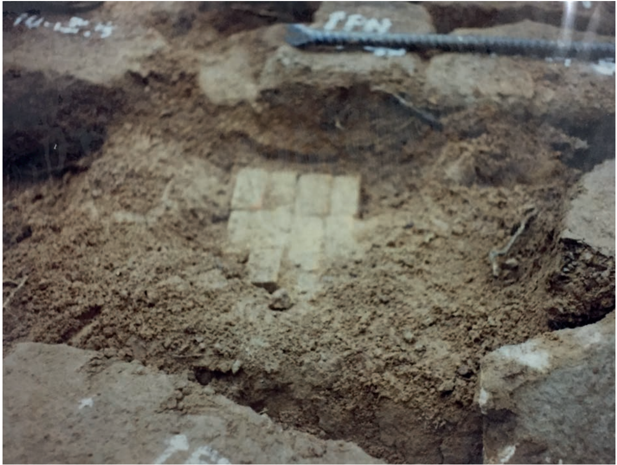
แผ่นอิฐที่ปิดทับแผ่นทองรูปใบไม้ พบจากการขุดรื้อ ส่วนปราสาทองค์ด้านทิศตะวันตกเฉียงเหนือ