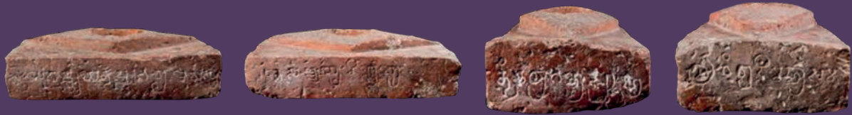
อิฐ (อิฐ?) มีจารึกในคลังกลางพิพิธภัณฑสถานแห่งชาติ

แต่ไม่พบธาตุฟอสฟอรัส (P) ซึ่งฟอสฟอรัสเป็นธาตุ สำคัญของกระดูก ดังนั้นยืนยันได้ว่ากระดูกทำจาก เปลือกหอย เพราะธาตุ Ca ในรูปของแคลเซียม คาร์บอเนต (Calcium carbonate) หรือหินปูนเป็น องค์ประกอบหลักของเปลือกหอย นอกจากนี้พบ ธาตุสตรอนเชียม (Strontium, Sr) ในปริมาณสูงซึ่งเป็น ธาตุที่มีคุณสมบัติคล้ายแคลเซียม พบได้ทั้งหอยน้ำจืด และหอยทะเล แต่หอยทะเลจะพบในปริมาณสูงกว่า หอยน้ำจืด