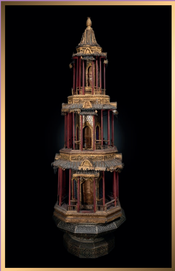
โคมเวียน ประกอบพระราชพิธี พระราชกุศลเทศนามหาชาติ

พระราชนิพนธ์ในพระบาทสมเด็จพระจุลจอมเกล้าเจ้าอยู่หัว เรื่องพระราชพิธีสิบสองเดือน ว่าด้วยพระราชพิธีเดือนอ้าย : พระราชกุศลเทศนามหาชาติ กล่าวถึง การประดับตกแต่งเครื่องบูชาเทศนา ความว่า “...หลังพระที่นั่งเศวตฉัตร ผูกกิ่งไม้ มีดอกไม้ร้อยห้อยย้อยเป็นพวงพุ่มผูกตามกิ่งไม้ทั่วไป...ตั้งหมากพนมพานทองมหากฐินสองพาน หมากพนมใหญ่พานแว่นฟ้าสองพาน แล้วพานนี้เปลี่ยนเป็นโคมเวียน มีต้นไม้งเงินทองตั้งรายสองแถว กระถางต้นไม้ตัดลายคราม โคมพโอมแก้วรายตลอดทั้งสองข้าง...” ๑๔ ปรากฏหลักฐาน