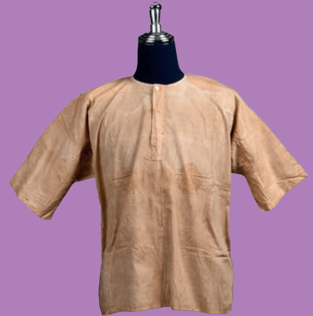
ฉลองพระองค์ พระบาทสมเด็จพระ จุลจอมเกล้าเจ้าอยู่หัว

สำนักพิพิธภัณฑสถานแห่งชาติ กรมศิลปากร ได้ศึกษาข้อมูลของฉลองพระองค์เพิ่มเติม ทั้งจากบันทึกเหตุการณ์วันเสด็จสวรรคต หลักฐานภาพถ่ายและข้อมูลที่เกี่ยวข้องพบว่า เสื้อกุยเฮงเป็นฉลองพระองค์รูปแบบหนึ่งที่พระบาทสมเด็จพระจุลจอมเกล้าเจ้าอยู่หัวเคยทรงอยู่เป็นครั้งคราว เช่น เมื่อครั้งเสด็จประพาสต้นครั้งที่ ๒