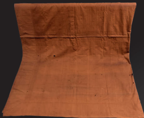
จีวรพีพระหัตถ์สมเด็จพระเจ้าหลานเธอ กรมหลวงเทพหริรักษ์ (ในรัชกาลที่ ๑)

ตามพระธรรมวินัยมีข้อกำหนดการตัดเย็บจีวร คือ ให้นำผ้ามาตัดเป็นชิ้นรูปสี่เหลี่ยมผืนผ้าแล้วเย็บต่อกัน ตามรูปร่างผืนนาข้าว เรียกว่า ผ้าชั้น มีขนาดความยาว ๙ คืบ และความกว้าง ๖ คืบ ไม่เกินคืบสุด ส่วนการ ย้อมให้ใช้น้ำฝาด ๖ ชนิด อันเป็นการรักษาคุณภาพของผ้า เนื่องจากย้อมบางประเภทมีคุณสมบัติทางยา ทำให้ เชื้อราไม่เจริญเติบโต มีสีเข้มไม่เปื้อน และไม่เก็บความชื้น ๑๒ นอกจากนี้ยังมีการกำหนดข้อห้ามการครองจีวร บางสี เพื่อให้เกิดความแตกต่างจากนักบวชนอกศาสนาด้วย โดยในสมัยรัชกาลที่ ๑ ได้มีการตรากฎคณะสงฆ์ และ จัตระเบียบให้สงฆ์อยู่ในพระธรรมวินัย พร้อมกับตำหนักขุนงุ่มห่มแดง และคาดโทษแก่ผู้ชายผ้า “...ลาวพวกก็เที่ยว ซื้อผ้าแพรพรรณในพวงแพแลร้านแขกร้านจีน เอาไปเย็บย้อมเป็นผ้าพาด ผ้าจีวร สบง ...กระทำเป็นศรีเสดศรี ชมภูงุ่มครอง ให้ต้องอาบัติเป็นมหานิสัคคีทุกครั้ง ลาวพวกก็งุ่มแดงห่มแดง ลาวพวกก็งุ่มห่มเป็นแต่ศรีกร้ากรุ่น อำปลั่ง...” ๑๓ แสดงให้เห็นความสนพระราชหฤทัยในการอุปถัมภ์พระพุทธศาสนาตลอดรัชกาล