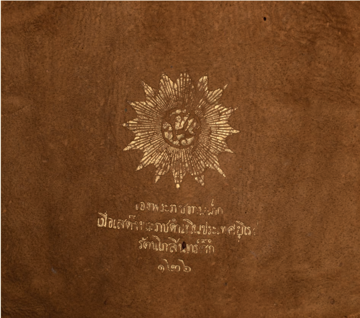
ย่ามอหัมมิกาย : ของพระราชทานฝาก จากการเสด็จประพาสยุโรป