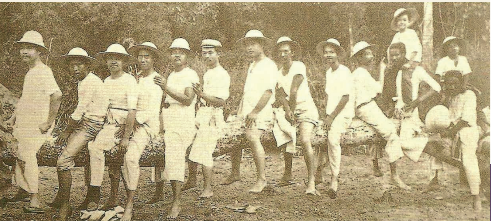
การเสด็จประพาสต้นของพระบาทสมเด็จพระจุลจอมเกล้าเจ้าอยู่หัว รัชกาลที่ ๕ เมื่อ พ.ศ. ๒๔๔๙ ทรงฉลองพระองค์อย่างล้าลองด้วยเสื้อกวยเฮง และกางเกงแพร ๖

ใน พ.ศ. ๒๔๔๙ ทรงฉลองพระองค์อย่างล้าลองด้วยเสื้อกวยเฮงและกางเกงแพร ซึ่งการแต่งกายรูปแบบนี้มีประวัติว่าเริ่มต้นขึ้นในสมัยรัชกาลที่ ๕ ๗