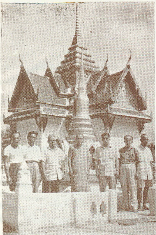
สถูปหลวงพ่อทวด ฯ หน้าวัดข้างใต้ จ. บัตตานี