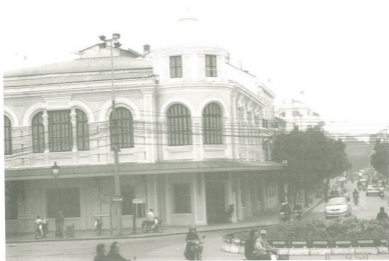
อาคารร้านค้าย่านธุรกิจกรุงฮานอย เมืองหลวงของประเทศเวียดนาม (ในตำแหน่งพื้นที่เมืองเชียงใหม่เรียกแถว)