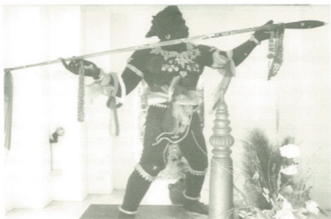
รูปหล่อวีรบุรุษ พุ่่งเศร่้าใต้เมืองลำพูน สมัยพระนางจามเทวี