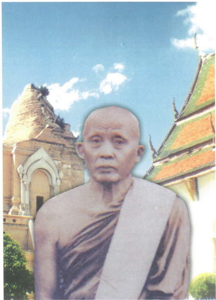
พระมหาหมื่น วุฑฒินญาโณ