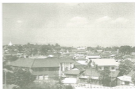
นครเขียงตุง เมืองนอกแห่งรัฐฉานตะวันออก เป็นบ้านตั้งเมืองเมืองเขียงใหม่มาช้านาน ภาพนี้ถ่ายให้เห็นตัวเมืองจากที่สูงเห็นอยู่ไกลโพ้น คือ พระธาตุจอมทอง คู่อ้อมวัดจิตใจของชาวเมือง

เมื่อนั้น พระยาไชยสงครามทรงรำพึงว่า “สำหรับลูกกู เจ้าท้าวแสนภูนี้เป็นผู้รู้ผู้ฉลาดเป็นคนดีเสมอต้นเสมอปลาย มีอภัยข้ายใจคอกว้างขวาง รู้ราชประเพณีทุกประการดีจริง ควรกูอภิเษกลูกกูคือเจ้าแสนภูให้ครองเมืองเขียงใหม่ครั้งที่สองเถาะ” พระองค์เสด็จมาแต่เมืองเขียงราย มาอภิเษกพระโอรสเจ้าแสนภูให้ส่วยเมืองเขียงใหม่ในปีชวด จุลศักราชได้ ๖๘๖ (พ.ศ.๑๘๖๗) วันนั้นแล