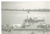
ท่าเทียบเรือที่อำเภอเชียงแสน จังหวัดเชียงราย แม่น้ำโขง เป็นเส้นทางคมนาคมทางน้ำสำคัญ ของประเทศลุ่มน้ำโขง ไทย พม่า จีน ลาว สปป เวียดนาม