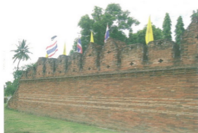
กำแพงเมือง จังหวัดเชียงใหม่