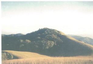
ทัศนียภาพอันงดงามล้ำ ของภูตอย (ตอยม่อนจอง) ในเขตอำเภอมวกเกอย จังหวัดเชียงใหม่

อาณาจักรล้านนา ที่เคยยิ่งใหญ่ไพศาลในอดีต มั่งคั่งรุ่งเรืองด้วยทรัพยากร.... ตอยใหญ่!... ไทรกว้าง แม่น้ำสาธาร...ห้องทุ่งตระการ... บ้านเมืองใหญ่ไม่น้อย จงภูมิใจในชาติพันธุ์และถิ่นกำเนิดของตนเถิด