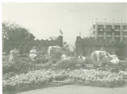
กำแพงเมืองลำพูน