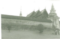
วัดพระธาตุลำปางหลวง อำเภอเกาะคา จังหวัดลำปาง เป็นปูชนียสถานสำคัญแก่แม่พระแก้วคอนเท้าที่ประดิษฐานอยู่ที่นี้

๔ จำพวกเป็นประธาน และคณะสังฆเจ้า มีพระมหาราชครูเจ้าเป็นต้น ได้นำเอาขี้เครื่องมหาทานทั้งหลาย หมายถึงมหาอุฐบริวารและสุวรรณมัญจาคองคำอาสนะพระพุทธรูป งามช้าง ชงกระด้างช่อช้าง ๖ ตัว ทีบหลวงใส่พระคัมภีร์ ชงพระบรมภูจลินท์คำและเครื่องท้าว ๕ ประการ เติงฉัตรพัดค้ำจามร ละแอบังวัน ไม้เท้า ไม้ว่าฉัตร สัตตา สัตตยุกลา ช่อช้าง โคมไฟ ช่อน้อย ชงชัย แต่เป็นขบวนนำหน้า ยกออกจากพระนครเชียงใหม่ ไปด้วยลำดับตามทาง ๕ วันไปถึง “เมืองกุ๊กกฏันตเสหะพรหมเขलगนครชัยสุวตี” (ลำปาง) แล้วอยู่ถึงเดือนยี่เพ็ญวันอังคาร ก็ได้บรมเม็กบายลงสมโภชข้อฟ้าพระวิหาวและถวายทานแก่พระภิกษุสงฆ์ มีพระมหาชินธาตุเจ้า วัดหลวงลำปางที่นั่นเป็นประธาน เป็นมหาสมัยกัลปนาครั้งใหญ่ มีการละเล่นสนุกจุดบั้งไฟ ไฟพะเนียง ไฟประดับไฟเทียนไฟราว เป็นอันสนุก สุขสันต์ ทาพระมาดมิได้แล