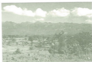
เมืองต่วน ในรัฐฉาน พม่า

สำหรับนายคำมูล นายวอน นายน้อยกาวิละ เข้าไปเกลี้ยกล่อมเจ้าฟ้านครเชียงตุงให้ประกาศ อิสรภาพจากพม่า ฟ้าเชียงตุงไม่ร่วมมือด้วย กลัวไพร่เมืองจักลำบากถึงหาย เขาทำนทั้งหลายจึงเลยขึ้นไปชักชวน เจ้าฟ้าเมืองยอง ประกาศอิสรภาพจากพม่า เจ้าฟ้าเมืองยองก็พอใจแต่ไม่อาจเอาชนะพม่าได้ นายคำมูล นายวอน นายน้อยกาวิละฟ้าเมืองยอง จึงพากันหนีมาทางเมืองเกาะเมืองไซ และเมืองหลวงพุกา จึงมาถึงเมือง