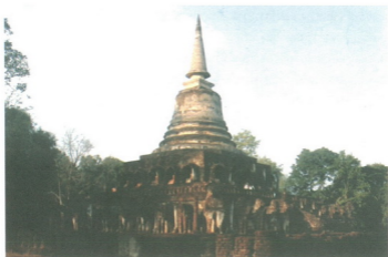
ปูชนียสถานที่อำเภอศรีสันาลัย จังหวัดสุโขทัย

เมืองสำหรับแนวปะทะศตวรรษที่สิบและราชวงศ์ สมัยราชวงศ์มังราย เมืองน้อยตั้งอยู่กึ่งกลางอำเภอป่ากับอำเภอเวียงแหง