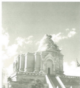
พระธาตุเจดีย์หลวง

ที่นี่ จักกล่าวคืนหลังก่อนแล ในเมื่อเจ้ากือนาจุตินั้นวางจิตไม่ถูก ตายไปเป็นรุกขเทวดาอยู่ยังไม้โคจรต้น ๑ ริมหนทางไปเมืองพุกาม ยังมีหอคำเมืองเชียงใหม่หมู่ ๑ ไปคำเมืองพุกาม กลับมาพักนอนได้ริมไม้โคจรต้นนั้น เจ้ากือนาซึ่งเป็นรุกขเทวดาก็สำแดงให้ปรากฏ แล้วบอกแก่พ่อค้าทั้งหลายหมู่หนึ่งว่า ภูนี้เป็นพระยา กือนา กูอยู่เป็นพระยาในเมืองเชียงใหม่ นิยมด้วยคชศาสตร์เทพ คือเป็นหมอช้าง ตายมาเป็นเทวดาอยู่ไม้โคจรต้นนี้ จักไปเกิดเทวโลกไม่ได้ สูงบอกแก่ลูกกูเจ้าแสนเมืองมา ให้สร้างเจดีย์ไว้ ณ ท่ามกลางเวียงองค์ ๑ สูงพอคนอยู่ไกล ๒,๐๐๐ วา มองเห็น แล้วจึงให้ทานหยาดน้ำอุทิศบุญให้แก่กู ก็จึงไปเกิดเทวโลกได้ชะแลฯ ว่าอย่างนั้น พ่อค้าทั้งหลายพวกนั้น ก็มาบอกแก่ เจ้าแสนเมืองมกด้วยดังว่านั้น