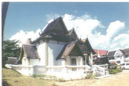
วิหารเสนาบดี หล้าเมืองเชียงใหม่