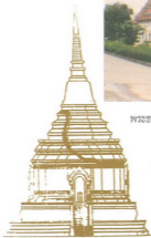
แบบสันนิษฐานพระธาตุเจดีย์หลวง ก่อนเกิดแผ่นดินไหว ตามรอยกลางภาพ