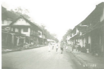
บรรยากาศถนนเข้าในเขตตัวเมืองหลวงพระบาง โดยหนังสือตำนานเรียกชาวข่ามี (ฉบับลาว)

บิจอ พระเป็นเจ้าไปเมืองหลวงพระบาง ได้หมื่นแก้งตีนเชียง ของน้อย ของหลวง ไปถึงแก้งและให้หมื่นแก้งตีเชียง กับชาวเชียงใหม่และชาวต่างเมือง ไปทางเมืองเหล็ก ออกมาทางนูนแม่โขง พระเป็นเจ้าไปถึงแล้วกลับ หมื่นแก้งตีนเชียงไปถึงนูนแล้วกลับ พระยาหลวงพระบาง ให้หมื่นชวาศิก ถือพลศึกขึ้นมาตามลำแม่โขง หมื่นพรานดงว่า "หลวงพระบางมาตามพระเป็นเจ้าฉันนี้ ข้าชั้นอาสารบ รบหลวงพระบางตีตกแม่น้ำโขงให้ตายหมดสิ้นแล"