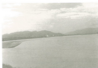
แม่น้ำโขง ณ จุดเชื่อมต่อกับประเทศ ๓ ประเทศไทย หน้า ลาว บริเวณพื้นที่สามเหลี่ยมทองคำ

พระเจ้าแสนภูเสวยเมืองได้ ๗ ปี บังเกิด พยาธิทามอมกทำนายในที่สังัด ทมอทำนายว่า “อายุพระองค์ หมัดไม่มีนี้” วาอย่างนั้น เสนาอำมาตย์ทั้งหลายพร้อมกันแต่ง อุบายคาดขานาเรือ ๒ ลำใหญ่นักเอาปราสาทขึ้นตั้ง ทำที่ว่า พระยาเจ้าจักอยู่เย็นใจสุขสำราญในที่สังัด ในท่ามกลางแม่น้ำ โขงว่าฉันนี้ ไม่แสดงให้รู้ว่าเม็นพยาธิให้ผู้ใดรู้สึกคน ถ้าให้คนทั้ง หลายรู้จักปรากฏแก่ท้าวพระยาต่างประเทศ เหตุว่าจักมา ประจวบรบ้านเมืองจักเป็นศึก ครั้นเสร็จแปลงแล้ว ก็เอาขึ้น สู่ปราสาทที่ตั้งอยู่ขานาเรือยังท่ามกลางแม่น้ำโขงแล้ว ให้ซึ่ง เชือกข้ามแม่น้ำโขงแล้ว ตรงทำพระหินรอดดอนแทน มาถึง ท่าทาง เพื่อไม่ให้เรือขึ้นล่องได้สักลำอยู่ ๓ วัน พระยาภิสวรรค์ นั้นแล เขาก็เอาพระยาเสีโกศทองคำให้หนึ่งไว้ท่ามกลางน้ำแม่โขง ได้ ๒ เดือน ให้ข่าวสารมาบอกแก่พระยาคำฟูเจ้า พระยาคำฟู แต่งตั้งพระโอรสคือเจ้าท้าวผายุให้อยู่รักษาเมืองเชียงใหม่ ส่วน พระองค์ก็เอารั้วเสลาขาวเชียงใหม่ ชาวฝาง ชาวเชียงรายไอนัน ๒๕๐,๐๐๐ คน มาถึงเชียงแสนแล้ว เสนาทั้งหลายให้ดูระดุดก โภทำทนายแล้ว ออกว่าให้เอาศพพระยาไปไว้เวียงเก่าด้านเหนือ สบกก ตรงท่าตลาด (ข้าว)เปลือก จึงให้ขุดหลุมใหญ่ สร้างหลังคาเรือนคลุม คนทั้งหลายให้ล่องขานาเรือจอดตลาด ข้าวเปลือก เข้ายกโกศทองคำออก คนทั้งหลายจึงรู้ว่าพระยาสวรรคตนั้นแล คนทั้งหลายก็เอาโกศทองคำใส่หลุม นั้นแล้ว ให้เอาเครื่องเงินเครื่องทองคำใส่ถาดทองคำ ลงตั้งไว้ ๒ ข้างโกศทองคำแล้ว ก็แต่งตั้งขุนนางกับคนทั้งหลาย ไว้เป็นข้าอยู่รักษาทั้งหมด ๕๐ ครั้ว ภายหลังข้ามีทั้งหลาย เขาแบ่งกันมาเป็นคนทามเสีเลี้ยงสังฆราชวัดพระหลวง ๒๐