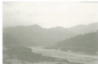
แม่น้ำสาละวิน แม่น้ำโบราณชาติที่ลึกเขี้ยวและเย็น ภาพทั้งนี้ก็เป็นช่วงโชติช่วงพระมอญพม่า-ไทย ที่ย่านอำเภอสะเรียง จังหวัดแม่ฮ่องสอน

จุลศักราช ๑๐๕๐ (พ.ศ.๒๒๗๑) ปีวอก เดือน ๔ ออก ๕ ค่ำ ไป (แม่ทัพ) สะแง่งพะยะ ยกทัพจากกรุงอังวะข้ามแม่น้ำคง (สาละวิน) มา เจ้าองค์คำเอาหมู่ไทยชาวเวียง ๒๐ คน ไทใหญ่ ๒๐ คน พม่า ๒๐ คน เป็น ๖๐ คน ไปต้อนรับทัพแห่งพะยะ แห่งพะยะว่า "จักเอาหมู่ไทยอันไปต้อนรับ ๒๐ คนนั้นเล่าเสีย" เขาผู้ตัวก่อนหลบหนีพันมกได้ เหลือแต่พม่าและไทใหญ่ ๔๐ คนนั้นไม่หนี เจ้าองค์คำกลับมาถึงเวียง พระยาเจ้าและขุนเมืองพร้อมกันไหวสาเจ้าองค์คำว่า "หากเจ้าจักเป็นพม่าพวกข้าฮอนนี้ หากเป็นใจกับพม่าพวกข้าตายหมดสิ้นแลไทยที่ไปต้อนรับพม่า ๒๐ คนชายังจักฆ่าทิ้งเสีย ด้วยเหตุนี้แล พวกข้าฮอสูรับ" ครั้งที่ ๑ ครั้งที่ ๒ เจ้าองค์คำว่า "รบก็รบแล"