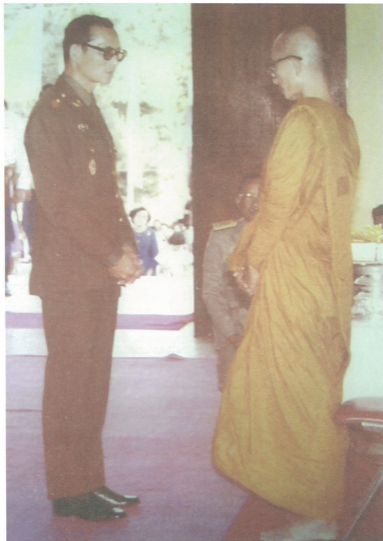
พระบาทสมเด็จพระเจ้าอยู่หัว ภูมิพลอดุลยเดช มหาราช องค์เอกอัครศาสนูปถัมภก

เสด็จฯ ทรงประกอบพิธีตัดทวยลูกนิมิต ผูกพัทธสีมา วัดป่าตาราภิรมย์ อ.แมริม จ.เชียงใหม่ เมื่อวันที่ ๑๔ กุมภาพันธ์ พ.ศ. ๒๕๒๓