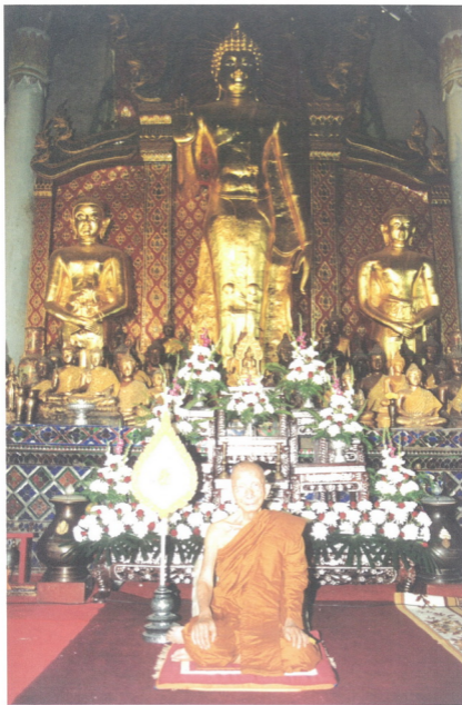
พระอัฐารส พระประธานในพระวิหารหลวง