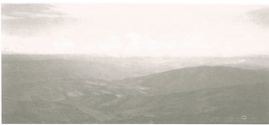
เวียงวังสุทสาธา เขื่อนราชบุรินทร์ชัยซ้อน เมืองเมืองนันทบุรี (น่าน) เป็นองค์นิยภาพที่งามล้ำ สุดจะหาที่ใดเปรียบปาน เขาใหญ่ ไหวกว้าง ล้ำธาร ทั่วจักรวรรดิชาติ ที่กำลังถูกทำลายจนหมดวิถี