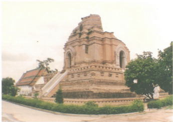
พระธาตุเจดีย์หลวง ตั้งอยู่ในท่ามกลางนครเชียงใหม่ สูงใหญ่ที่สุดในอาณาจักรล้านนา ส่วนยอดที่พังทลายลง เพราะแผ่นดินไหว เมื่อ พ.ศ.๒๐๑๘