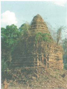
พระบรมธาตุคอกยสุเทพ

วัดพระธาตุคอกยสุเทพราชวรวิหาร อำเภอเมือง จังหวัดเชียงใหม่