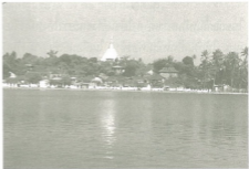
หนองตุงแห่งนครเชียงตุง พระธาตุที่เด่นสง่าอยู่เบื้องหลังนั้นคือ พระธาตุจอมทอง ศูนย์รวมจิตใจชาวเชียงตุง

ในปีมะแม จุลศักราชได้ ๘๘๕ (พ.ศ.๒๐๖๖) พ่อท้าวเชียงคอง กับพระยาหินเชิงกันครองเมืองเขมรรัฐ (เชียงตุง) พระยาหินไปพึ่งฟ้าคำแลบ พ่อท้าวเชียงคองหนีพึ่งพระยาแก้ว พระยาเด็กผู้อาร์ครองเมืองไว้ให้ พระยาแก้วให้หมื่นยี่อ้ายอยู่รักษาเมืองเชียงใหม่ ให้แสนยี่ตึงไชยนำวีรพลสองหมื่นเศษ นำเอาพ่อท้าวเชียงคองไปครองเมืองเขมรรัฐ ขึ้นไปทางเมืองเชียงแสน หมื่นสร้อย สามล้านนำวีรพลสองหมื่นเศษไปทางเมืองสาต แสนยี่ตึงไชยไปถึงเมืองเขมรรัฐก่อน ให้ตนเข้าไปว่ากล่าวแก่พระยาเด็กผู้อาร์เมืองไว้ ให้ออกมาอ่อนน้อมต้อนรับพ่อท้าวเชียงคอง แต่พระยาเด็กไม่ยอม แสนยี่ตึงไชยจึงยกพลเข้าชิงเอาเมืองเขมรรัฐได้แต่เมืองเปล่า พระยาเด็กหนีไปขอความช่วยเหลือจากฟ้าคำแลบ