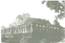
เมืองเก่ากำแพงเพชร มีศาลาเสนาในพุทธศาสนา ที่สร้างด้วยศิลาแลงจำนวนมาก แต่ละแห่งมีขนาดใหญ่มากและสร้างอย่างประณีต

เมื่อئั้น แสนฆานองคินมาบรึกษาเสนาทั้งหลายว่า "เราทั้งหลาย จักรีบสงสการปลงศพเจ้าเทื่อนอ้าวไม่กัน เป็นจริงเที่ยงแท้ว่า ท้าวมหาพรหมก็เที่ยวไปชวนพระบรมไตรจักร ให้มาช่วยตนครองเมืองเชียงใหม่ไม่ผิดชะแล เราควรเอาศพเจ้าเทื่อนอ้าวไว้ในเวียงดีแล หากจักเอาเข้าทางประตูเวียงไม่ควรเดียวมันแสดงภายหลัง"ว่าอย่างนั้น เขาจึงพร้อมกันเจาะกำแพงข้างเวียง ตรงวัดพราหมณ์เอาศพเจ้ากือนาใส่โกศทองคำ สร้างสะพานข้ามคูเวียง เอาเข้าไปไว้เชียงขวางแล้ว จึงให้หมีนโลกันควร กลับไปรักษาเมืองนครเขลางค์นั้นแล