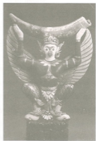
งาช้างดำเป็นวัตถุมงคลคู่เมืองน่าน ปัจจุบันอยู่ในพิพิธภัณฑสถานแห่งชาติน่าน อำเภอนาน้อย จังหวัดน่าน (นันทบุรี ไม้ค้ำน่าน)