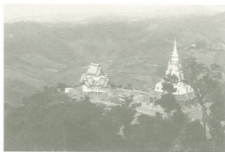
พระบรมธาตุศรีนครินทรวรมณกาลันต์คีรี วัดสันคีรี แม่ระสอง อ.แม่ฟ้าหลวง จ.เชียงราย

พระเจ้ามังรายได้พระโอรสเมื่อ ปีจอ จุลศักราชได้ ๖๒๔ (พ.ศ.๑๘๐๕) ต่อมาไม่นาน พระองค์ได้เสด็จตามรอยช้างมงคลที่ปล่อยไปทาง หัวคอยด้านตะวันออก พระองค์ได้ทอดพระเนตรเห็น ภูมิประเทศแห่งหนึ่งริมแม่น้ำกม มีเนินเขาสูงตระหง่าน งามนัก จึงทรงคำนึงในพระทัยว่า "เมื่อปู่เจ้าลาวจกสร้าง บ้านให้ปู่เราเจ้าลาวเกล้าอยู่ได้ยืนยาวเชิงคอยผาเหล่านั้น เมื่อปู่เราเจ้าลาวเคียงสร้างเมืองเงินยาง ก็ริมเชิงเขาทั้ง สามคือ คอยตุง คอยท่า คอยยาเฒ่า นั่นดีแท้ เหตุ ดังนั้น ควรเรากระทำเนินคอยให้เป็นสถิตเมืองคืออยู่ ท่ามกลางเมืองสมควรมักแล" พระเจ้ามังราย จึงสร้าง