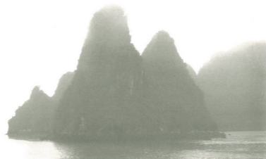
อ่าวฮาลอง (ฮาลองเบย์) ของประเทศเวียดนาม มีทัศนียภาพที่งดงามไม่แพ้ภูเขาลินของประเทศจีน และได้รับการประกาศยกย่องให้เป็นมรดกโลกด้วย