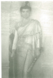
พระนางจามเทวี ปฐมขัตติยานี แห่งลำพูน