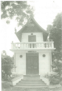
หอธรรมหลังสุดท้าย ปัจจุบันคือสร้างอาคารพุทธพจนวราภรณ์ เมื่อ 25 เมษายน พ.ศ.2548