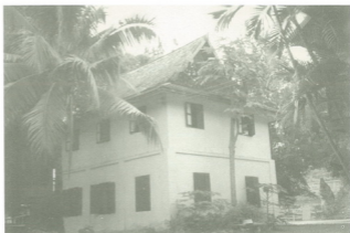
หอธรรมหลังเก่า ปัจจุบันคือสร้างกุฏิสมเด็จพระ เมื่อ พ.ศ. ๒๕๓๐