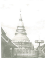
พระธาตุหริภุญชัย แห่งเมืองลำพูน สร้างในสมัยพระเจ้าอาทิตย์ราช รัชกาลที่ ๓๓ แห่ง จามเทวีวงศ์

พระยาพันธุมดีธรรมิกราชเมืองลังกา สบศักราช ๕๖๐ นั้นเสียแล้ว ตั้งศักราชใหม่ (เป็นมหาศักราชหรือพันธุมดีศักราช) เริ่มนับ ศักราช ๑ ต่อมาได้ ๓๔๓ ปี พระยาอาทิตย์เป็นพระยาครองเมือง หริภุญชัยได้ ๓ ปี ก่อพระเจดีย์หลวงลำพูน ศักราชเก่าใหม่รวมกันได้ ๙๐๖ ปี ตั้งแต่พระพุทธเจ้าปรินิพพาน (ลำพูนหริภุญชัยสร้างเสร็จ อัญเชิญ พระนางจามเทวีครองราชย์ ๑๒๐๖ รัชกาลที่ ๓๓ คือ พระเจ้าอาทิตย์ราช ครองราชย์ พ.ศ.๑๕๕๖ และทรงสร้างพระเจดีย์หลวงลำพูน หรือพระธาตุ หริภุญชัย จามเทวีวงศ์สืบสันตติวงศ์ ๔๙ รัชกาล พระเจ้าชัยบาเป็นองค์ สุดท้าย)