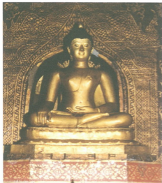
พระพุทธรูปสีหิงค์ ณ วิหารลายคำ วัดพระสิงห์วรมหาวิหาร จ.เชียงใหม่