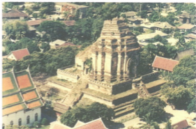
พระธาตุเจดีย์หลวง วัดเจดีย์หลวงวรวิหาร จ.เชียงใหม่