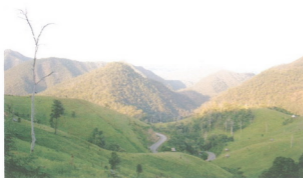
เส้นทางสู่แม่ฮ่องสอน เมืองแห่งขุนเขา ๓ หมอก