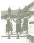
อนุสาวรีย์สามกษัตริย์ ตั้งอยู่หน้าคุ้มหรือวังเก่า ปัจจุบันเป็นหอศิลป์วัฒนธรรมเชียงใหม่

เมื่อภายหลัง พระยาเง่าเมืองไปหาพระเจ้าม้งรายถึงที่อยู่ พระยาเง่าเมืองกล่าวกับพระเจ้าม้งรายว่า “ท้าวว่งมันรู้ศาสตร์ศิลป์อาคมต่าง ๆ มากนัก ออกมาเป็นอันใดก็แปลงเป็นอันนั้นเก่งกลัหนัก ต่อไปภายหลังการว่าเมี่ยงท้าวว่งมีใจอาตตต่อเรา ท้าวว่งได้มีรักชอบเมี่ยงข้า สหายเจ้าได้มาตัดสินท้าวว่งให้มีศีลขอขมาแก่ข้า ควรวเราทั้ง ๒ กระทำสิ่งให้มันจึงอย่าสงสัยซะแล้วว่าอย่างนั้น เจ้าม้งรายจึงว่า “ดีนักแล ฉั้นใด จักดีไม่ว่าสหายแล”