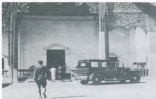
๖.๑๖ เสด็จพระราชดำเนินไปนมัสการพระเจ้าตนหลวง

เมื่อครั้งเสด็จเยือนมณฑลพายัพ พ.ศ. ๒๔๕๖ (๒๔๖๑)