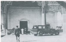
๖.๑๖ เสด็จพระราชดำเนินไปนมัสการพระเจ้าตนหลวง เมื่อครั้งเสด็จเยือนมณฑลพายัพ พ.ศ. ๒๔๕๖ (๒๔๖๑)

เมืองแช่ เมืองแรม แลหัวเมืองทั้งหลาย ซึ่งมาขึ้นพระราช สมภารหอคำเมือง เชียงตุง เมืองยอง เมืองเชียงรุ่ง เมือง แช่ เมืองแรม ทุกบ้านทุกเมือง ขอเมตตาเป็นเจ้า ศรัทธาช่วยกันคิด