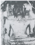
พระเจ้าตนหลวงทุ่งเมี่ยง ก่อนได้รับการบูรณะ พ.ศ. ๒๔๖๐

บัดนี้จักกล่าวถึงสารูปพระพุทธรูป โคตมมองค์ใหญ่ อันปุยา ๒ เฒ่าได้ สร้างไว้แต่เดิมมา สรีระภควา มีรอย แตกอิฐระกัสนั้นแยกเสียกัน ก็บมีเ คนใดจักมาปฏิสังขรณ์ซ่อมแซมเตาะต่อ เท่าเอาก่อนอิฐมาก่อขึ้นภายหลัง พระสถิตดา ก่อกรรมสรีระภควาเข้าไป แถมเส้า ทั้งหัวเสาเค้าชา มาบัดนี้ครู บาศรีวิไชยให้เอาอิฐระกานั้นออก บ่ห้อมีหินปูนทรายอ้อมพอกเหมือน ดังเช่นภายหลัง ห้อมีแต่พระพุทธรูป สถิตนิจอยู่และได้จ้างหมู่สี่มือดี ชำระขัดสี ต่อเตาะตอมดี บมีที่แตก ห้อมี เหมือนชั้นแรก ที่ ๒ เฒ่าได้สร้างแปลงมา จึงได้เอารักหางทา สุวรรณะวิม ปิตา ดิตคำแถมใหม่ ฝับทัวโค้ว กายะพุทธรูปา เพื่อจักได้เป็นที่มุนษย์เทวา สักการะวันทนาบูชา ยาวะสาสน์ ตราบเสี้ยง ๕,๐๐๐ พระวัสสา