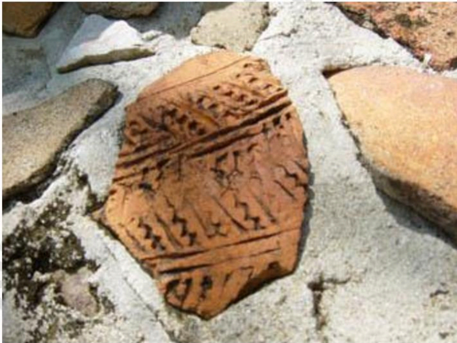
เศษภาชนะดินเผาที่พบเป็นจำนวนมากในบริเวณวัดเขากระฉูด