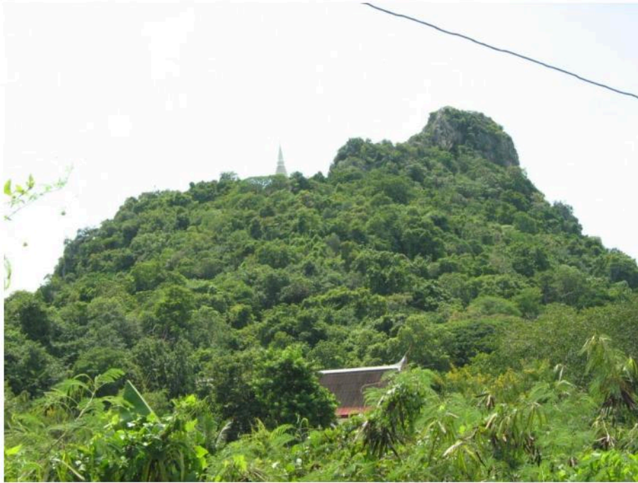
เจดีย์บนยอดเขา ภายในวัดบรรพตवास (วัดเขากระฉิว)