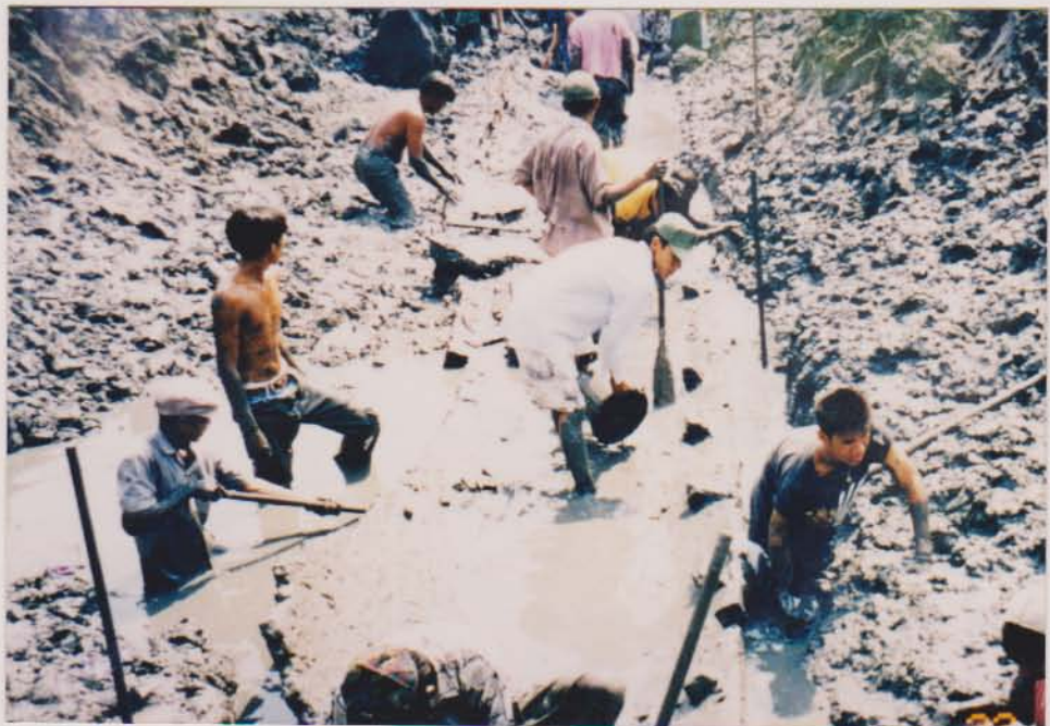
ชาวบ้านกำลังขุดเรือบ้านหอม