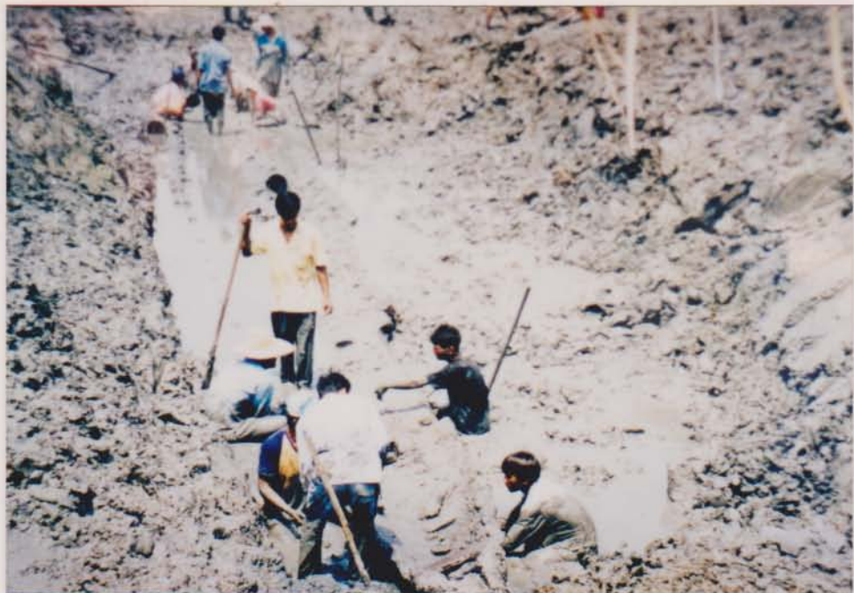
ภาพขณะชาวบ้านกำลังขุดเรือบ้านขอมเมื่อวันที่ 9 เมษายน 2541