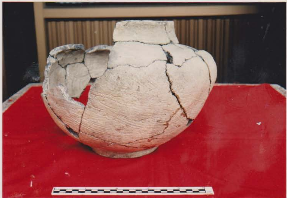
หม้อก้นกลมมีเชิงเตี้ย