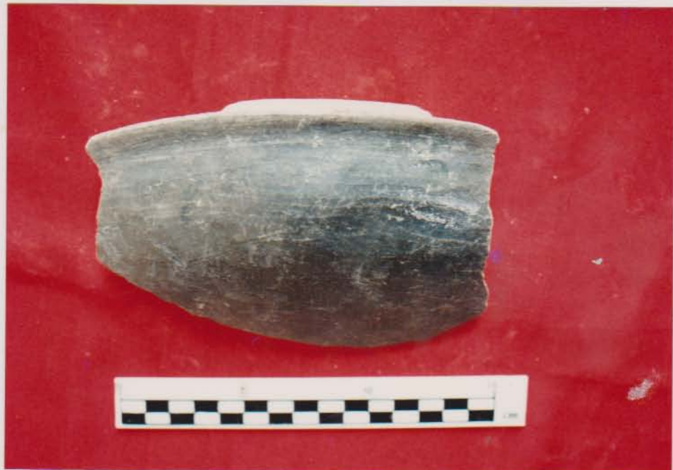
ชิ้นส่วนลำตัวหม้อมีสันพบจากเรือบ้านขอม