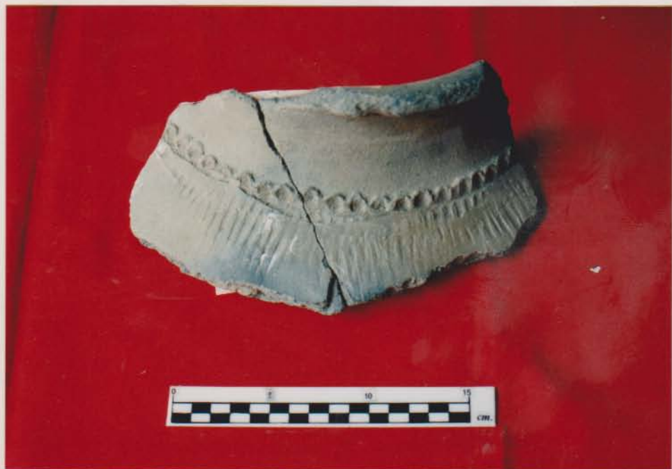
ส่วนไหล่ภาชนะดินเผาเนื้อหยาบ มีการตกแต่งด้วยการกดประดับด้วยรอยนิ้วมือและลายขีดขีด