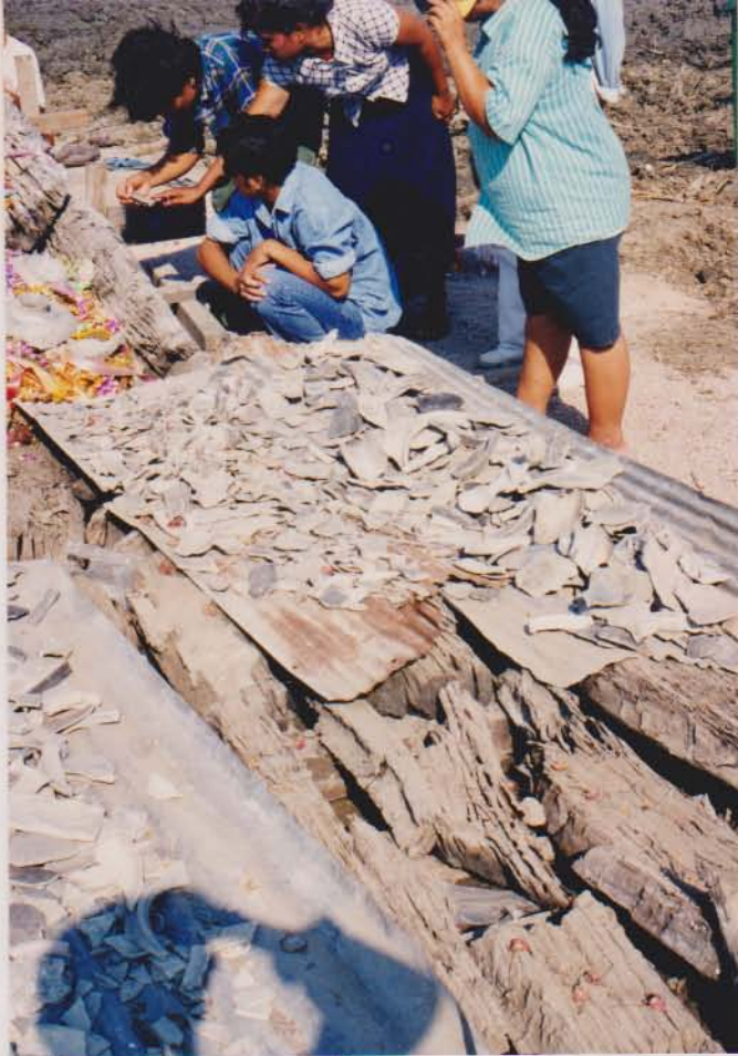
ชิ้นส่วนภาชนะดินเผาที่พบจาก แหล่งเรือจมบ้านขอม