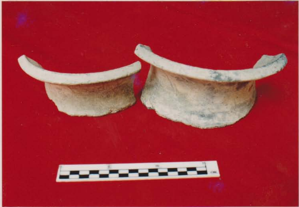
ชิ้นส่วนหม้อปากบานพบจากแหล่งเรือจมบ้านขอม