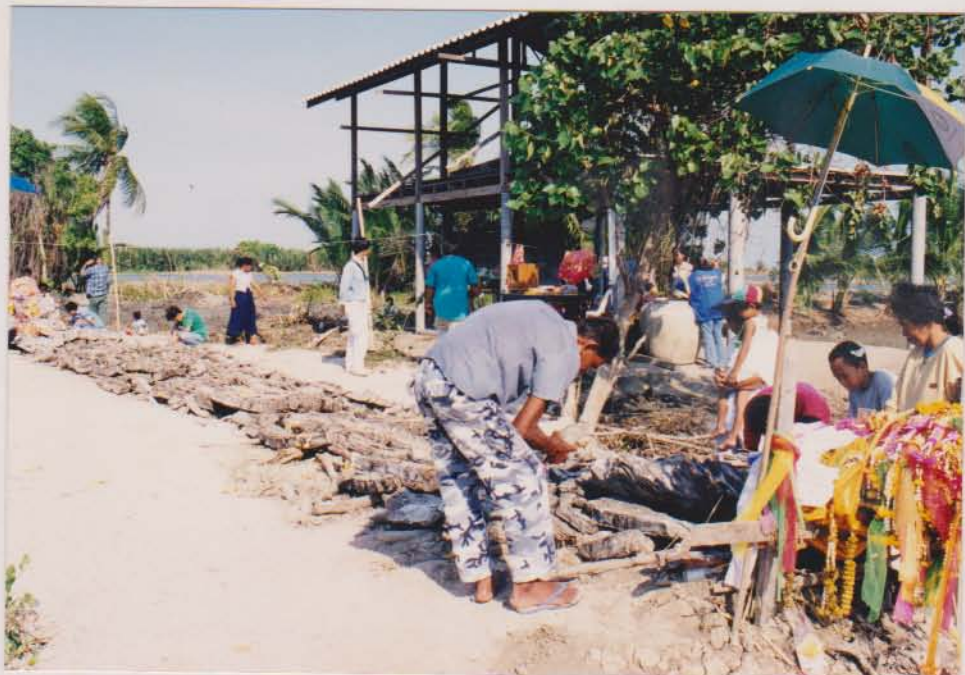
สภาพของเรือบ้านขอมเมื่อยกขึ้นมา