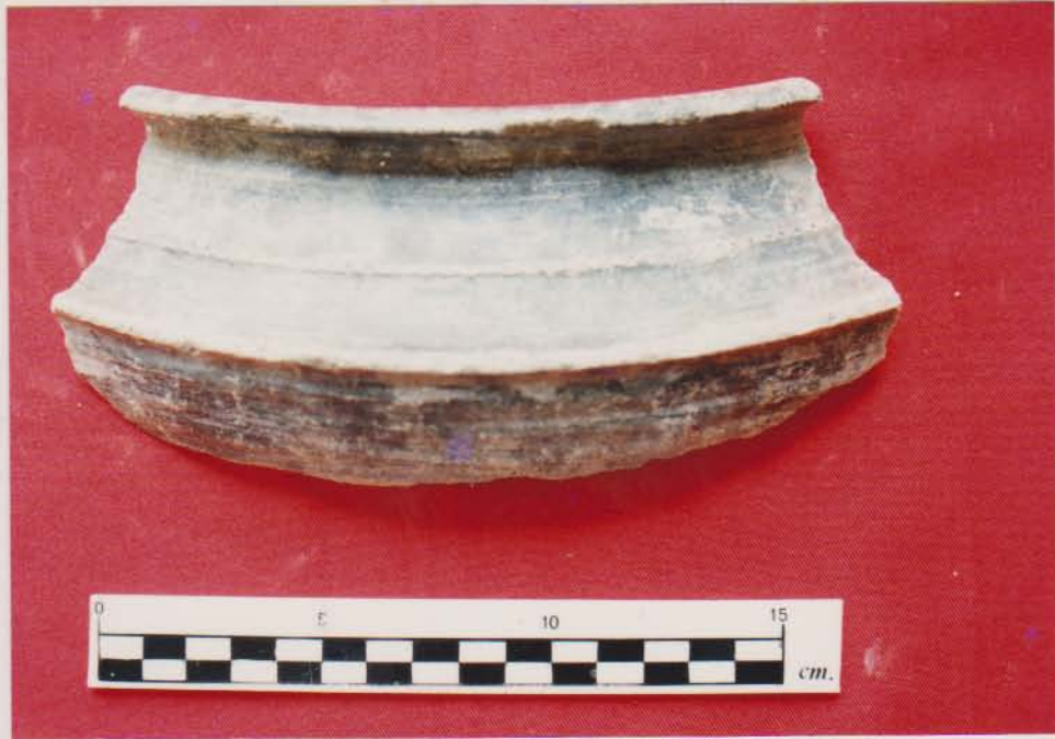
ชิ้นส่วนปากของหม้อมีสัน พบจากเรือบ้านขอม อ.เมือง จ.สมุทรสาคร