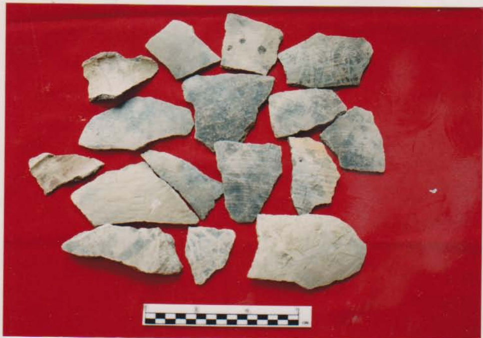
ชิ้นส่วนภาชนะดินเผาเนื้อหยาบแบบผิวเรียบ