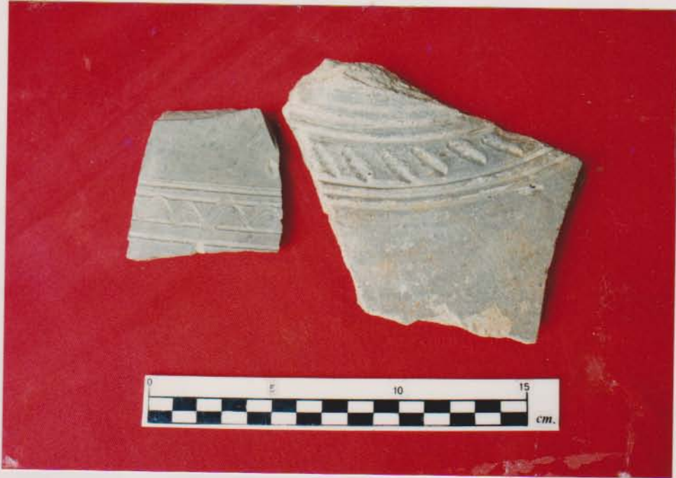
ชิ้นส่วนไหมีลายตกแต่งเป็นลายลูกคลื่นและลายเส้น