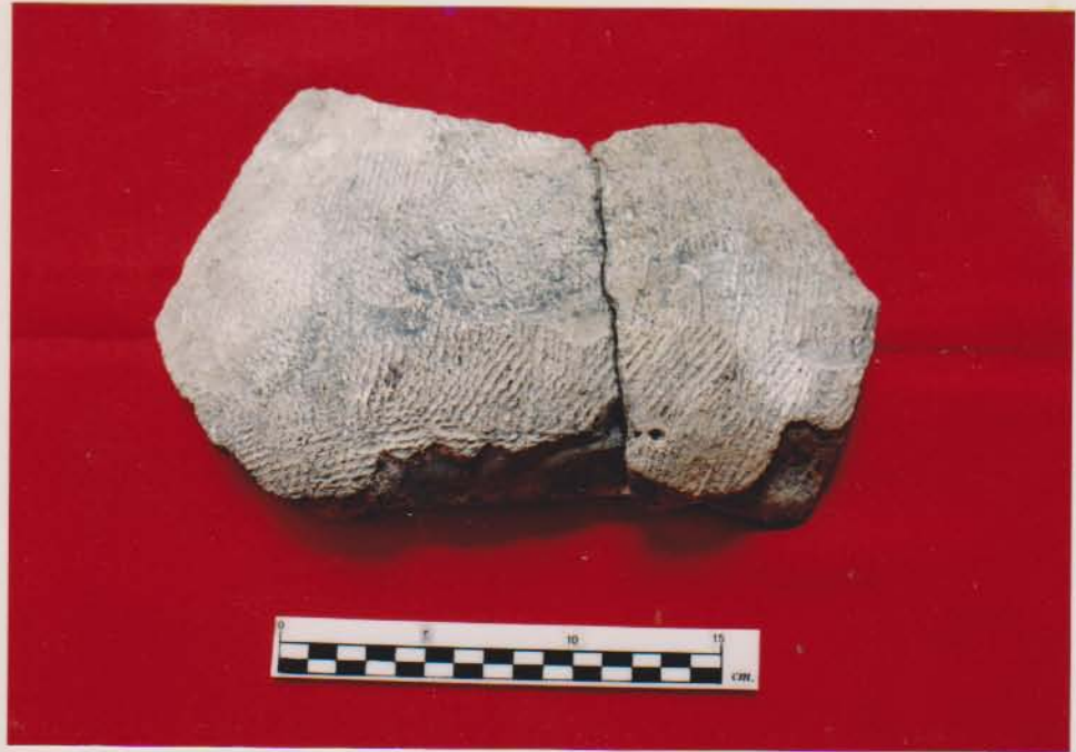
ชิ้นส่วนภาชนะดินเผาเนื้อหยาบ มีการตกแต่งผิวด้วยลวดลายเชือกทาบ