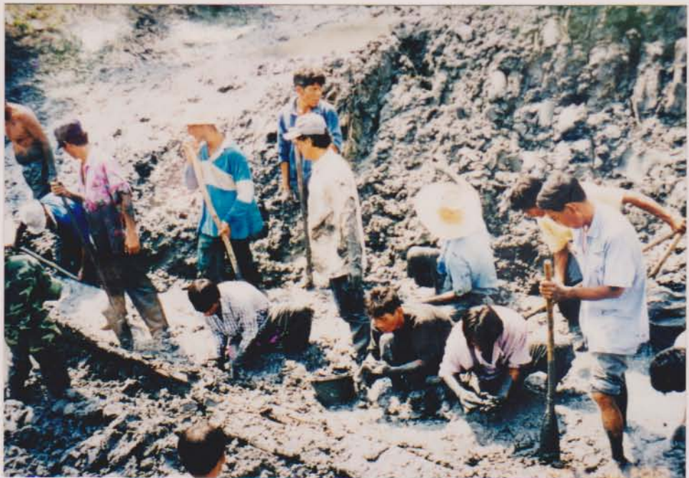
ชาวบ้านกำลังขุดเรือบ้านหอม