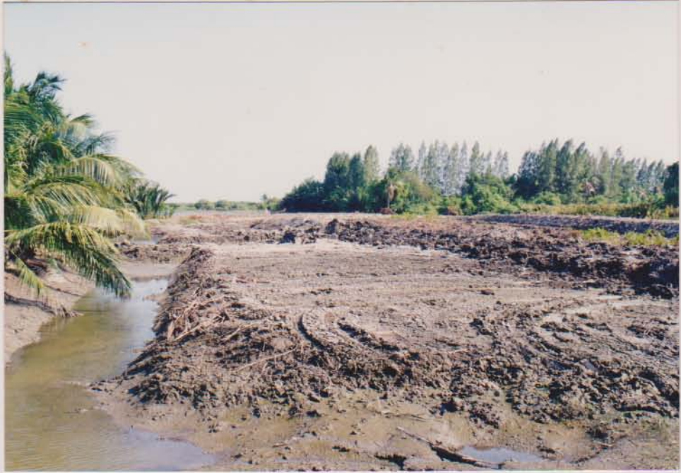
แหล่งเรือจมน้ำขอม ต.โคกขาม อ.เมือง จ.สมุทรสาคร