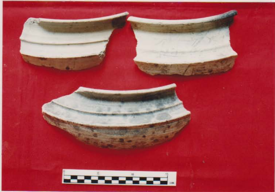
ลักษณะการตกแต่งสันหม้อของหม้อมีสัน ที่พบจากเรือบ้านขอม