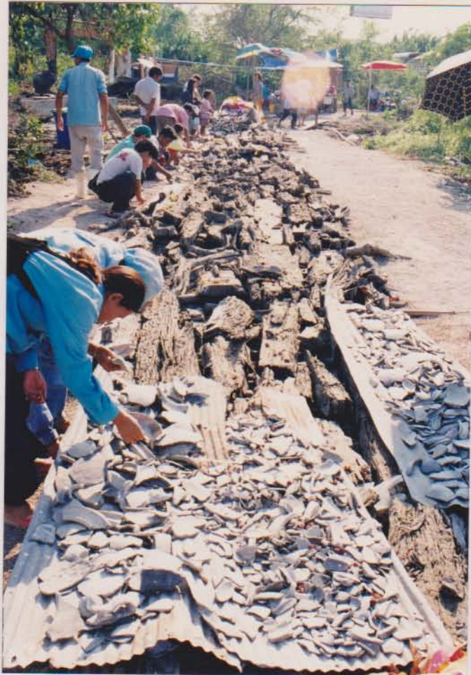
เรือบ้านขอม