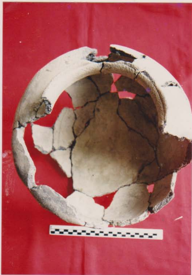
หม้อก้นกลมมีเชิงเตี้ยผิวมีลายขูดขีด พบจากเรือบ้านหอม