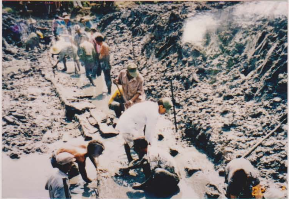
ชาวบ้านกำลังขุดเรือบ้านหอม