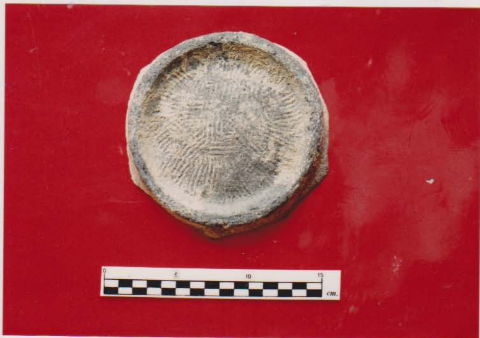
ฐานหม้อมีเชิงเตี้ย ตกแต่งด้วยลายขูดขีด