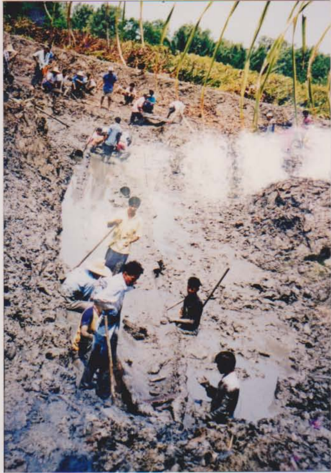
ชาวบ้านกำลังช่วยกันขุดเรือบ้านหอม