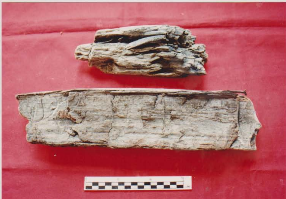
เศษไม้ส่วนประกอบของเรือบ้านขอม