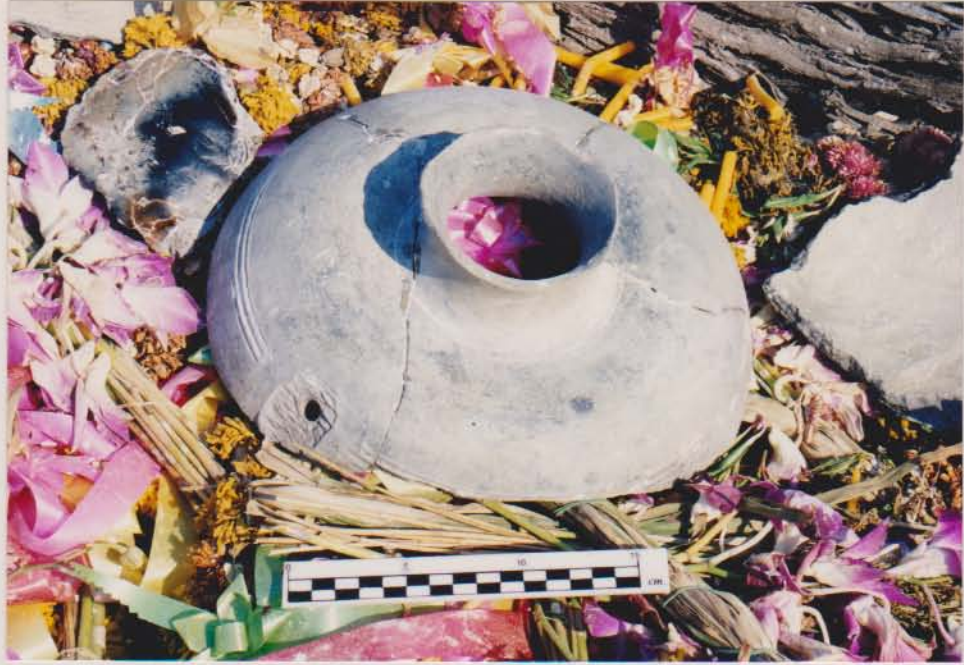
กุ่มที่ดินเผา พบจากเรือบ้านขอม อ.เมือง จ.สมุทรสาคร