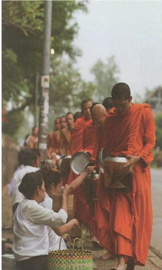
▲ การตักบาตรข้าวเหนียวยามเช้า