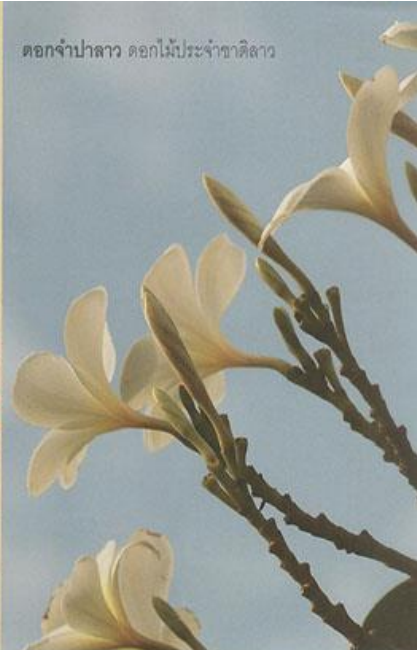
ดอกจำปาลาว ดอกไม้ประจำชาติลาว