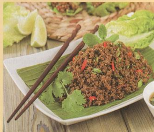
ฉบับพิเศษ ประชาคมอาเซียน ๕๑

ชาติพันธุ์ โดยผ้าทอมือมีบทบาทสำคัญในชีวิตครอบครัวของ ชาวลาวจนถึงทุกวันนี้ จะเห็นว่าประชาชนลาวปัจจุบันยังคง แต่งกายนุ่งผ้าซิ่นแบบดั้งเดิม