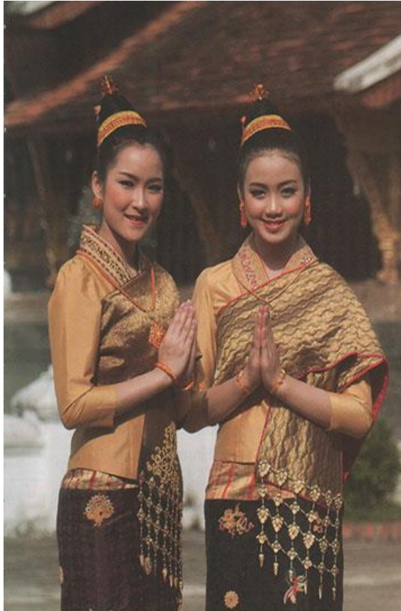
◀ มงหญิงลาวในชุดเครื่องแต่งกายประจำชาติ

ทุกวันนี้ เช่น วัฒนธรรมการรับประทานอาหาร “ข้าวจีบ่าแกต” หรือ “ขนมปังบาแกต” ไล่ต่าง ๆ กับกาแฟในตอนเช้า