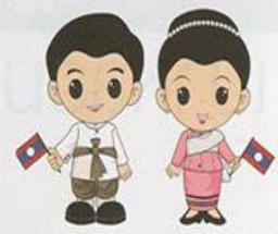
ฉบับพิเศษ ประชาคมอาเซียน ๕๕