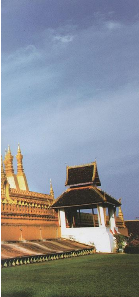
พระธาตุหลวง ศูนย์รวมใจชาวเวียงจันทน์

ธัญญากร ชาลี. “สาธารณรัฐประชาธิปไตยประชาชนลาว สันติสุขใต้ร่มธงดวงเดือน” วัฒนธรรม. 52(พิเศษ) : หน้า 46 - 55.