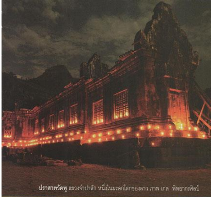
ปราสาทวัดพู แขวงจำปาสัก หนึ่งในมรดกโลกของลาว

ัญญากร ชาลี. “สาธารณรัฐประชาธิปไตยประชาชนลาว สันติสุขใต้ร่มดวงเดือน” วัฒนธรรม. 52(พิเศษ) : หน้า 46 - 55.