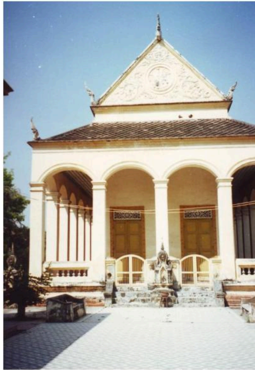
อุโบสถเป็นแบบ ศิลปะผสมไทยกับตะวันตก