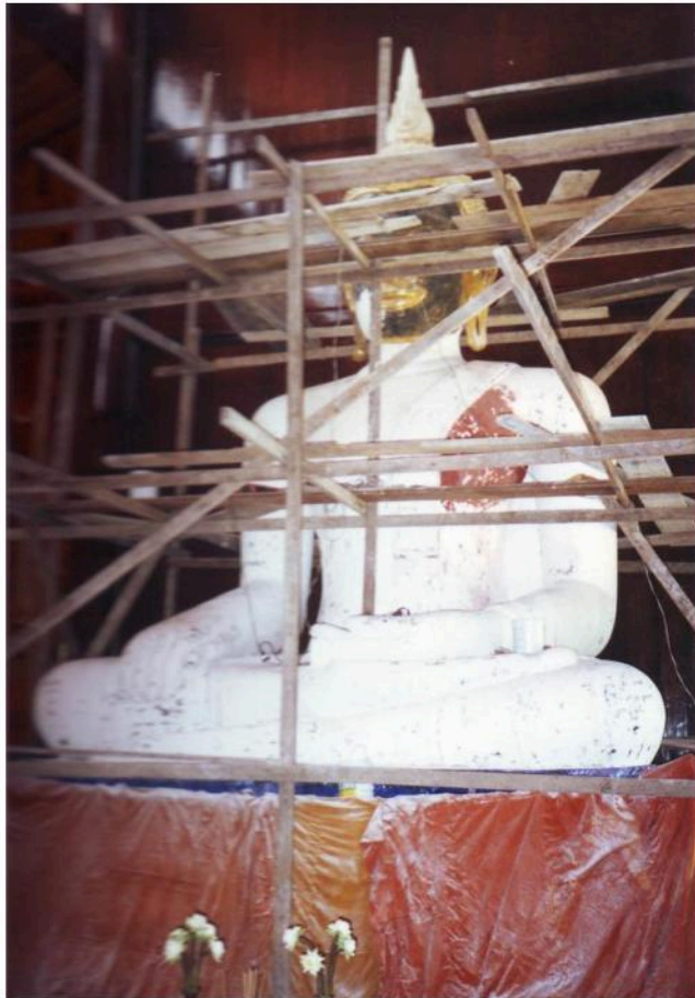
พระพุทธรูปขนาดใหญ่ สันนิษฐานว่าเป็นพระ ประธานอุโบสถวัดร้างที่เรียกว่าวัดใหม่ที่อยู่ทางทิศ ตะวันออกของวัดสนามพราหมณ์