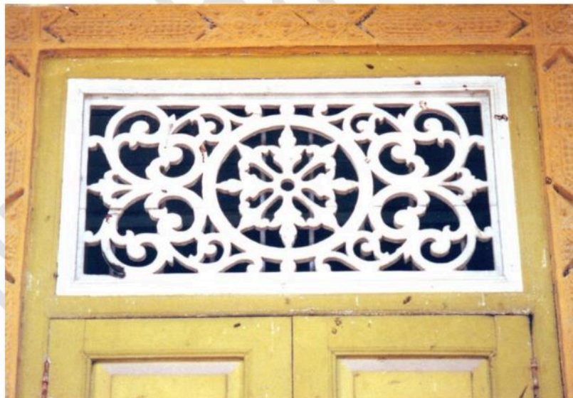
ไม้ฉลุตกแต่งเหนือบานประตูหน้าต่างอุโบสถวัดสนามพราหมณ์