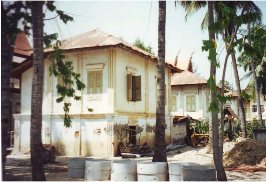
กุฏิสงฆ์ ทรงตึกฝรั่งในวัดสนามพราหมณ์