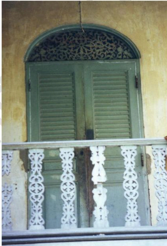
บานประตูกุฏิสงฆ์วัดสนามพราหมณ์