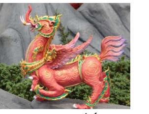
สกุณคชสีห์ หัวเป็นคชสีห์ มีปีกและหางเป็นนก