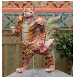
เสือปีก ตัวเป็นเสือ มีปีกแบบนก พื้นสีเหลือง