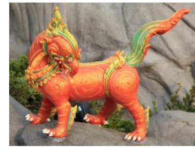
สกุณไกรสร ตัวเป็นสิงห์ หัวเป็นนก ไม่มีปีก พื้นสีหงดิน