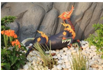
เหมราอัสตร ตัวเป็นม้า หัวเหม หางสีขาว พื้นสีดำ