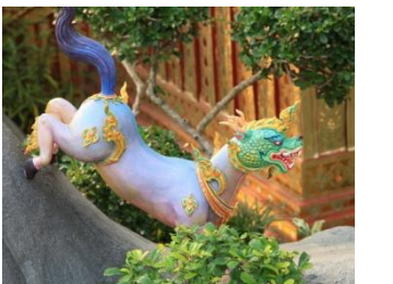
อัสตรเหรา ตัวเป็นม้า หัวเป็นแบบ มังกร มีเขาและเขรา พื้นสีม่วงอ่อน