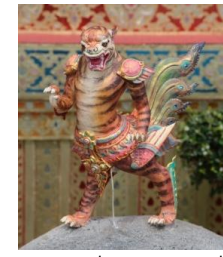
เสือปีก ตัวเป็นนก หัวเป็นเสือ พื้นสีเหลือง