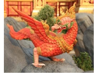
สัมพาที พญานกในเรื่อง รามเกียรติ์ กายเป็นสีแดงชาด