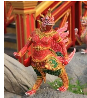
สุบรรณเหรา ตัวเป็นครุฑ หัวคล้ายพญานาค มีเขา