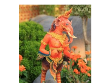
คชปีกขลิษฐ์ หัวเป็นช้าง มีปีกแบบนก มีหางเป็นปลา