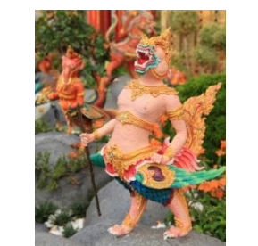
นรปีกขาไกรสร หัวเป็นสิงห์ ตัวเป็นนก