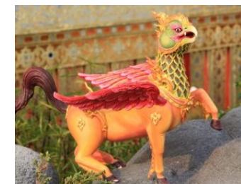
อัสตรวิหค ตัวเป็นม้า หัวและคอ เป็นนก ตัวสีเหลือง สร้อยคอและ ปีกสีหงชาด หางและกีบเท้าสีดำ