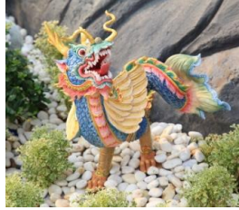
มัจฉามังกร หัวและตัวเป็นมังกร หางเป็นปลา