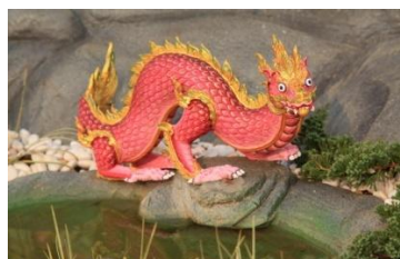
เหรา ลักษณะเหมือนนาค มีสีขาแบบมังกร