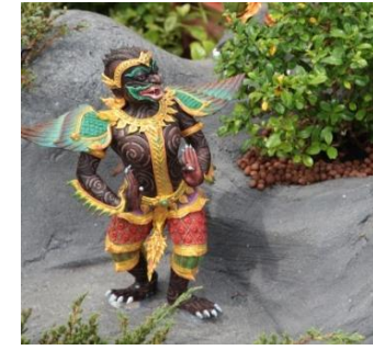
กบิลปีกขา ตัวและหัวเป็นลิง พื้นดำ มีหางนก และปีกที่ไหล่