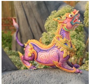
ไกรสรจำแลง ลักษณะคล้ายมังกร ตัวและเท้าคล้ายสิงห์ พื้นสีม่วงอ่อน