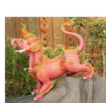
คชสีห์ ตัวเป็นสิงห์ สีม่วงอ่อน หัวมีวงและงาแบบช้าง