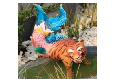
พยัคฆนที ตัวเป็นเสือ หางเป็นปลา