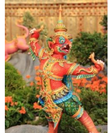
ครุฑ ลักษณะเป็นนกอินทรี แปลงเป็นรูปครุฑจักษ์นาค สีหงเสน สวมมงกุฎยอด