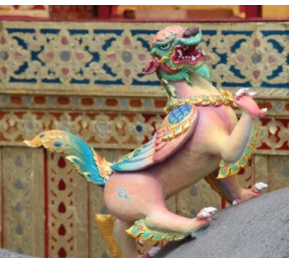
ทิชากรจัตุบถ สัตว์สี่เท้า แบบสิงโต มีปีกและหางเป็นนก