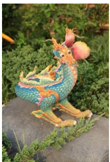
เหมวาริ หัวเป็นเหมมราช ลำตัว มีครีบและหางเป็นปลา