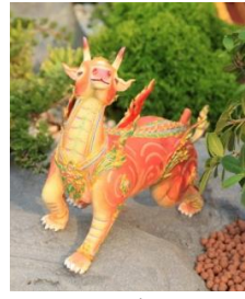
ไกรสรควาฬ ตัวเป็นสิงห์ หัวเป็นวัว มีเขา หางเป็นหางม้า