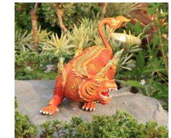
พยัคฆไกรสีห์ ตัวเป็นสิงห์ หัวเป็นเสือ