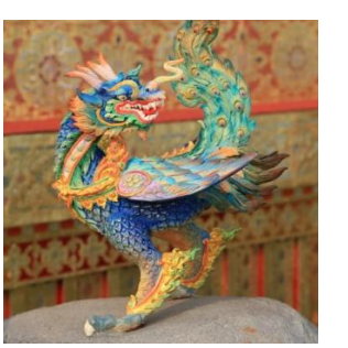
มังกรสกุณี หัวเป็นมังกร ตัวเป็นนก