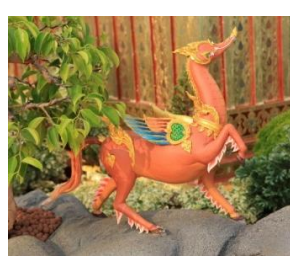
มฤคเหมมราช หัวเป็นเหมม ตัวเป็นกวาง มีปีก