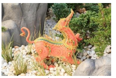
เหมมราช ตัวเป็นสิงห์ หัวเป็นเหมม หางสีขาว