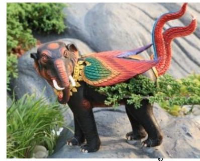
กรินทรปีกขา ตัวเป็นช้าง พื้นสีดำ ปีกหางแบบนกสีแดงชาด