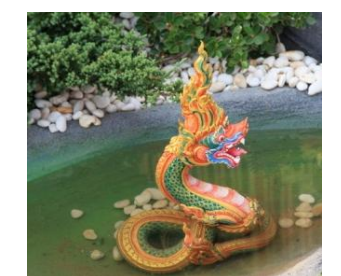
นาค งูใหญ่มีหงอน