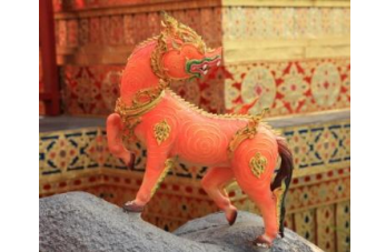
ดุรงค์ไกรสร ตัวเป็นม้า หัวเป็นสิงห์ พื้นสีหงเสน หางแปรง กีบดำ