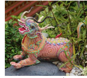
สีหรามังกร ตัวเป็นสิงห์ หัวเป็นมังกร พื้นสีหงดิน