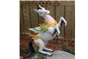
ดุรงค์ปีกขนิษฐ์ ตัวเป็นม้า พื้นสีขาว มีปีกและหางเป็นนก สีเขียว ผมแปรง กีบสีดำ