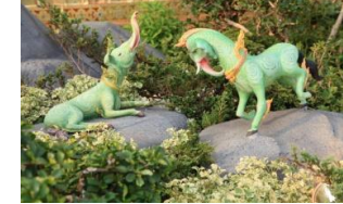
สินธพกุญชร ตัวเป็นม้า หัวเป็น ช้าง มีหงอน พื้นสีเขียวอ่อน หลังและกีบสีดำ