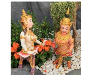
กุมภินิมิต ท่อนบนเป็นเทพ ท่อนล่างและหางเป็นจระเข้