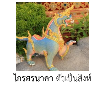
ไกรสรนาคา ตัวเป็นสิงห์ หัวและหางเป็นนาค มีเกล็ดทั้งตัว พื้นสีน้ำเงินอ่อน