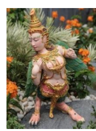
มยุระคนธรรพ์ ศีรษะและลำตัว เป็นคนธรรพ์ ท่อนขาและหาง เป็นนกยูง มีปีกที่ใหญ่