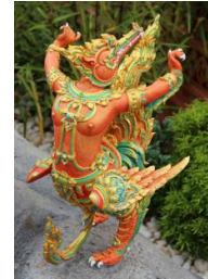
สุบรรณเหมมราช หัวเป็นเหมมราช ตัวและหางเป็นครุฑ