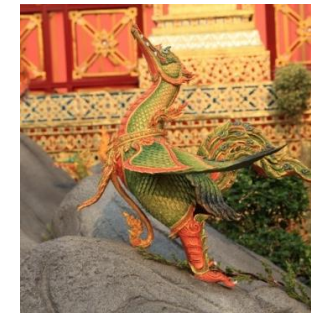
หงส์ เป็นนกในตระกูลสูง เป็นพาหนะของพระพรหม