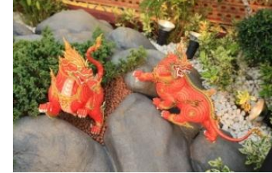
สิงห์ หรือ ราชสีห์ ตัวเป็นสิงห์ เท้าเป็นเล็บ หางเป็นปล้อง