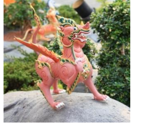
สิงห์ปีก หัวและตัวเป็นสิงห์ มีปีก