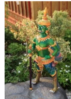
อสุรวายุภักซ์ ตัวเป็นนกอินทรี หน้าเป็นยักษ์