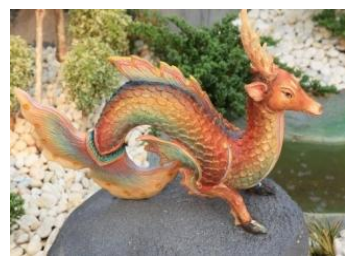
มถุนทิ หัวและตัวเป็นกวาง หางเป็นปลา