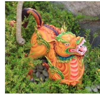
กิมิ รูปร่างคล้ายสุนัข มีเครา และขนคอ หางเป็นพวง