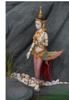
อัสปรปักษิ นางฟ้า มีปีกแบบนก