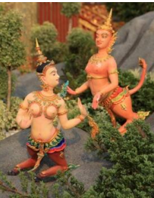
เทพนรสิงห์ ท่อนบนเป็นเทพ ท่อนล่างเป็นสัตว์ มีเท้าเป็นกีบ