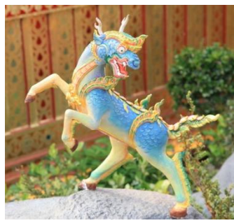
กิเลน ลักษณะคล้ายสิงห์ ตัวเป็นเกล็ด เท้าเป็นกีบคู่ มีเขา

พลอากาศตรีอาวุธ เงินชูกลิ่น และคณะช่างจากสำนักสถาปัตยกรรม กรมศิลปากร ได้ร่วมกันกำหนดรูปแบบการจัดภูมิทัศน์รอบพระเมรุ ให้จำลองป่าหิมพานต์ที่ตั้งอยู่เชิงเขาพระสุเมรุ ประกอบด้วยเขามอต้นไม้ รวมทั้งให้มีเหล่าสัตว์หิมพานต์นานาชนิดอาศัยอยู่ตามที่กล่าวไว้ในตำนาน ในครั้งนี้ กรมศิลปากรได้เชิญกลุ่มช่างปั้นปูนสดจากจังหวัดเพชรบุรี มาออกแบบและปั้นสัตว์หิมพานต์ทั้งหมดกว่า ๘๐ ชนิด จำนวนประมาณ ๑๖๐ ตัว และให้สำนักช่างสิบหมู่ดำเนินการลงสีบนตัวสัตว์หิมพานต์ ทั้งนี้เพื่อเป็นการสื่อความหมายคติความเชื่อเกี่ยวกับจักรวาลไตรภูมิ ให้ปรากฏเป็นรูปธรรมที่ชัดเจนและน่าสนใจมากขึ้น