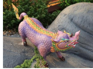
ระมาด สัตว์สี่เท้าคล้ายตัว สมเสร็จ มีวงเล็ก ๆ ตัวเป็นเกล็ด