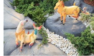
สินธพนัทธิ เป็นตัวม้า หางเป็น ปลา น่าจะหมายถึงม้าน้ำ พื้นสีขาว ครีบหางสีแดงชาด