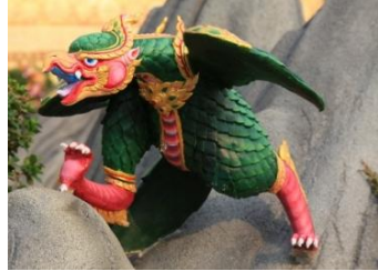
สตาญ พญานกในเรื่อง รามเกียรติ์ กายเป็นสีเขียว