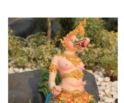
ทนต์ขีมา หัวเป็นนกการเวก ตัวเป็นครุฑ พื้นสีจันอ่อน