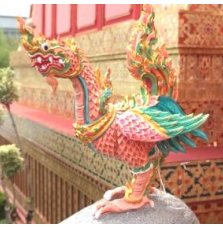
นาคปีกขนิษฐ์ ตัวเป็นนกแบบหงส์ หัวเป็นนาค คล้ายสกุณเหรา พื้นสีหงษา