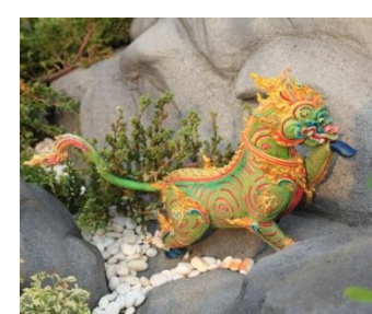
ดิณสีหะ เป็นราชสีห์ พื้นสีเขียวอ่อน เท้าเป็นกีบ