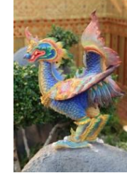
สินธูปักษิ ตัวเป็นนก หางเป็นปลา พื้นสีน้ำเงิน