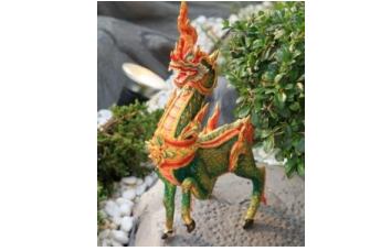
นาคอัสดร ตัวเป็นม้า มีหัวและเกล็ดแบบนาค