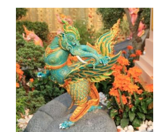
คชปีกขา ลำตัวท่อนอกและแขนคล้ายครุฑสีขาว หัวมีวงและงา ขนและหางคล้ายหงส์