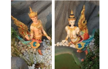
เทพกนิษฐ เทพกนิฐี ลำตัวและหน้าเป็นเทพ ท่อนล่าง ขา และหางเป็นแบบนก