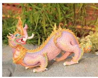
มกรคชสีห์ หัวเป็นคชสีห์ ลำตัวและหาง เป็นมังกร