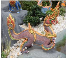
สกุณมังกร หัวเป็นนก ลำตัวและ หางเป็นมังกร