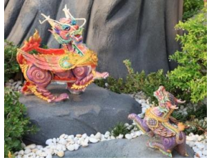
มังกรวิหค หัวเป็นมังกรตัวเป็น สัตว์สี่เท้า พื้นสีม่วงแก่ ปีกและ หางเป็นนก