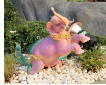
วารีกุญชร ตัวเป็นช้าง หูและ หางเป็นครีบและหางปลา พื้นสีม่วง ครีบและหางสีเขียว