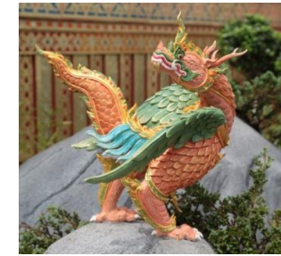
สกุณเหรา หัวและหางเป็นเหรา หรือนาค ตัวเป็นนก