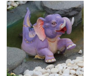
กฤษณวาริ หัวและตัวท่อนบนเป็นช้าง หางเป็นปลา