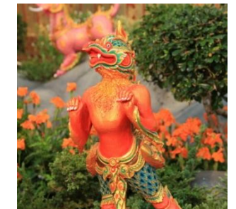
นกการเวก รูปร่างเป็นนก พื้นสีหงเสนอ่อน