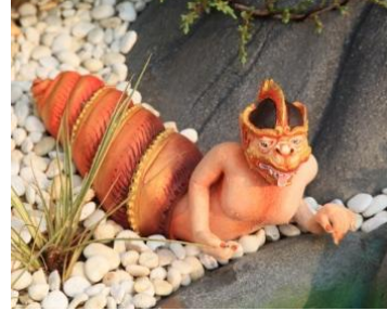
วเนก้าพู หัวและตัวท่อนบน เป็นลิง ท่อนล่างเป็นทอยสังข์