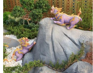
สีหคคคา หัวเป็นสิงห์ ลำตัวเป็น เกล็ด เท้ามีเล็บแบบช้าง พื้นสีม่วงแก่