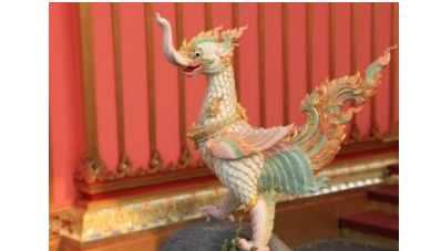
นกหัสติลิงค์ ตัวเป็นนก หัวคล้ายสิงห์ มีวงและงาคลายช้าง