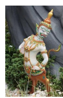
มารีศ ท่อนบนเป็นยักษ์ ท่อนล่างเป็นกวาง