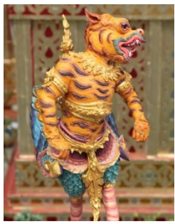
พยัคฆเวณไตย หัวเป็นเสือ ตัวเป็นครุฑ หางแบบหงส์