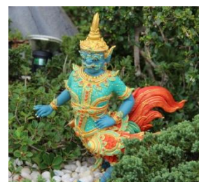
อสุรปักษา ตัวเป็นไก่ที่ขามีเดียว ท่อนอก มือ และหัวเป็นอสุร พื้นสีเขียว ปีก หางสีแดง