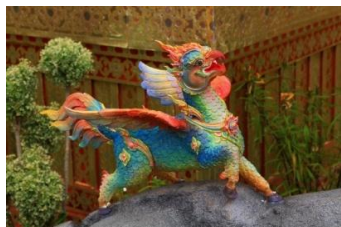
ทิชากรมฤค หัว ปีกและหางเป็นนก ตัวและขาเป็นกวาง