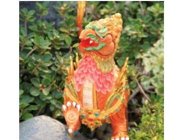
ปีกขนิษฐ์ หัวเป็นนก ตัวเป็นสิงห์