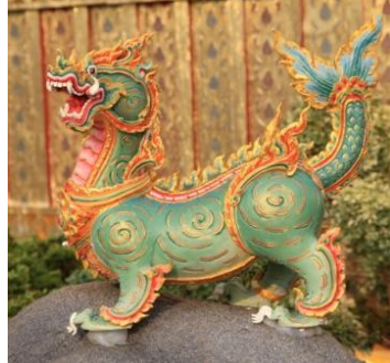
ไกรสรวาริน หัวและตัวเป็นสิงห์ หางเป็นปลา