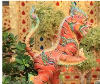
บัณฑุราชสีห์ เป็นราชสีห์ กินเนื้อ มีขนสีเหลืองอ่อน