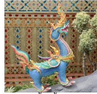
กิเลนปีก พื้นสีน้ำเงิน ไม่มีเขา ไม่มีเครา มีปีก