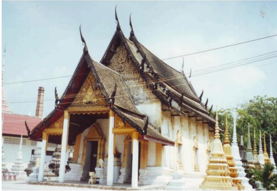
อุโบสถวัดลาดที่น่าจะมีการซ่อมแซมและต่อมุขออกมาภายหลัง