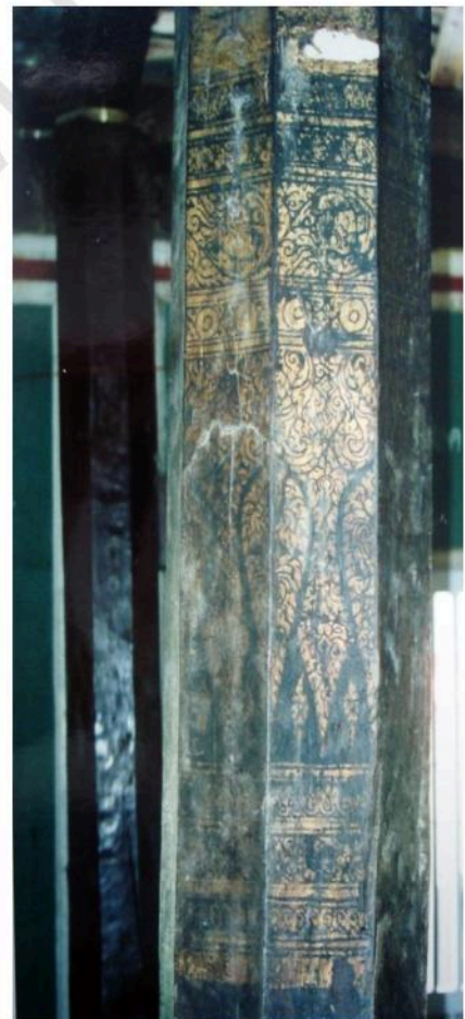
ลายรดน้ำที่เสาของศาลาการเปรียญวัดลาด