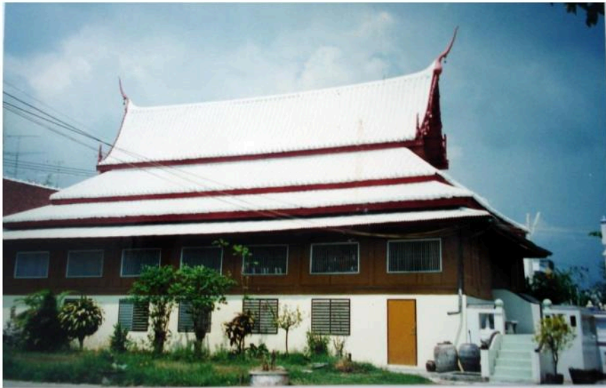
ศาลาการเปรียญวัดลาด ซึ่งย้ายมาจากวัดร้างเชิงเขาวัง