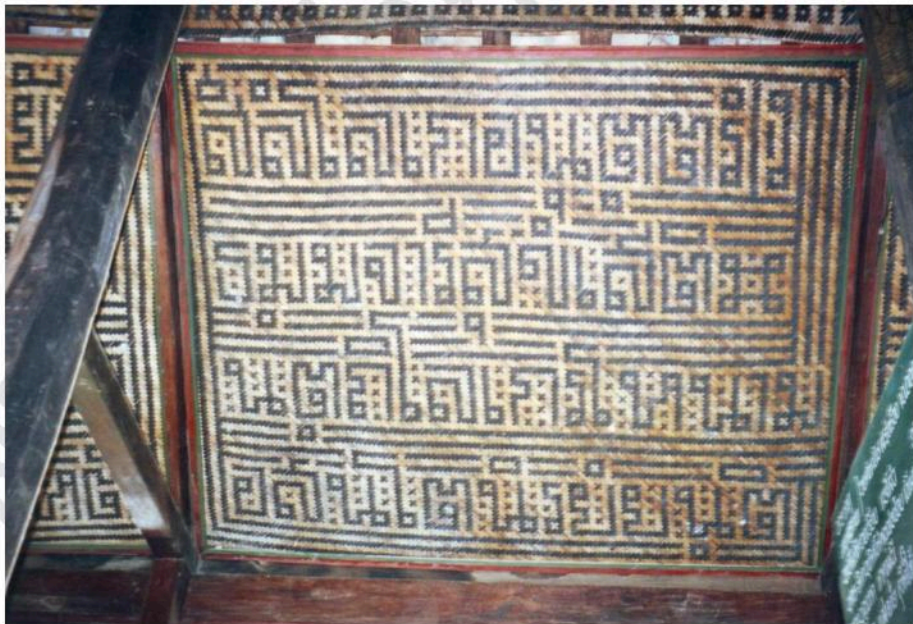
ไม้ไผ่สานเป็นตัวหนังสืออักษรไทยภาษาบาลี เนื้อความเป็นมงคลใช้ตกแต่งผ้าเพดาน ศาลาการเปรียญวัดลาด