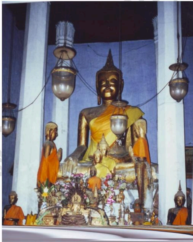
พระประธานในอุโบสถวัดลาด