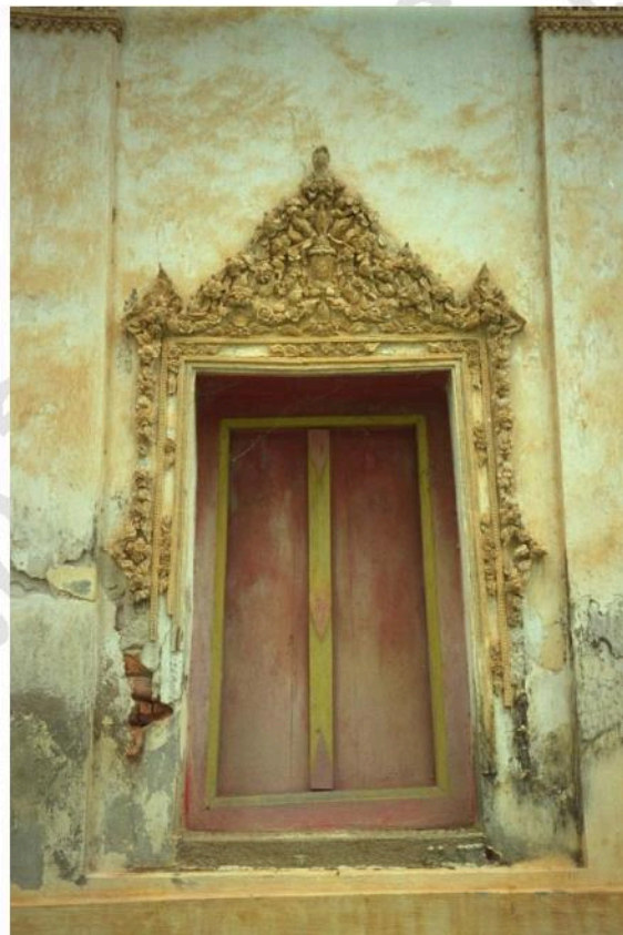
ซุ้มหน้าต่างอุโบสถตกแต่งด้วยลวดลายปูนปั้น ลายเครือเถา