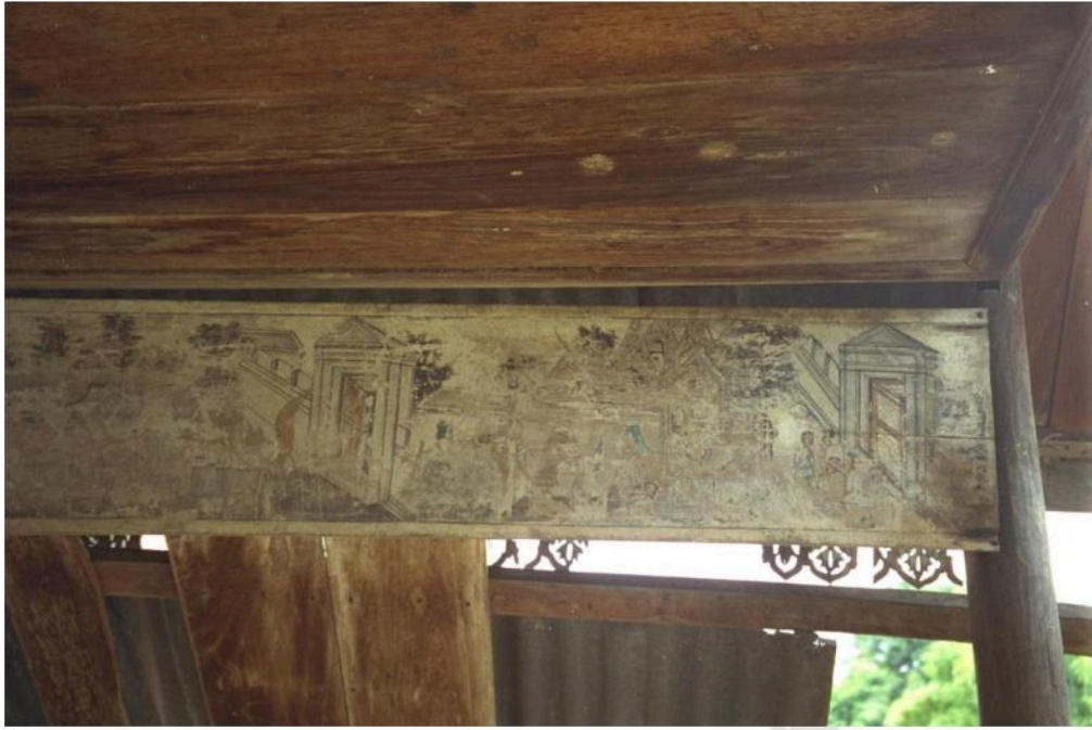
ภาพเขียนแผ่นไม้คอสอง ในศาลาท่าน้ำวัดกุฎี หลังทางทิศเหนือ