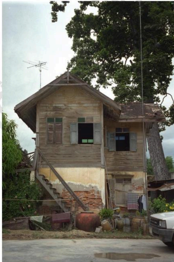
กุฎีสงฆ์ เรือนไทยประยุกต์ครึ่งตึกครึ่งไม้ ตั้งอยู่ริมแม่น้ำเพชรบุรี