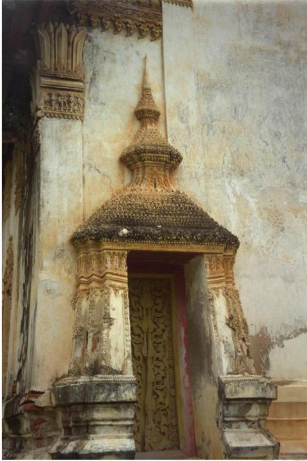
ซุ้มประตูด้านหลัง เป็นซุ้มทรงมณฑป ประดับลวดลายปูนปั้น