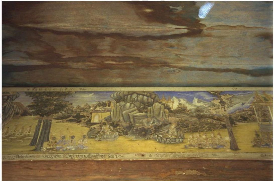
ภาพเขียน บนแผ่นไม้คอสอง ภายในศาลาทำน้ำวัดกุฎี หลังกลาง