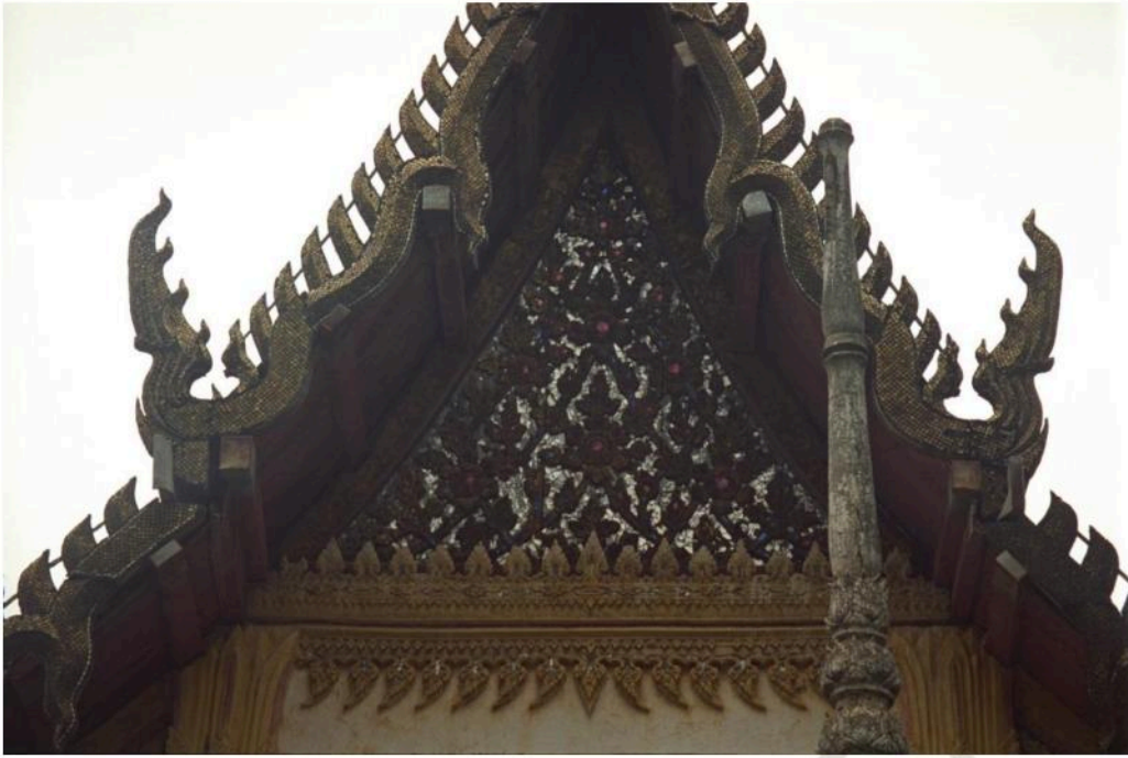
หน้าบ้านอุโบสถวัดกุฎี ด้านทิศตะวันออกเป็นไม้แกะสลักประดับกระจกสี