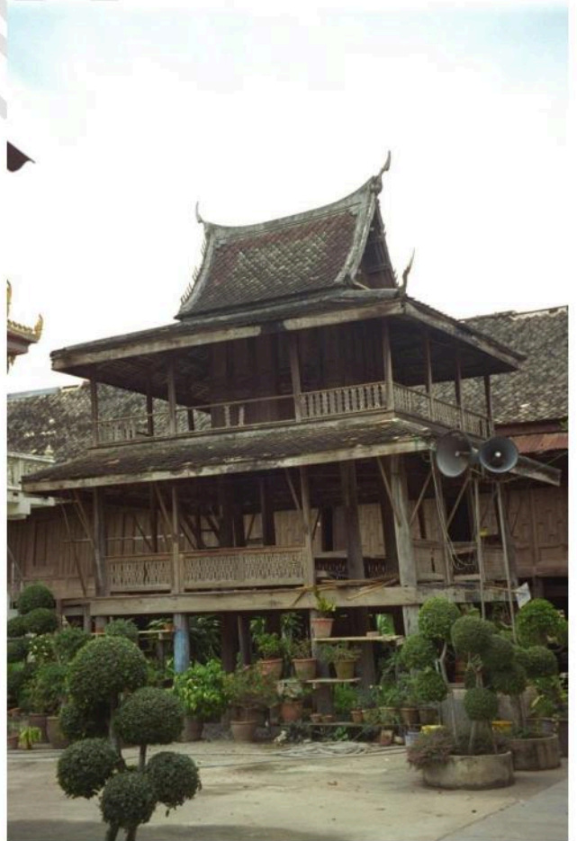
หอไตร 2 ชั้น ระเบียงตกแต่งด้วยไม้

เจดีย์รายด้านหลังอุโบสถ เป็นเจดีย์ย่อมุมไม้สิบสองฐานสิงห์ ตกแต่งด้วยลวดลายปูนปั้นที่ชาสิงห์ ตกแต่งเป็นรูปหน้าสัตว์ต่าง ๆ เช่น สิงห์ หนุม เป็นต้น