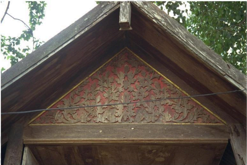
หน้าบันไม้แกะสลัก ของศาลาท่าน้ำวัดกุฎี หลังทางทิศเหนือ