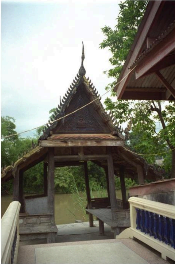
ศาลาทำน้ำ หลังกลาง เป็นเรือนไม้ทรงไทย หน้าบ้านเป็นไม้แกะสลักประดับกระจกสี ภายใน มีภาพจิตรกรรม