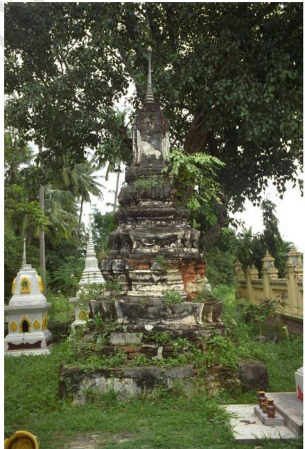
เจดีย์รายด้านหน้าอุโบสถ เป็นเจดีย์ย่อมุมไม้สิบสองฐานสิงห์