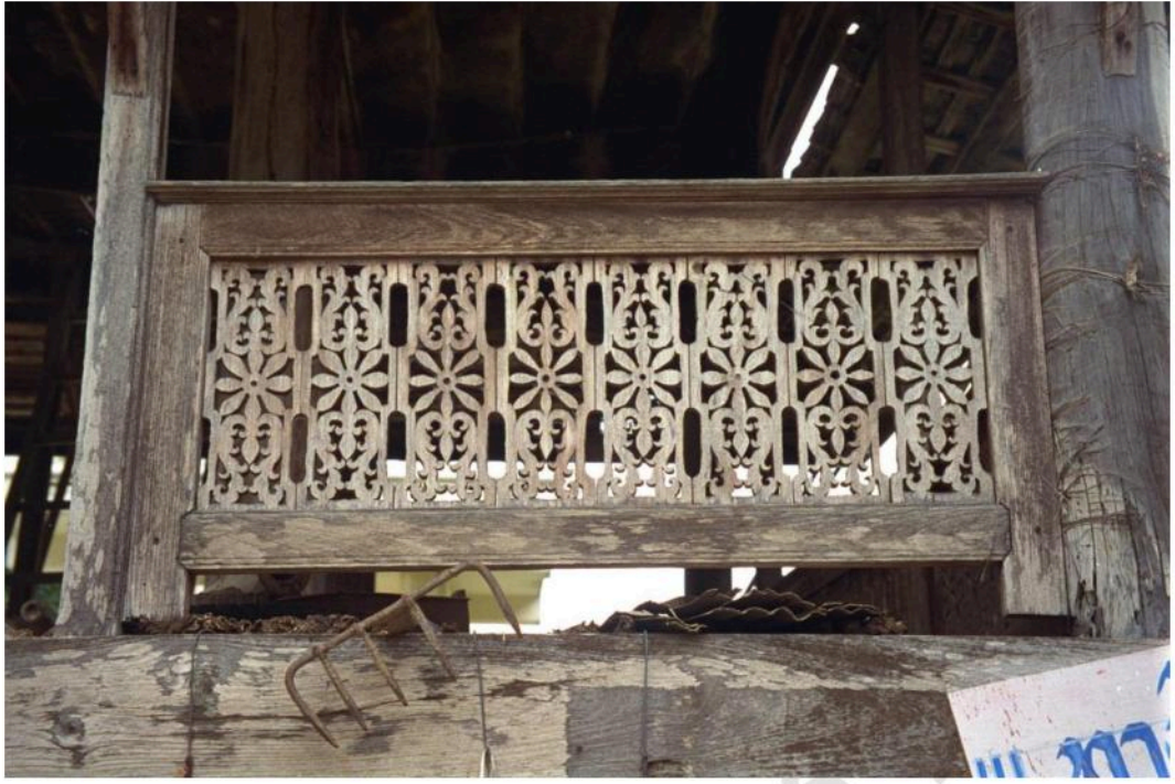
ไม้ฉลุ ตกแต่งหอไตร วัดกุฎี (ท่าแร่)