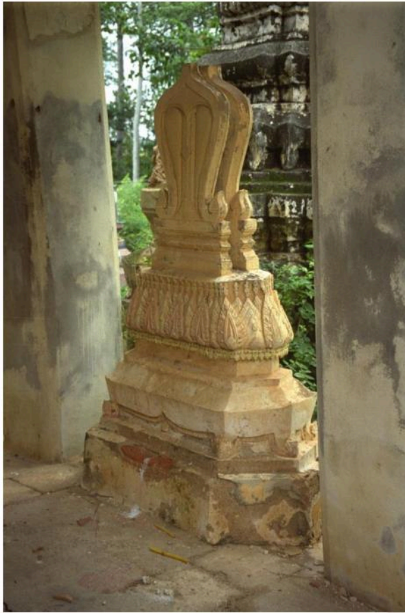
เสมาประธานเป็นเสมาหินทรายแดงแบบนั่งแท่น ตั้งอยู่บนฐานบัวกำเหลี่ยม ขาสិងห์ มีบัวกลุ่มรองรับเสมา