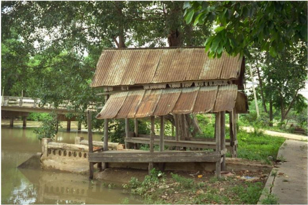
ด้านข้างของศาลาน้ำ หลังทางทิศเหนือ ที่ชายคาตกแต่งด้วยไม้ฉลุ