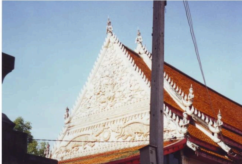
หน้าบ้านด้านหน้า (ทิศตะวันออกอุโบสถ ประดับลวดลายปูนปั้น เป็นภาพจับพระรามกับ ทศกัณฐ์ ถัดลงมาเป็นภาพตัวเหราหันหน้าเข้าหากัน