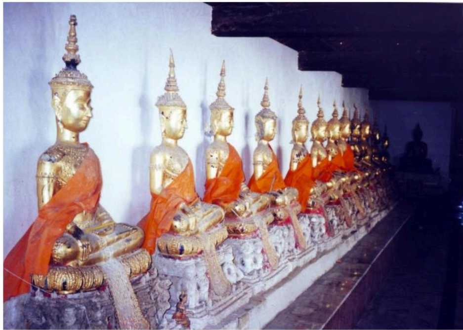
พระพุทธรูปประดิษฐานภายในระเบียงคดรวมทั้งสิ้น 193 องค์ ส่วนใหญ่เป็นพระพุทธรูปสมัยอยุธยาตอนปลาย