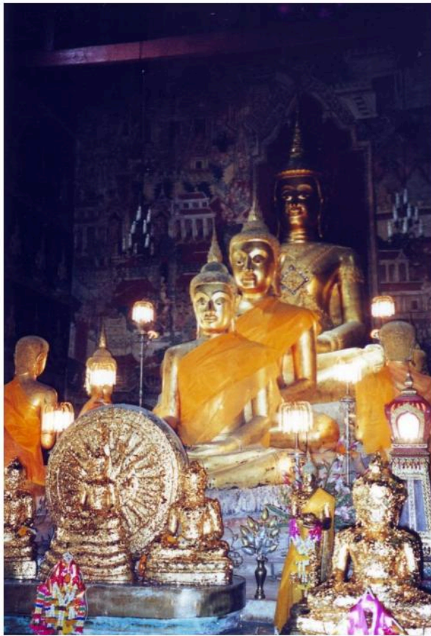
พระประธานและพระพุทธรูปในวิหารหลวงวัดมหาธาตุ พระประธานเป็นพระพุทธรูปทรงเครื่องมหากักรพรรดิ ปางมารวิชัย ศิลปะอยุธยา