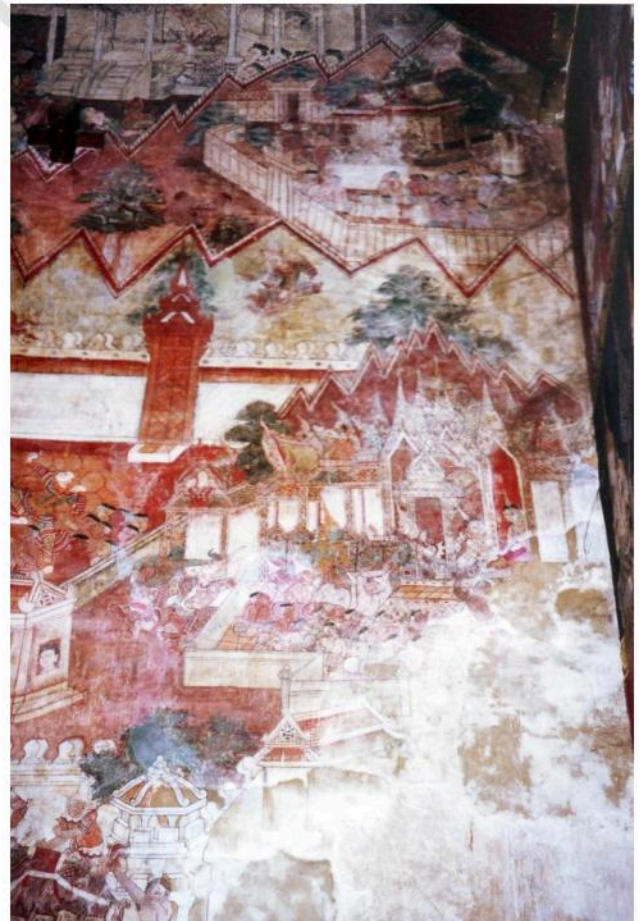
ภาพจิตรกรรมฝาผนังวิหาร ด้านหลังพระประธาน