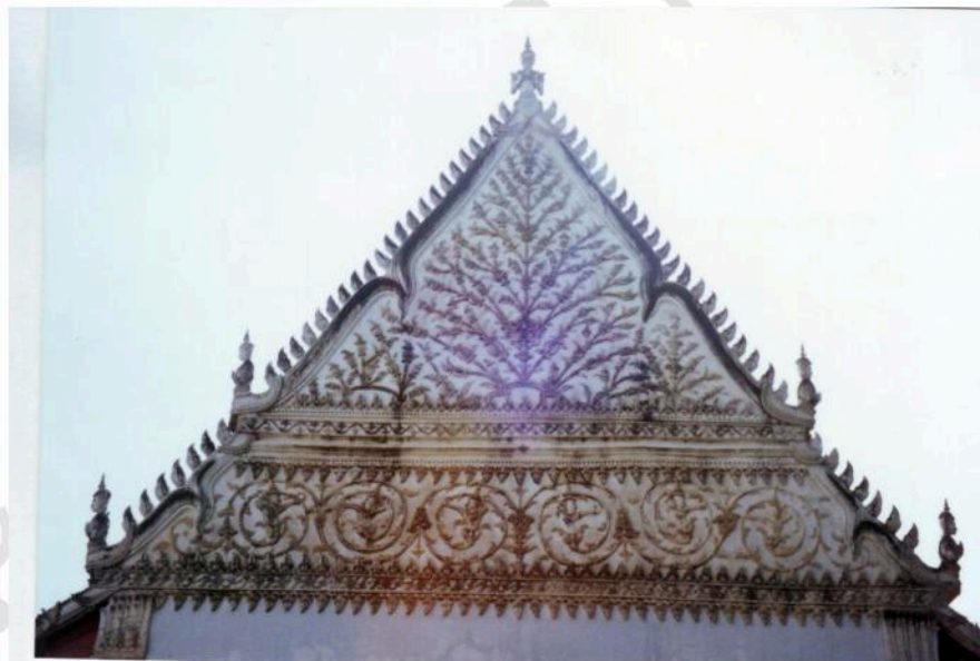
หน้าบ้านด้านทิศตะวันตกอุโบสถ ประดับลายปูนปั้น ลายพรรณพฤกษา ด้านล่างเป็นลายก้านชดออกช่อเป็นเทพพ่อนรำ