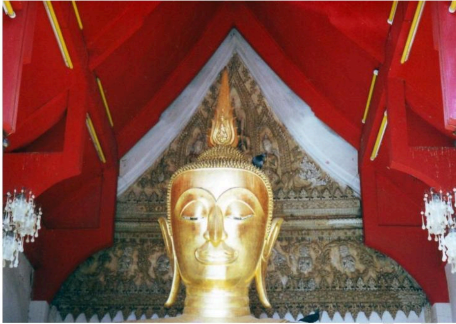
พระประธานประดิษฐานอยู่ภายในมุขที่ต่อยื่นออกมาจากวิหารน้อย