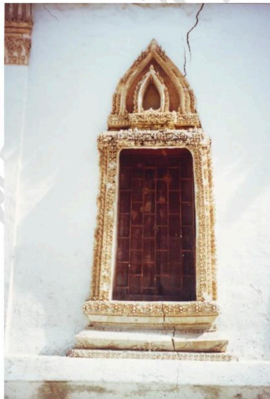
ซุ้มหน้าต่างปูนปั้นวิหารน้อย