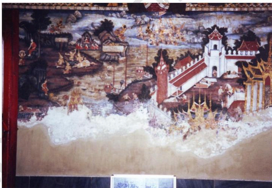
ภาพจิตรกรรมบนผนังด้านข้างเป็นภาพเทพชุมนุม ตอนล่างเป็นภาพทศชาดก ฝีมือช่างเมืองเพชรบุรี เขียนขึ้นระหว่าง พ.ศ. 2465 - 2466