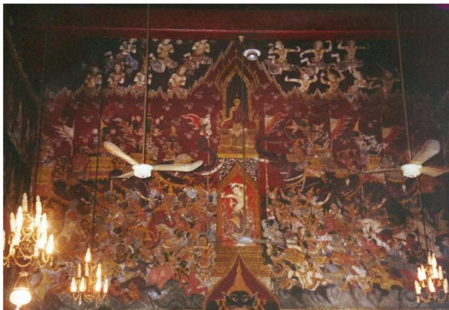
ภาพพุทธประวัติบนผนังด้านหน้าพระประธาน