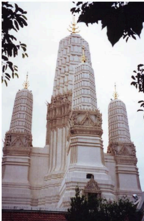
พระปรางค์ วัดมหาธาตุ ได้รับการบูรณะมาโดยตลอด