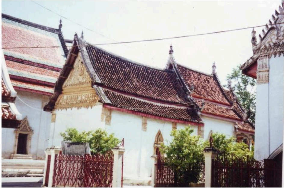
วิหารน้อย ฐานอ่อนโค้งแบบนิยมในสมัยอยุธยาตอนปลาย