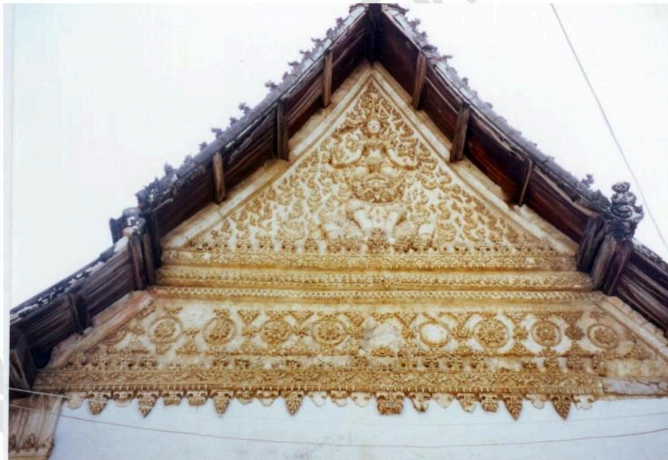
หน้าบ้านด้านหลัง (ทิศตะวันตก) ประดับลวดลายปูนปั้นรูปเทพทรงสิงห์ ลวดลายละเอียดงดงาม