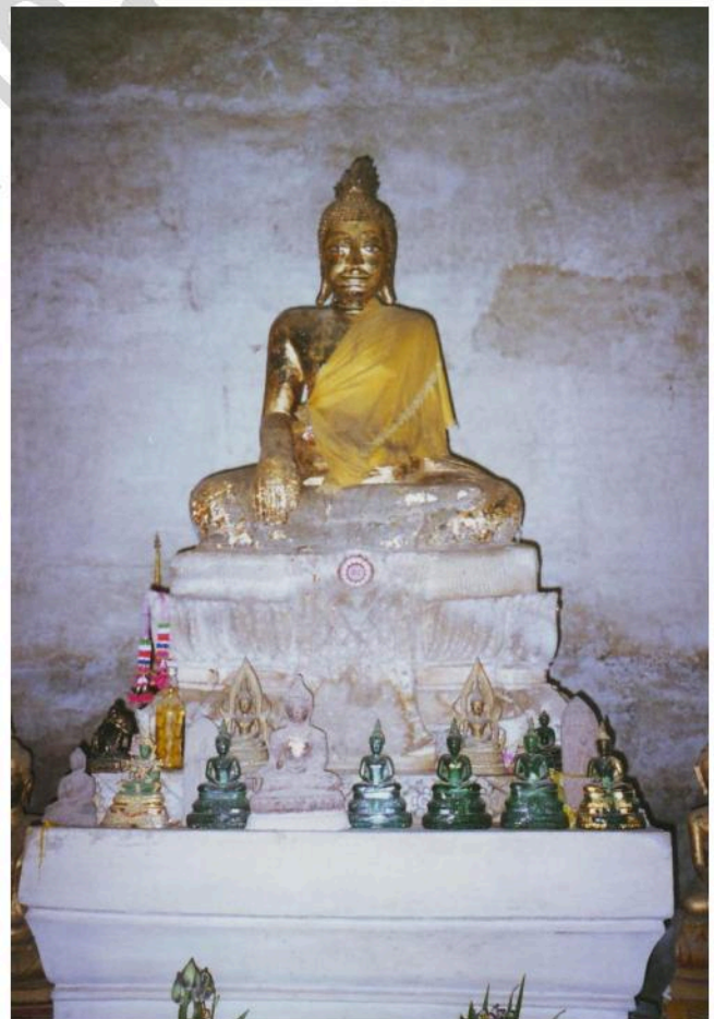
พระประธานในวิหารวัดหนองกาทอง เป็นพระพุทธรูปปูนปั้น ปางมารวิชัย ประดิษฐานอยู่บนฐานชุกชีปูนปั้น