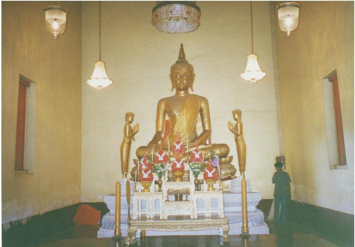
พระประธานในอุโบสถวัดหนองกาทอง เป็นพระพุทธรูปปูนปั้นปางมารวิชัย ขนาดใหญ่