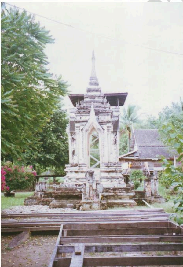
หอรบั้ง วัดหนองกาทอง ทรงจตุรมุข ประดับด้วย ประติมากรรมปูนปั้น และตกแต่งด้วยลวดลายปูนปั้น