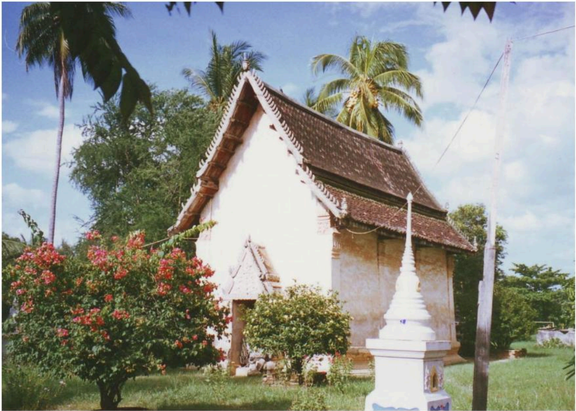
วิหารวัดหนองกาทอง ฐานอ่อนโค้งเล็กน้อย มีประตูทางเข้าออกทั้งด้านหน้าและหลังด้านละ ประตู