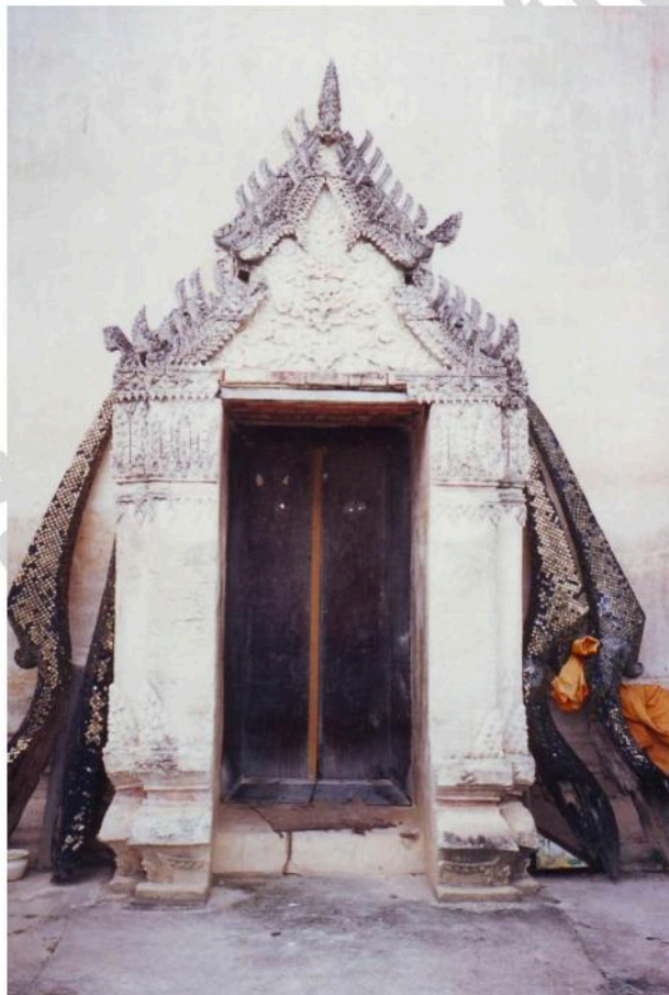
ซุ้มประตู ด้านหน้าวิหาร วัดหนองกาทอง เป็นแบบซุ้มบันแถลง ประดับลวดลายปูนปั้น