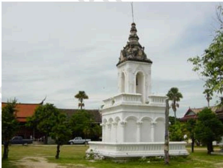
หอรระฆัง วัดใหญ่สุวรรณาราม