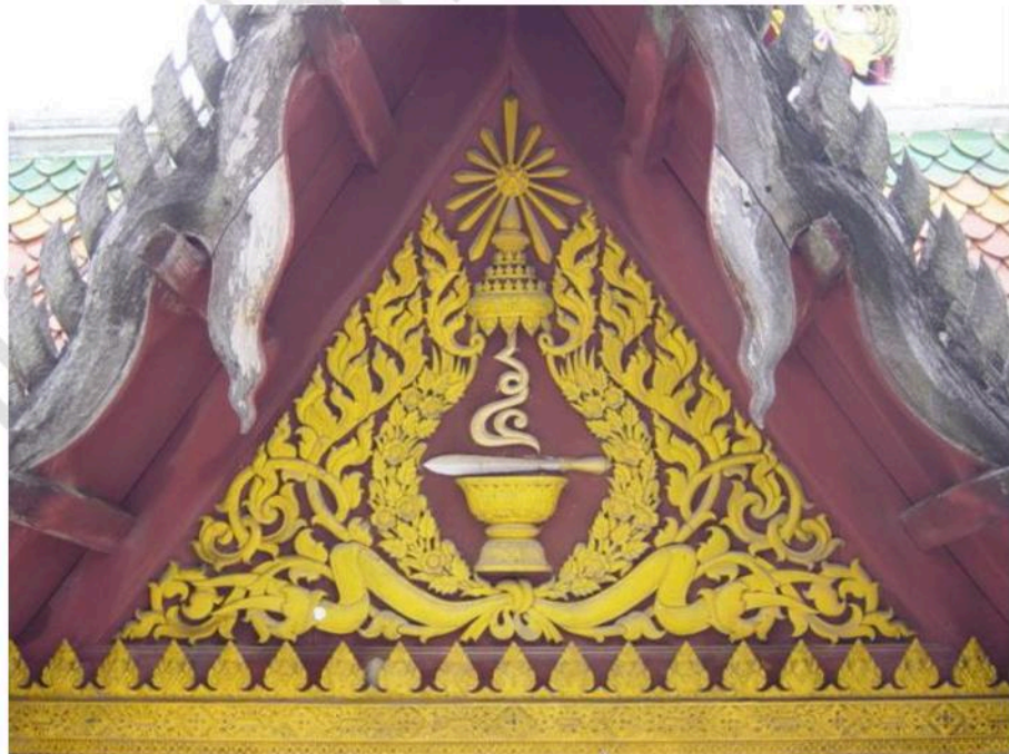
หน้าบันระเบียงคต ล้อมรอบอุโบสถ ประดับปูนปั้นลายเครือเถา มีสัญลักษณ์ เลขห้า อยู่เหนือพระซรีที่วางบนพาน