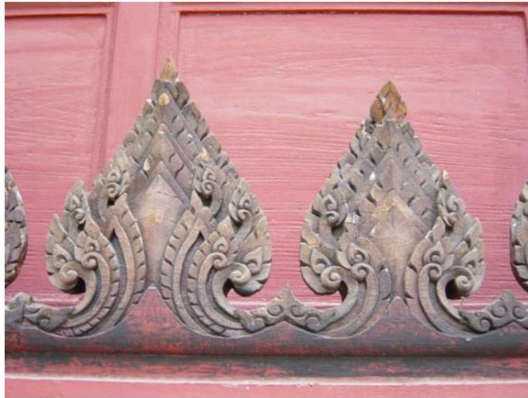
กระจงพริ้ง ศาลาการเปรียญ วัดใหญ่สุวรรณาราม