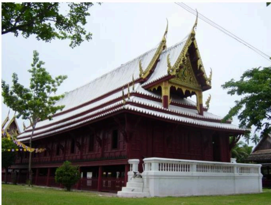
ศาลาการเปรียญ วัดใหญ่สุวรรณาราม เป็นเรือนไม้ทรงไทย ขนาดใหญ่ เดิมฝาदानนอก เขียนลายทอง ด้านในมีภาพเขียน มีภาพจิตรกรรม