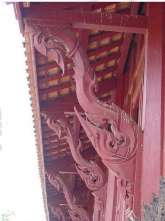
คันทวย รัชชายุคปิณฑก ศาลาการเปรียญ จำหลักจากไม้ ทั้งแผ่น เป็นแบบที่เรียกว่า ทวยหน้าตักแตน