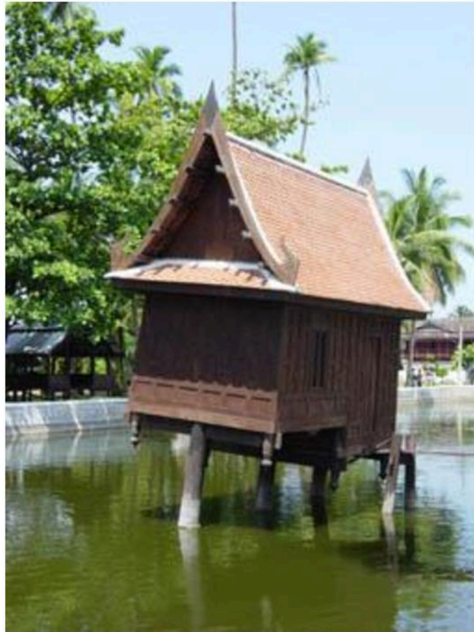
หอไตรกลางน้ำ วัดใหญ่สุวรรณาราม