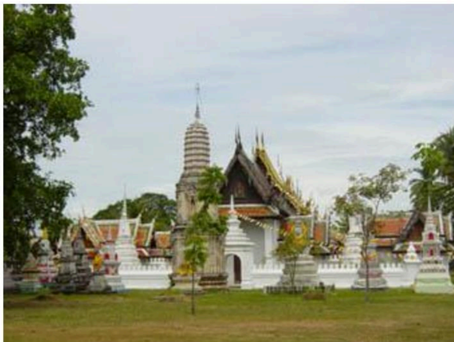
สภาพทั่วไปภายในวัดใหญ่สุวรรณาราม