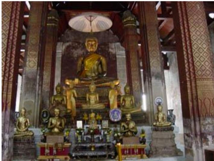
พระประธานภายในพระอุโบสถวัดใหญ่สุวรรณาราม