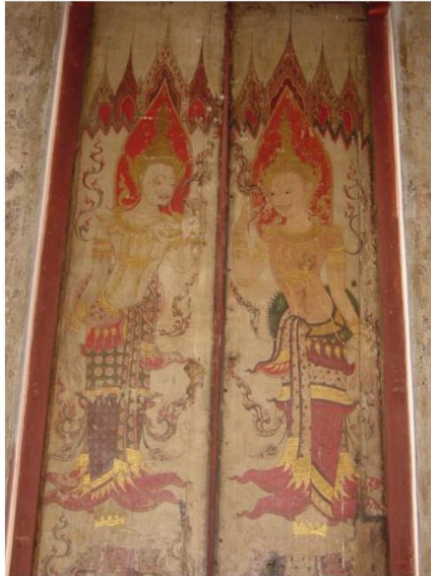
ภาพทวารบาลบนบานประตูพระอุโบสถ