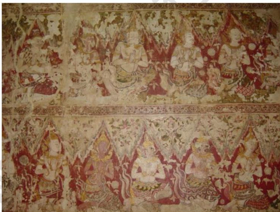
ภาพจิตรกรรมฝาผนังภายในอุโบสถวัดใหญ่สุวรรณาราม เป็นเทพชุมนุม 5 ชั้น