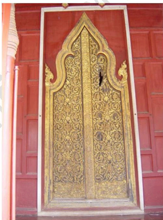
บานประตู บานกลางด้านหน้าศาลาการเปรียญ เป็นไม้แกะสลัก ลายก้านขดหางโต