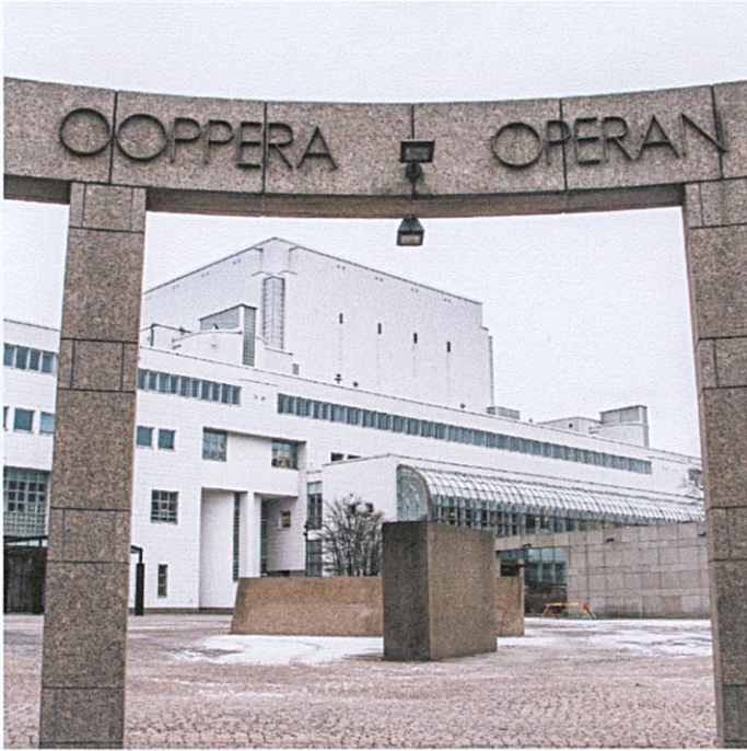
Finnish National Opera and Ballet