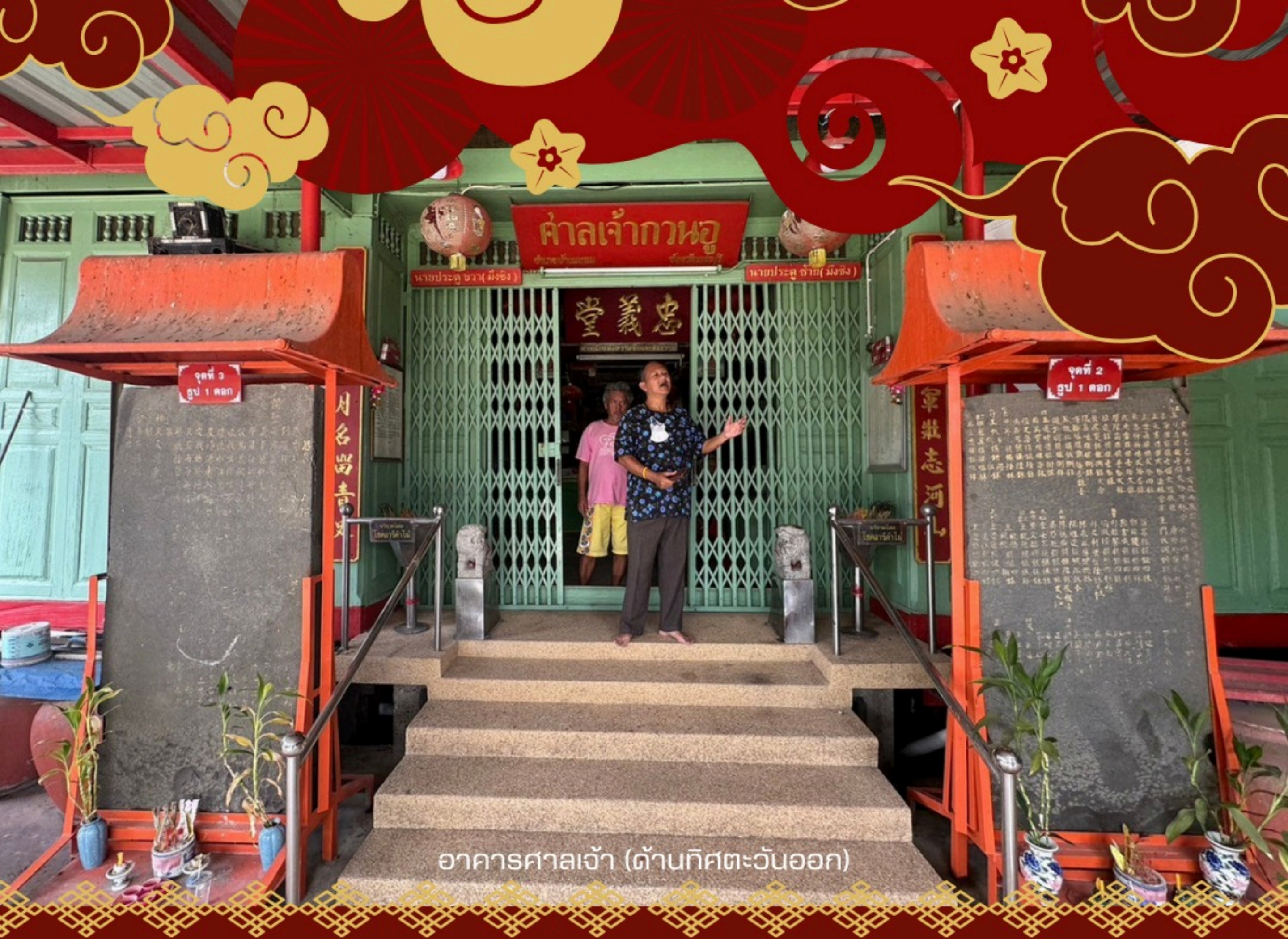
อาคารศาลเจ้า (ด้านทิศตะวันออก)

ศาลเจ้าแห่งนี้มีประวัติความเป็นมาชัดเจน โดยสามารถทราบได้จากจารึกบนแผ่นหินตั้งอยู่บริเวณด้านหน้าประตูทางเข้าศาลเจ้าอยู่จำนวน 2 หลัก มีจารึกอักษรจีนอยู่ ทั้งนี้ศาลเจ้าได้มีการแปลข้อความที่ปรากฏบนแผ่นหินไว้แล้ว โดยได้เผยแพร่ใจความจากจารึกเป็นแผ่นกระดาษบรรจุไว้ในกรอบรูปติดไว้ที่บริเวณผนังข้างประตูทางเข้า