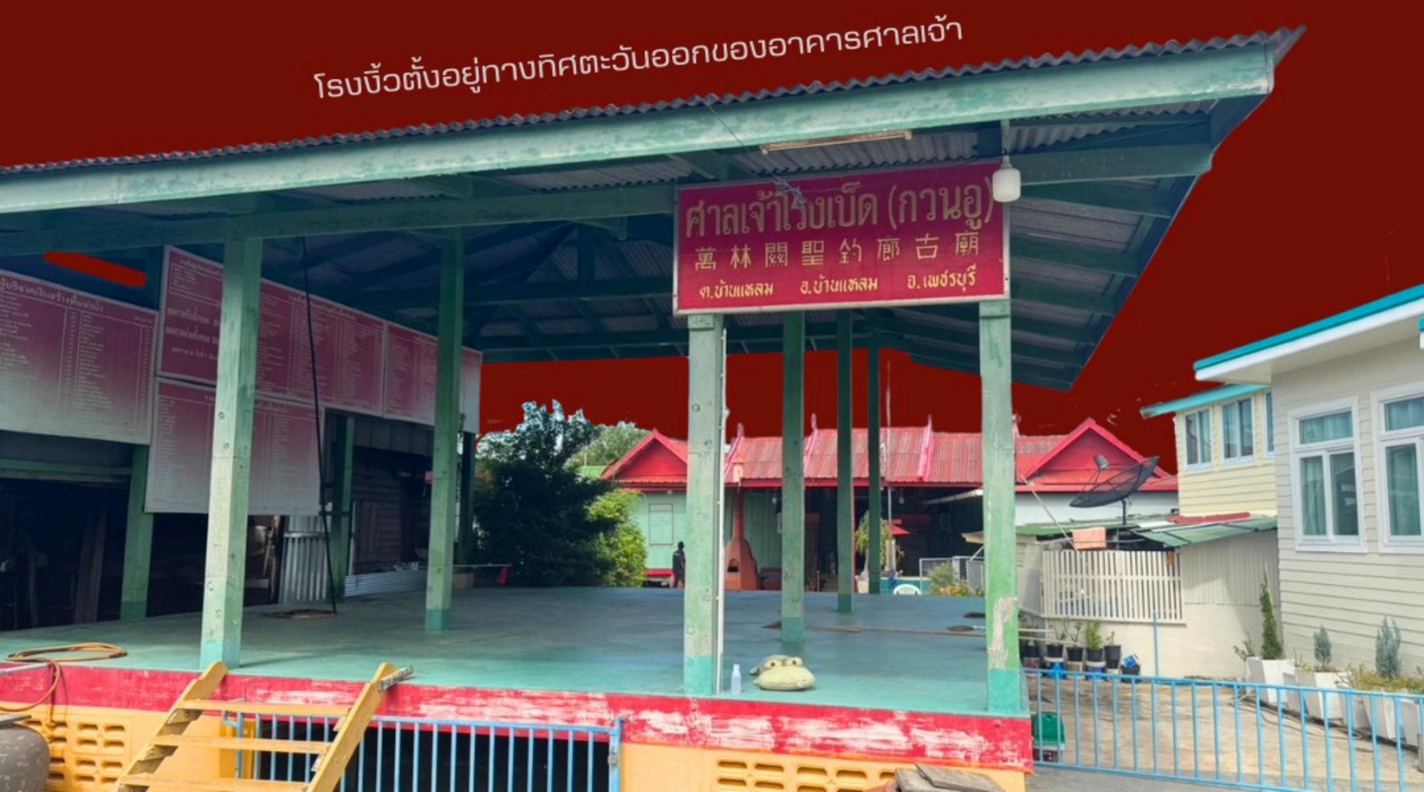
โรงจิวตั้งอยู่ทางทิศตะวันออกของอาคารศาลเจ้า

ต่อมาในปีพ.ศ. 2419 (ปีชวด 1876) ซึ่งตรงกับสมัยรัชกาลที่ 5 โรงจิวอยู่ในสภาพทรุดโทรมอีกครั้ง ชุมชนถึงเรียโรเงินมาซ่อมบำรุง