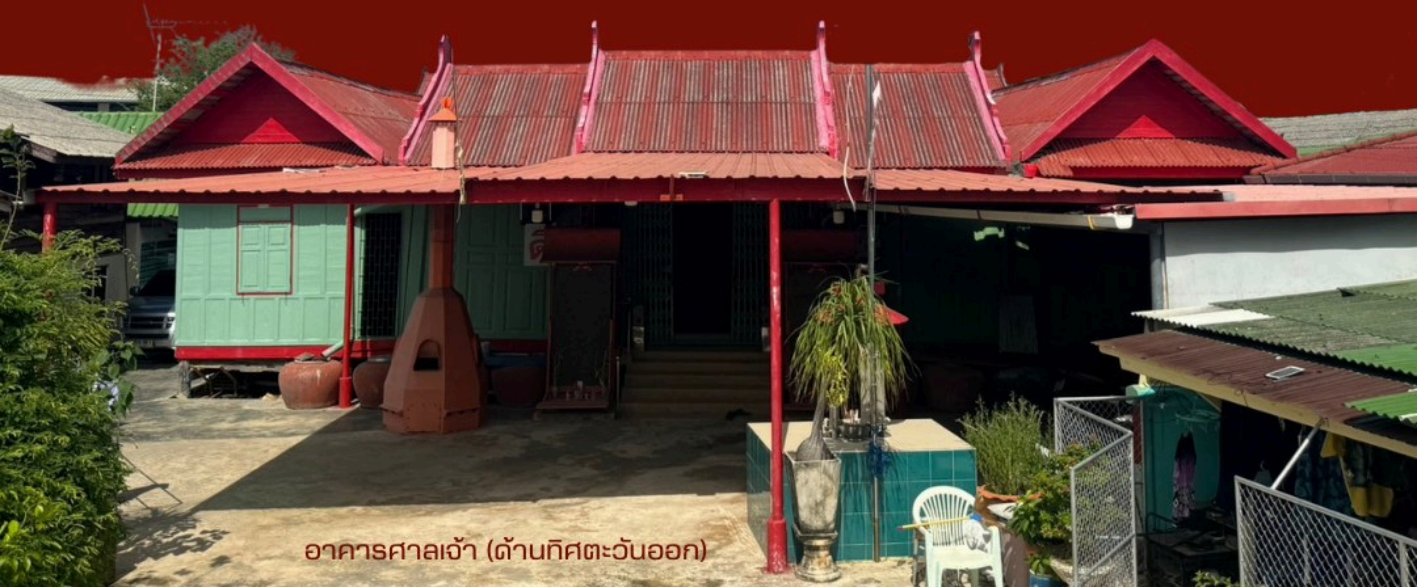
อาคารศาลเจ้า (ด้านทิศตะวันออก)

อาคารศาลเจ้าเป็นศาลาไม้ ยกพื้นสูง แพนผังใช้ด้านยาวของ อาคารเป็นด้านหน้า และด้านกว้างเป็นด้านข้าง อันเป็นลักษณะที่ พบทั่วไปในสถาปัตยกรรมจีน แตกต่างจากสถาปัตยกรรมไทยที่ใช้ ด้านกว้างเป็นด้านหน้าของอาคาร