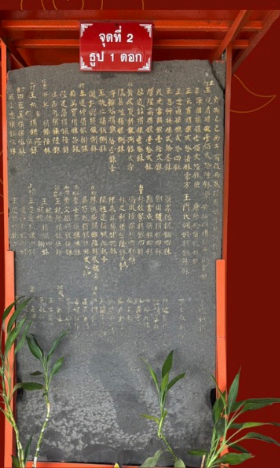
จุดที่ 2 รูป 1 ดอก