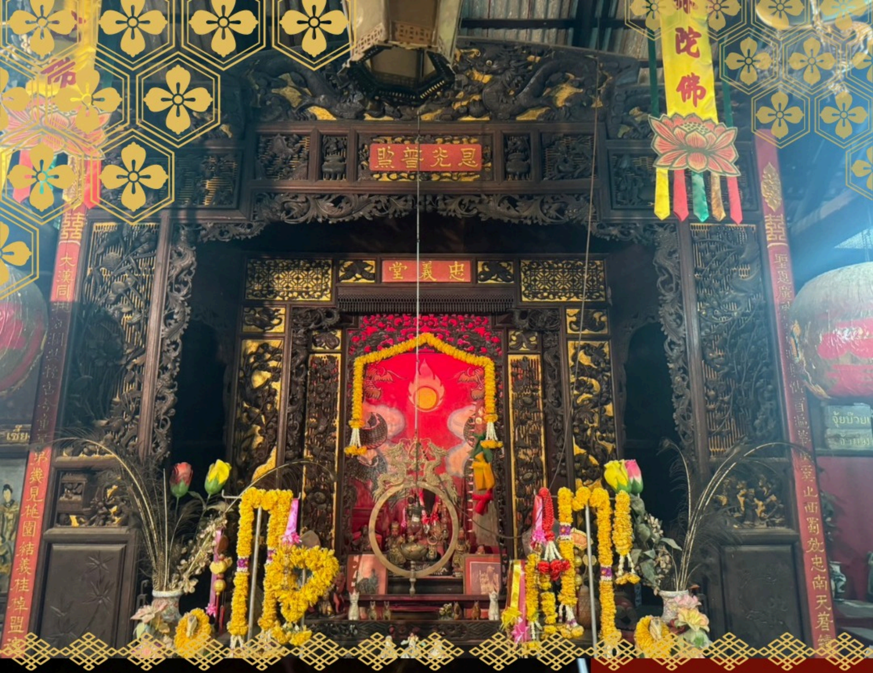
กรอบซุ้มชั้นใน