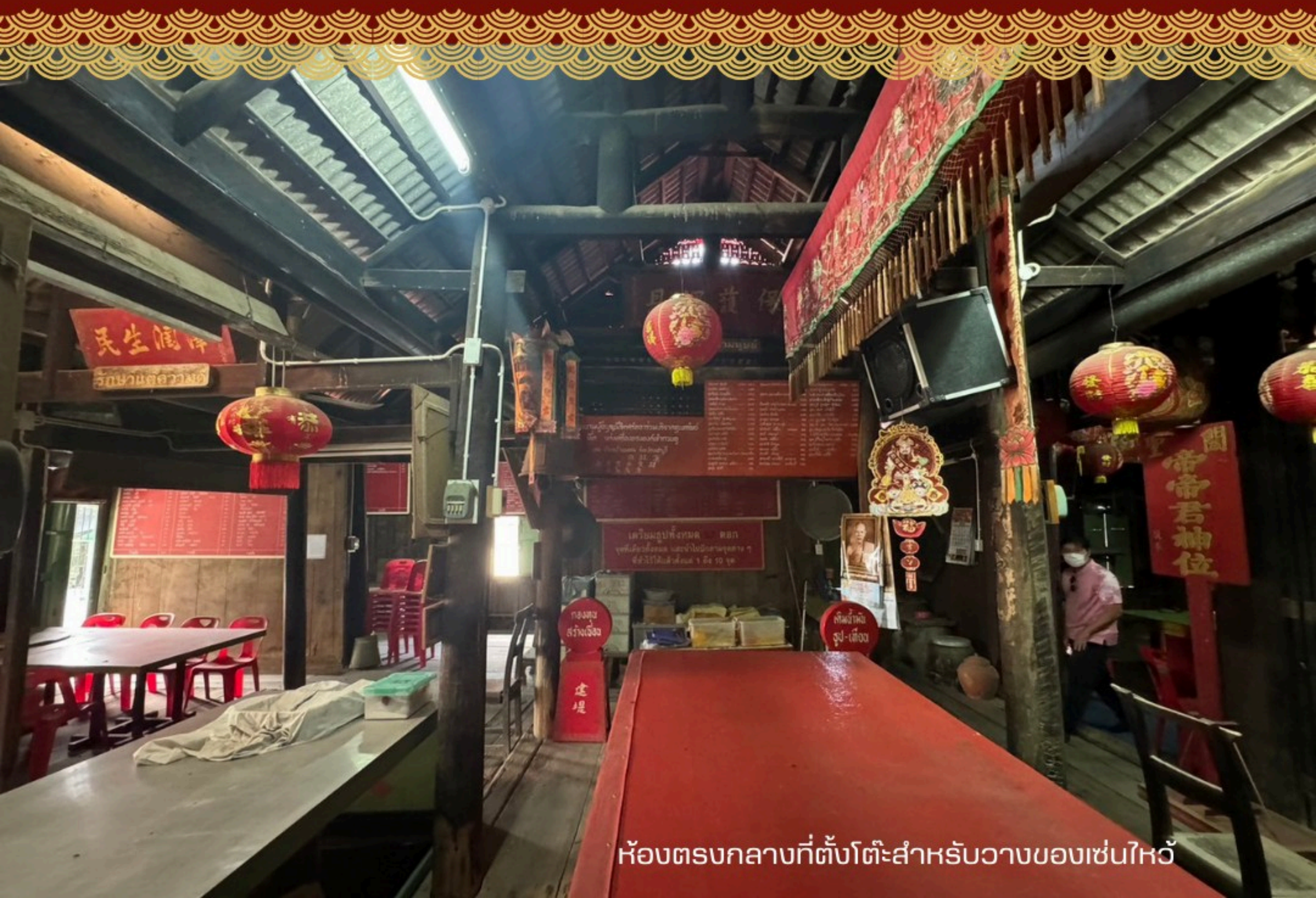
ห้องตรงกลางที่ตั้งโต๊ะสำหรับวางของเซ่นไหว้

อาคารศาลเจ้าหลังนี้ เป็นเรือนไม้ที่มีการทำหลังคาจั่วแบบจีน ประกอบไปด้วย ส่วนอาคารในแกนกลาง (บริเวณห้องด้านในสุดที่ประดิษฐานรูปเคารพเทพเจ้า, บริเวณห้องตรงกลางที่ตั้งโต๊ะสำหรับวางของเซ่นไหว้ และบริเวณด้านหน้าสุดที่เป็นทางเข้า) และมีแนวอาคารขนานข้างอาคารประธาน ซึ่งเป็นส่วนอาคารบริวารปิดล้อมแนวแกนประธาน (ทิศเหนือ-ใต้) โครงสร้างทั้งหมดนี้เชื่อมต่อกันภายในมีการแบ่งพื้นที่ตามแนวเสาและหลังคาจั่วแหลม