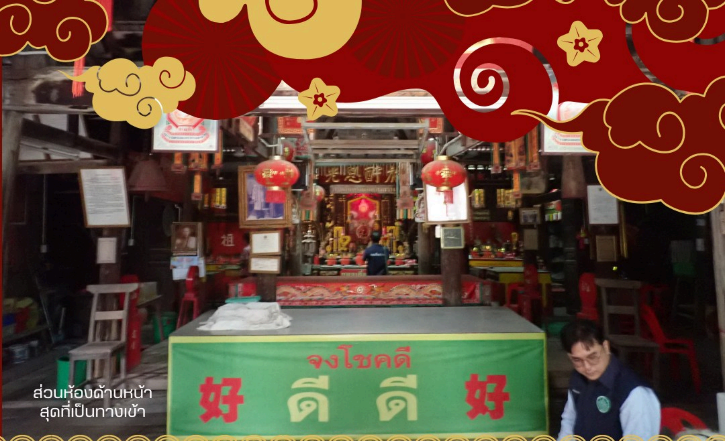
ส่วนห้องด้านหน้า สุดที่เป็นทางเข้า

อาคารศาลเจ้าหลังนี้ เป็นเรือนไม้ที่มีการทำหลังคาจั่วแบบจีน ประกอบไปด้วย ส่วนอาคารในแกนกลาง (บริเวณห้องด้านในสุดที่ประดิษฐานรูปเคารพเทพเจ้า, บริเวณห้องตรงกลางที่ตั้งโต๊ะสำหรับวางของเซ่นไหว้ และบริเวณด้านหน้าสุดที่เป็นทางเข้า) และมีแนวอาคารขนานข้างอาคารประธาน ซึ่งเป็นส่วนอาคารบริวารปิดล้อมแนวแกนประธาน (ทิศเหนือ-ใต้) โครงสร้างทั้งหมดนี้เชื่อมต่อกันภายในมีการแบ่งพื้นที่ตามแนวเสาและหลังคาจั่วแหลม