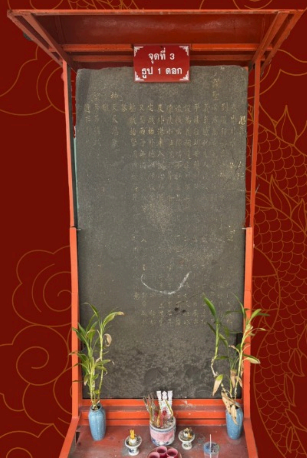
จุดที่ 3 รูป 1 ดอก

ศาลเจ้าแห่งนี้มีประวัติความเป็นมาชัดเจน โดยสามารถทราบได้จากจารึกบนแผ่นหินตั้งอยู่บริเวณด้านหน้าประตูทางเข้าศาลเจ้าอยู่จำนวน 2 หลัก มีจารึกอักษรจีนอยู่ ทั้งนี้ศาลเจ้าได้มีการแปลข้อความที่ปรากฏบนแผ่นหินไว้แล้ว โดยได้เผยแพร่ใจความจากจารึกเป็นแผ่นกระดาษบรรจุไว้ในกรอบรูปติดไว้ที่บริเวณผนังข้างประตูทางเข้า