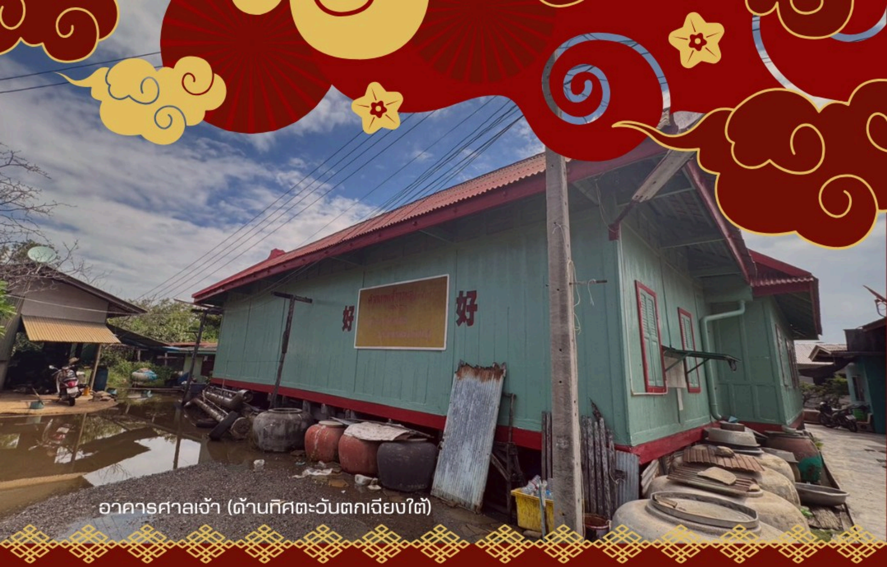
อาคารศาลเจ้า (ด้านทิศตะวันตกเฉียงใต้)

จะเห็นได้ว่าศาลเจ้าแห่งนี้เกี่ยวข้องกับชาวจีนไหหลำที่เดินทางข้ามทะเลเพื่อการค้าขาย โดยเข้ามาตั้งถิ่นฐานบริเวณบ้านแหลม จึงได้มีการสร้างศาลเจ้าเพื่อเป็นศูนย์รวมจิตใจของชุมชนไว้ ต่อมาในปี พ.ศ. 2352 (ปีมะเส็ง 1809) ซึ่งตรงกับปีแรกของสมัยรัชกาลที่ 2 ศาลเจ้าแห่งนี้ได้อยู่ในสภาพทรุดโทรมหักพัง ชุมชนจึงเรียโรเงินร่วมกับซ่อมแซมให้อยู่ในสภาพดี อีกทั้งยังซ่อมแซมโรงจิว และส่วนประกอบอื่น ๆ ด้วย