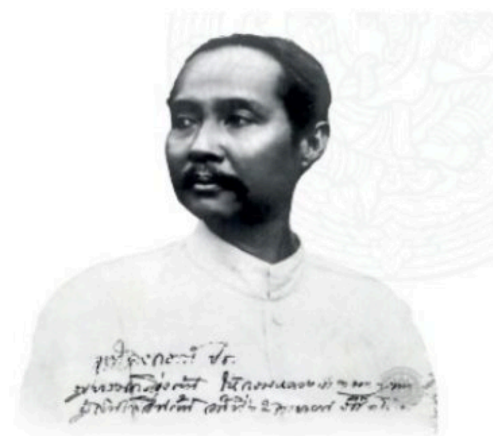
พระบรมฉายาลักษณ์พระบาทสมเด็จพระจุลจอมเกล้าเจ้าอยู่หัว ทรงฉลองพระองค์สีขาว ทรงเรียกว่า “รูปทรงเครื่องต้น” พระราชทานแก่ ผู้ตามเสด็จประพาสต้น พ.ศ. ๒๔๔๗