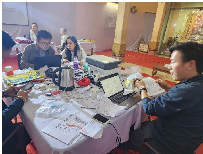
การเตรียมงานด้านเอกสารและการต้อนรับผู้เข้าร่วมกิจกรรม ซึ่งประกอบด้วยคณะพระเถระชั้นผู้ใหญ่ บรรพชิต และนักวิชาการจากทั่วโลก ณ สำนักงานชั่วคราว วัดเมียนมา เมืองพุทธคยา รัฐพิหาร สาธารณรัฐอินเดีย