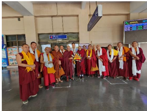
การต้อนรับพระสังฆราชและผู้นำคณะสงฆ์จากประเทศต่าง ๆ ณ สนามบินนานาชาติคยา เมืองพุทธคยา

เตรียมความพร้อมในการต้อนรับคณะผู้แทนจากประเทศต่าง ๆ และประสานให้ข้อมูลความรู้ เบื้องต้นเกี่ยวกับคณะสงฆ์ไทยและวัตรปฏิบัติ รวมถึงวัฒนธรรมประเพณีไทย เช่น เวลา การฉันภัตตาหารเพล รวมถึงมารยาท ความเหมาะสมในการติดต่อกับคณะสงฆ์ไทยตามขนบธรรมเนียม ประเพณีไทย เพื่อความราบรื่นในการระหว่างการเดินทาง