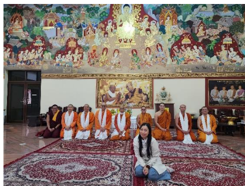
การต้อนรับคณะสงฆ์ไทยจากโครงการแลกเปลี่ยนพระสงฆ์บาลี - สันสกฤต ณ วัดป่าพุทธคยา เมืองพุทธคยา