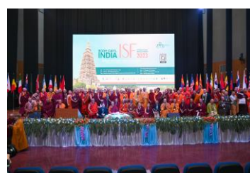
บรรยากาศภายในงาน และพิธีปิดงานการประชุมอภิปรายสังฆนานาชาติ (International Sangha Forum 2023) วันศุกร์ที่ ๒๒ ธันวาคม ๒๕๖๖ ณ หอประชุมใหญ่ ศูนย์วัฒนธรรมมหาโพธิ เมืองพุทธคยา รัฐพิหาร สาธารณรัฐอินเดีย