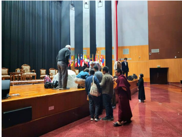
การเตรียมงานและจัดเวที ณ หอประชุมใหญ่ ศูนย์วัฒนธรรมมหาโพธิ เมืองพุทธคยา รัฐพิหาร สาธารณรัฐอินเดีย