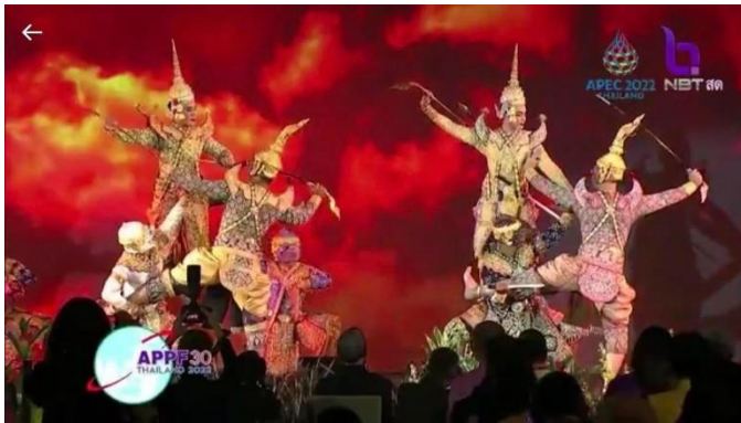
ภาพการแสดงวันที่ 27 ตุลาคม 2566 ณ บ้านพักทรงประธานสภาผู้แทนราษฎรคนที่หนึ่ง จ.นนทบุรี