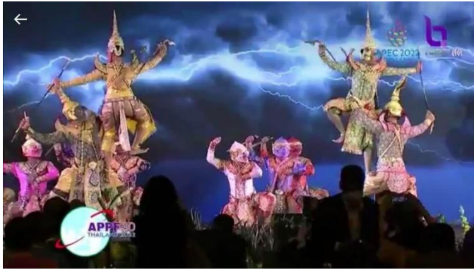
ภาพการแสดงวันที่ 26 ตุลาคม 2566 ณ ห้อง Convention Hall ชั้น B2 อาคารรัฐสภา