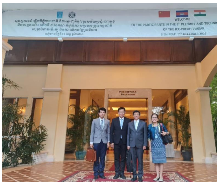
คณะผู้แทนประเทศไทยในการเข้าร่วมประชุม