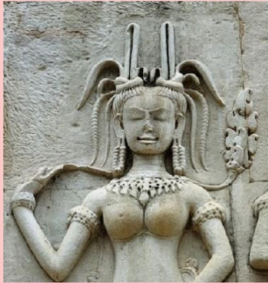
ภาพนางอัปสรปราสาทนครวัด