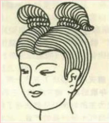
ภาพทรงผมหญิงชาวจีน