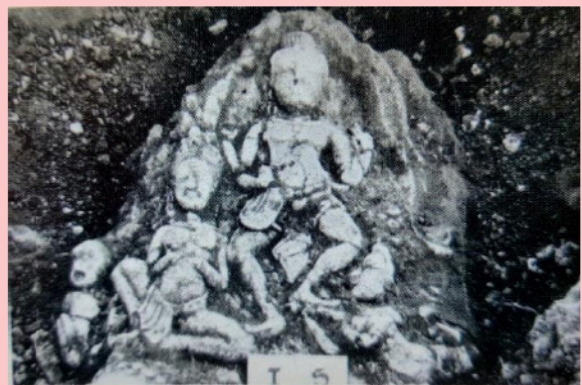
ประติมากรรมปูนปั้น ตอนพระวิษณุปางวามนาวดาร ที่โบราณสถานเนินทางพระ