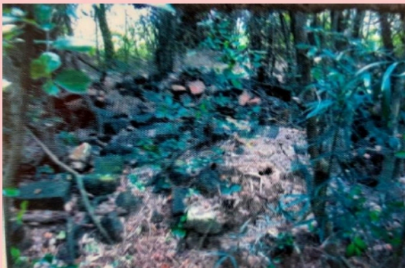
โบราณสถานเนินทางพระ อ.สามชุก จ.สุพรรณบุรี

เนินทางพระ ตั้งอยู่ที่อำเภอสามชุก จังหวัดสุพรรณบุรี ปัจจุบันมีสภาพเป็นเนินดินกลางทุ่งนาและมีหญ้าขึ้นปกคลุมโดยรอบ เมื่อ พ.ศ. ๒๕๒๒ สำนักศิลปากรที่ ๒ สุพรรณบุรี ลงพื้นที่พบโบราณสถานถูกขุดค้ำทำลายจนเสียหาย คงเหลืออยู่เฉพาะส่วนฐานของโบราณสถาน ซึ่งมีศิลาแลง อิฐ และปูนปั้นกองทับถมอยู่รวมกัน พบประติมากรรมที่น่าสนใจหลายชิ้น เช่น พระโพธิ์สัตว์อวโลกิเตศวรสี่กร พระโกษชัยคุรุ พระวิษณุปางวามนาวดาร พระคเนศ และลวดลายปูนปั้นที่ใช้ประดับโบราณสถานอีกจำนวนมาก โบราณสถานเนินทางพระเป็นศาสนสถานเนื่องในศาสนาพุทธ นิกายมหายานและศาสนาพราหมณ์ - ฮินดูรวมอยู่ด้วย มีอายุราวพุทธศตวรรษที่ ๑๘ ปรากฏหลักฐานที่แสดงให้เห็นการเคยมีอยู่ของอาคารศาสนสถาน ได้แก่ ก้อนศิลาแลงที่เป็นวัสดุหลักในการก่อสร้าง และประติมากรรมปูนปั้นที่ใช้ประดับตกแต่งอาคาร จากการศึกษาารูปแบบทางศิลปกรรมของประติมากรรมศิลา เช่น พระพุทธรูปปางนาคปรก พระโพธิ์สัตว์อวโลกิเตศวร ประติมากรรมปูนปั้น และพระพิมพ์แบบต่าง ๆ ที่พบจากการขุดแต่ง สรุปได้ว่าโบราณวัตถุเหล่านี้เป็นโบราณวัตถุศิลปะลพบุรี ซึ่งรับอิทธิพลศิลปะขอมแบบบายน