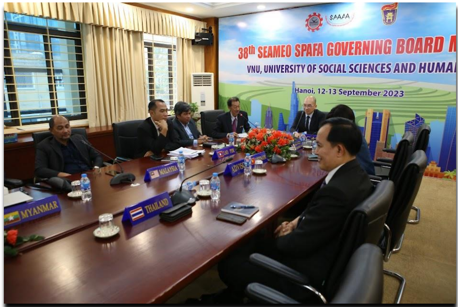
บรรยากาศในห้องประชุม