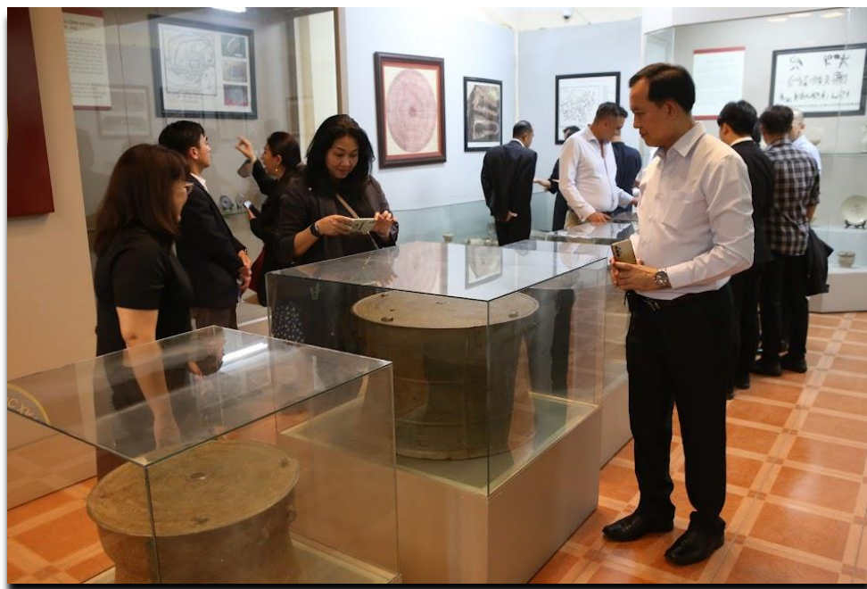
พิพิธภัณฑ์มานุษยวิทยา มหาวิทยาลัยสังคมศาสตร์และมนุษยศาสตร์