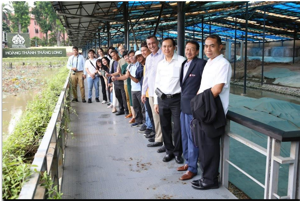
แหล่งจุดค้นซากโบราณสถานใกล้บริเวณพระราชวังทั้งลอง