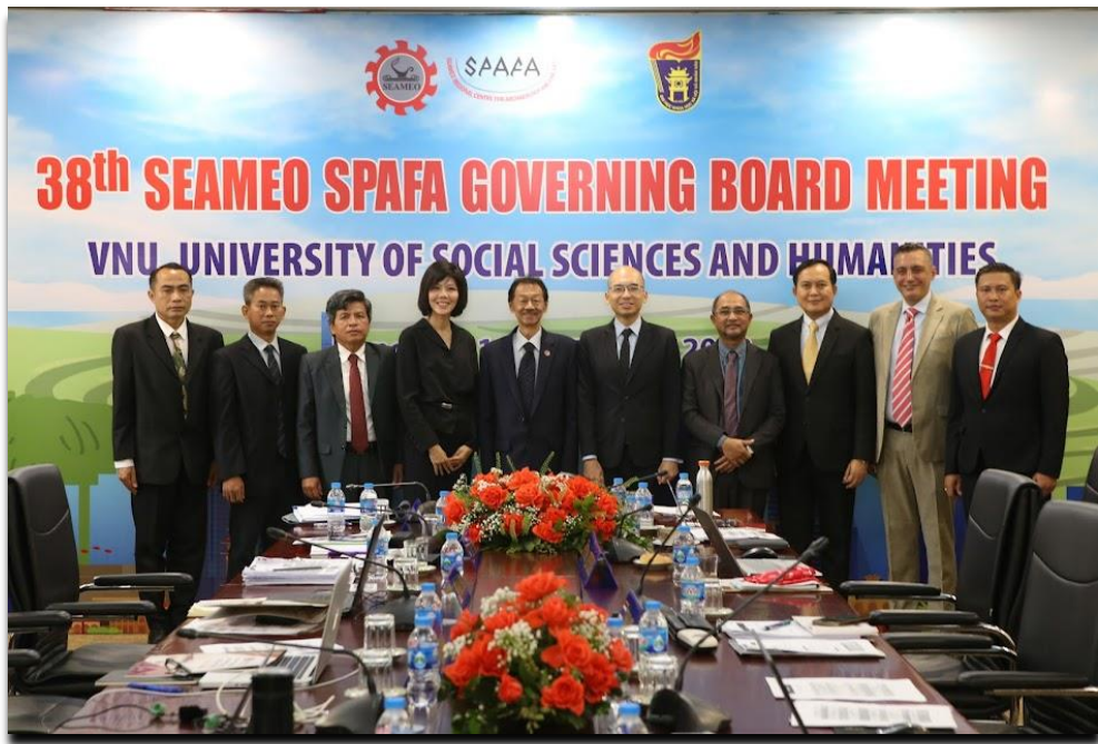
บรรยากาศในห้องประชุมและภาพหมู่