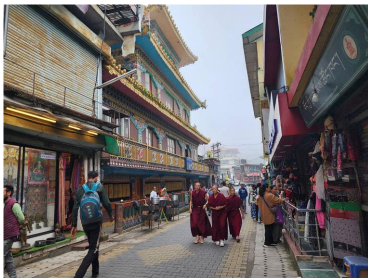
Mani Lhakang Stupa

๑๓.๐๐ - ๑๖.๓๐ น. เยี่ยมชมชุมชนทิเบตที่เมืองแมค - ลอดกัณจ์ (McLeod Ganj) ซึ่งเป็นที่ตั้งของชุมชนชาวทิเบต ณ เมืองธรรมศาลา รัฐหิมาจัลประเทศ และบรรยายเกี่ยวกับวิถีชีวิตความเป็นอยู่ของชาวทิเบตในอินเดีย