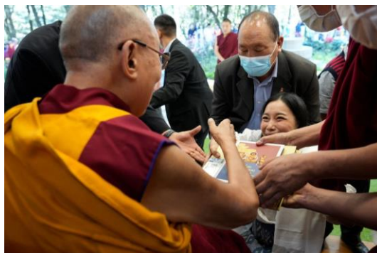
เข้าเฝ้าเพื่อรับพรจากองค์ทะไลลามะ ณ ที่ประทับส่วนพระองค์ วัดหลวงซุกลักคัง เมืองธรรมศาลา รัฐหิมาจัลประเทศ

๐๗.๐๐ - ๑๒.๐๐ น. คณะเดินทางของมูลนิธิหัตถ์ธรรมได้รับพระราชทานอนุญาตให้เข้าเฝ้า องค์ทะไลลามะที่ ๑๔ แห่งทิเบต เพื่อรับพร ณ ที่ประทับส่วนพระองค์ วัดหลวงซุกลักคัง เมืองธรรมศาลา รัฐหิมาจัลประเทศ สาธารณรัฐอินเดีย และร่วมถวายภัตตาหารขณะสงฆ์ไทย - ทิเบต จัดเตรียมโดย ผู้ประสานงานในองค์ทะไลลามะประจำเอเชียตะวันออกเฉียงใต้ สำนักงานองค์ทะไลลามะ (Office of His Holiness The Dalai Lama)