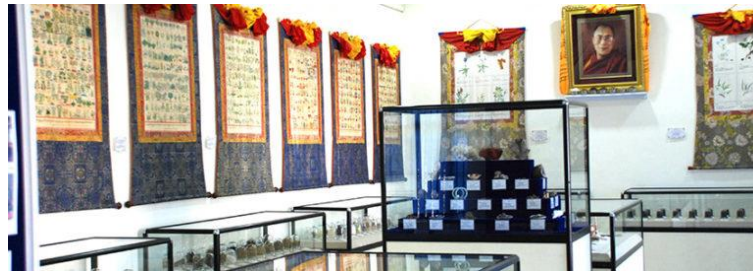
พิพิธภัณฑ์แพทย์แผนทิเบตเมน - ซี - คัง เมืองธรรมศาลา รัฐหิมาจัลประเทศ จัดแสดงสมุนไพร คัมภีร์แพทย์ การคำนวณทางโหราศาสตร์ และภาพองค์ความรู้เกี่ยวกับการแพทย์แผนทิเบต

ชื่อของโรงพยาบาล เมน ซี คัง หมายถึง ยา (เมน) โหราศาสตร์ (ซี) ศูนย์ (คัง) เนื่องมาจากการรักษา ด้วยแพทย์แผนทิเบตนั้น แพทย์จะต้องใช้ยาสมุนไพรรักษา โดยการชกอาการร่วมกับการคำนวณ วันเดือนปีเกิดตามจันทรคติแบบทิเบต เพื่อตรวจหาธาตุเจ้าเรือนของผู้ป่วย สอบสวนอาการของโรค และคำนวณ ความเป็นไปได้ที่จะเกิดโรคในอนาคต ทั้งหมดนี้ประกอบกันจึงเรียกว่า เมน - ซี - คัง (ไม่อนุญาตให้บันทึกภาพ ภายในพิพิธภัณฑ์)