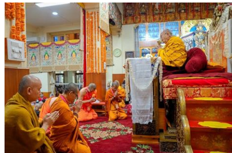
คณะสงฆ์ไทยได้รับการนิมนต์ให้นำสวดมนต์เริ่มพิธีกรรม ก่อนที่องค์ทะไลลามะจะทรงเริ่มแสดงธรรมบรรยาย

๑๓.๐๐ - ๑๖.๓๐ น. เยี่ยมชมชุมชนทิเบตที่เมืองแมค - ลอดกัณจ์ (McLeod Ganj) ซึ่งเป็นที่ตั้งของชุมชนชาวทิเบต ณ เมืองธรรมศาลา รัฐหิมาจัลประเทศ และบรรยายเกี่ยวกับวิถีชีวิตความเป็นอยู่ของชาวทิเบตในอินเดีย