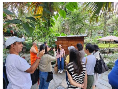
คณะจากมูลนิธิหทัยธรรมเข้าชมสถาบันนอร์บูลิงก้า