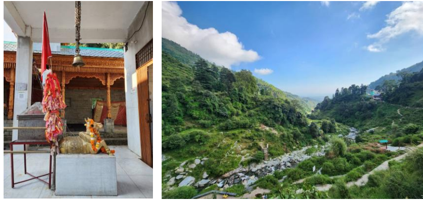
ทัศนียภาพของทางขึ้นน้ำตกพักสุนาค มีเทวาลัยพระศิวะอยู่บริเวณทางขึ้นเขา และมีสถูปทิเบตตั้งอยู่บริเวณเทือกเขา

๑๒.๐๐ - ๑๖.๓๐ น. เยี่ยมชมชุมชนชาวพื้นเมืองที่หมู่บ้านพักสุนาค (Bhagsunag) สถานที่สำคัญทางธรรมชาติ ที่มีชุมชนชาวพุทธและฮินดูอยู่ร่วมกัน โดยบริเวณทางขึ้นเขาจะเป็นที่ตั้งของเทวาลัยที่สร้างอุทิศแด่พระศิวะ ส่วนบริเวณเทือกเขาด้านบนมีการสร้างสถูปแบบทิเบตไว้ และมีการประดับตกแต่งบริเวณเหนือน้ำตกบนเขาด้วยธงมนต์ในคติความเชื่อตามหลักพระพุทธศาสนาแบบทิเบต