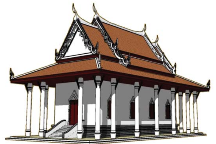
พระอุโบสถ ขนาดกลาง ขนาด 14.40 x 28.80 เมตร