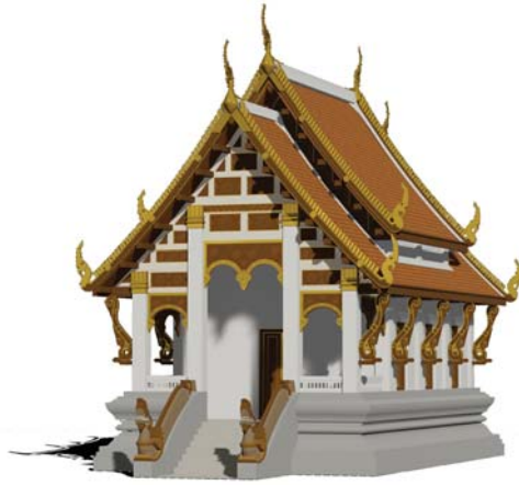
พระอุโบสถ ขนาดเล็ก ขนาด 6.60 x 15.30 เมตร