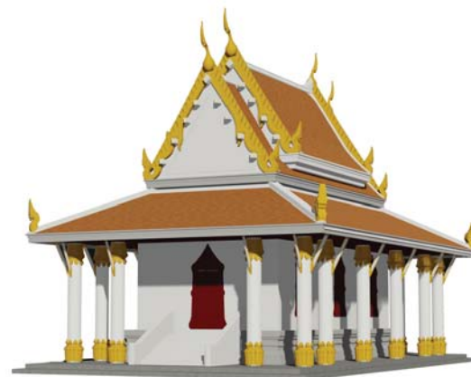
พระอุโบสถ ขนาดเล็ก ขนาด 11.00 x 18.00 เมตร