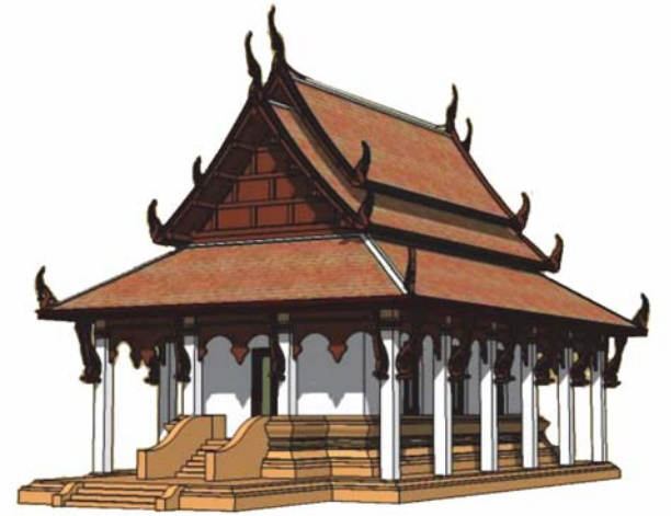
พระอุโบสถ ขนาดกลาง ขนาด 12.00 x 26.00 เมตร