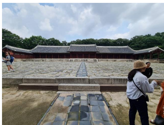
แหล่งมรดกโลกศาลเจ้าชงมโย