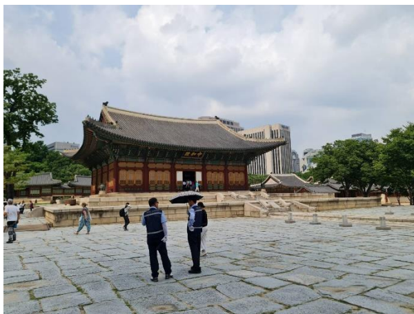
พระราชวังเคียงอกซู

๔. วันที่ ๒๙ มิถุนายน ๒๕๖๖ ประชุมเชิงปฏิบัติการเพื่อสังเคราะห์ข้อมูลที่ได้จากการเรียนรู้การบริหารจัดการแหล่งของสาธารณรัฐเกาหลี สู่การปรับใช้ในแหล่งของประเทศในกลุ่มแม่น้ำโขง จำนวนทั้ง ๕ แห่ง โดยเป็นการให้แต่ละประเทศ สะท้อนสิ่งที่ได้เรียนรู้และแลกเปลี่ยนตลอดโครงการ นำไปสู่การกำหนดแผนงานพร้อมแผนปฏิบัติการที่เป็นรูปธรรมที่สามารถดำเนินการ ซึ่งแผนงานหรือโครงการที่นำเสนอจะนำไปใช้ในการออกแบบการประชุมของผู้ที่จะมาลงทุนในเดือนกันยายน พ.ศ. ๒๕๖๖ ต่อไป โดยในส่วนของประเทศไทย นำเสนอเรื่อง การพัฒนาแหล่งท่องเที่ยวเพื่อคนทั้งมวล