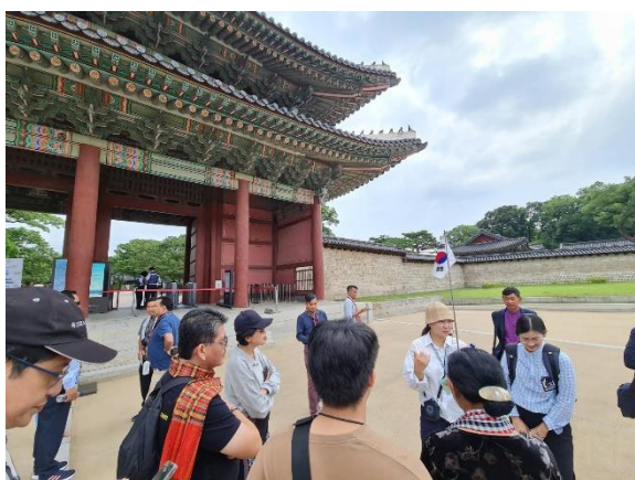
แหล่งมรดกโลกพระราชวังชางด็อกกุง

๓. วันที่ ๒๘ มิถุนายน ๒๕๖๖ เยี่ยมชมแหล่งมรดกโลกและแหล่งวัฒนธรรมสำคัญของสาธารณรัฐเกาหลี ได้แก่ แหล่งมรดกโลกพระราชวังชางด็อกกุง แหล่งมรดกโลกศาลเจ้าชงมโย หมู่บ้านโบราณบุกซอนฮันอก พระราชวังต็อกซุ เพื่อศึกษาแนวคิดและตัวอย่างการบริหารจัดการแหล่งของประเทศในกลุ่มแม่น้ำโขงต่อไป