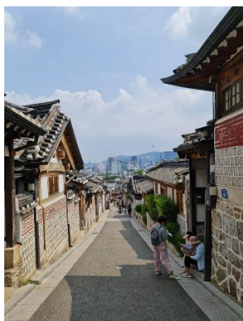
หมู่บ้านโบราณบุกซอนฮันอก