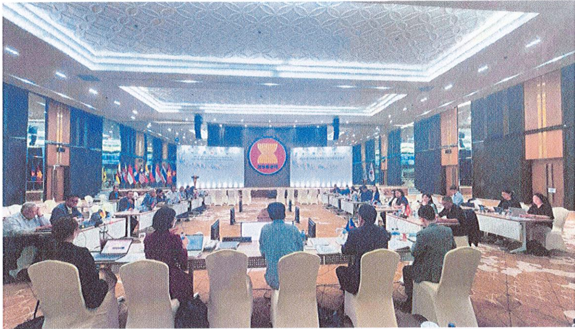
บรรยากาศในการประชุมคณะทำงานฯ ครั้งที่ ๒