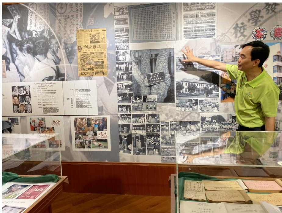
เยี่ยมชมพิพิธภัณฑ์เส้นทางมรดกวัฒนธรรม เกลัง เซราย (Geylang Serai Heritage Trail)