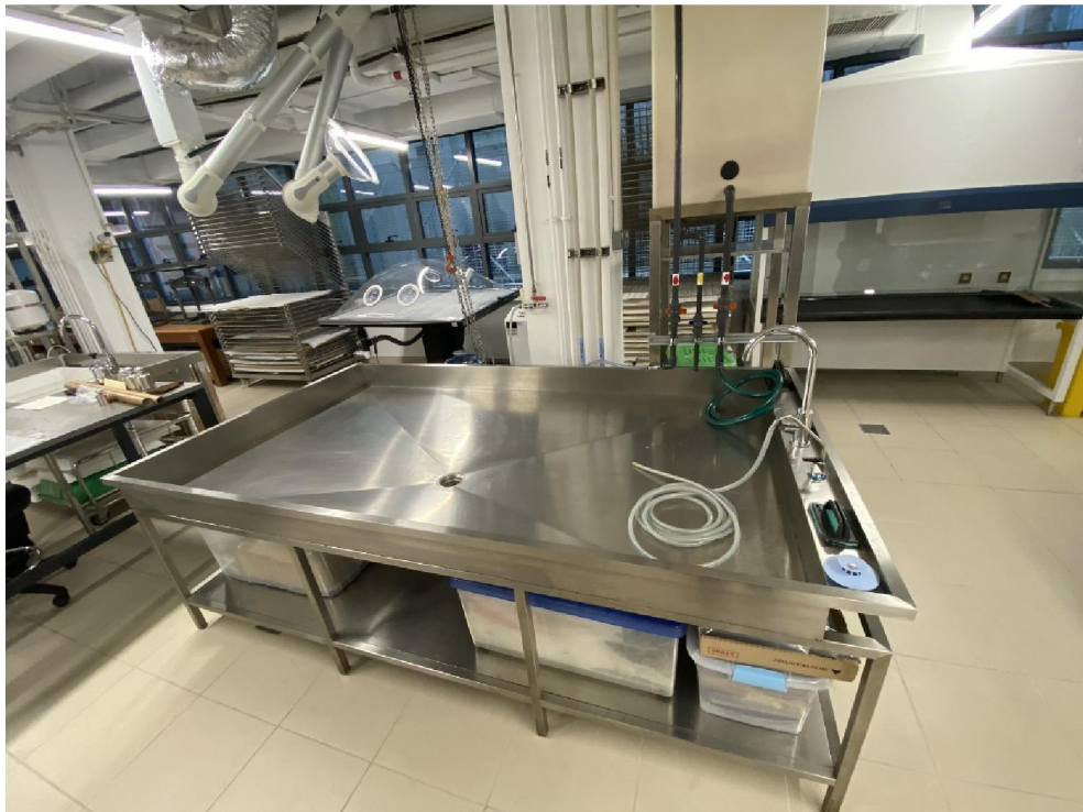
ส่วนงานอนุรักษ์ของหอจดหมายเหตุแห่งชาติ สิงคโปร์