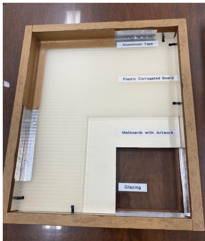
ตัวอย่างการควบคุมสภาพแวดล้อมแบบ Micro Climate ภายในกรอบภาพจิตรกรรม