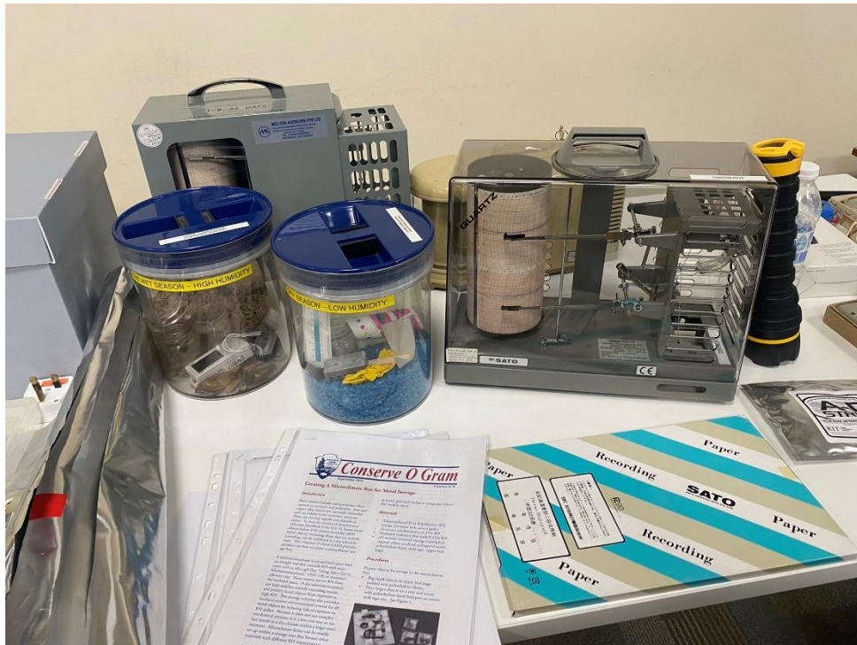
ตัวอย่างเครื่องมือ ประกอบการบรรยายเรื่อง การควบคุมสภาพแวดล้อม