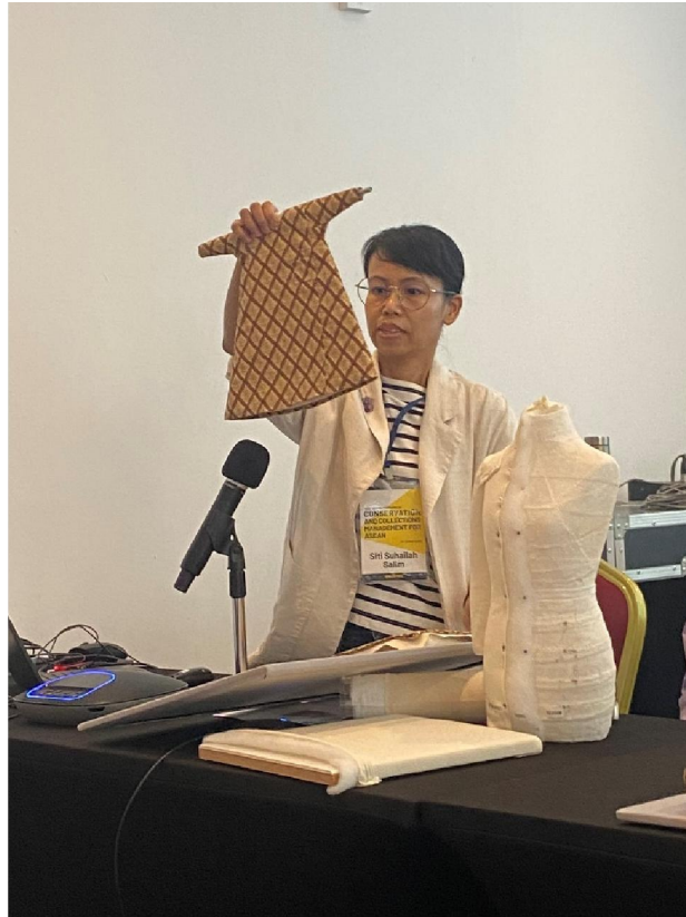
การบรรยายเรื่องเทคนิคการตัดตัดและจัดแสดง ณ ณ พิพิธภัณฑ์ เปอรานากัน (Peranakan Museum)