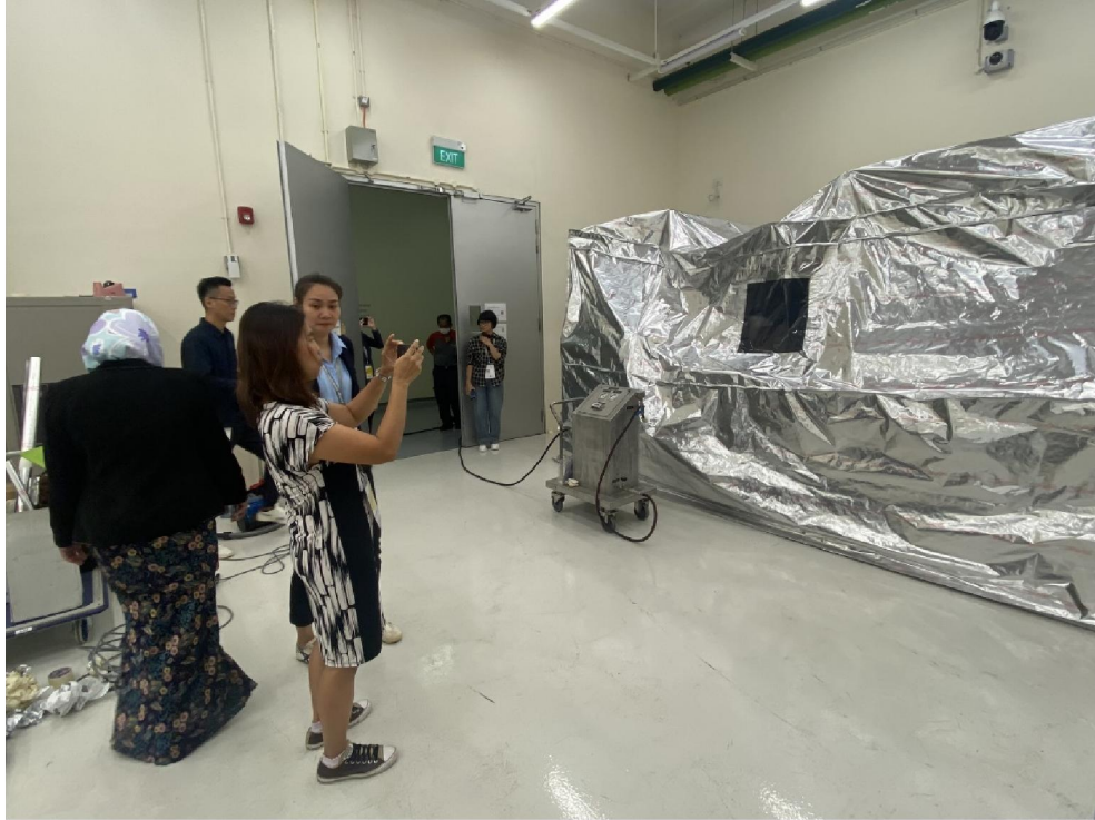
การอบกำจัดแมลงด้วยก๊าซ Nitrogen สำหรับวัตถุขนาดใหญ่ ของ ศูนย์อนุรักษ์มรดกสิงคโปร์