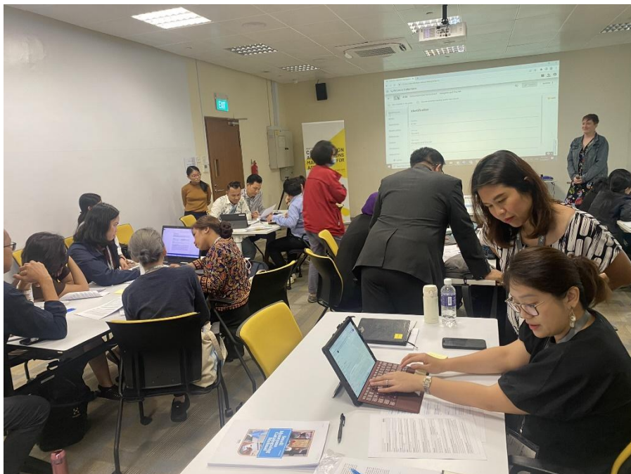
บรรยากาศภายในห้องอบรม ของ ศูนย์อนุรักษ์มรดกสิงคโปร์ (Heritage Conservation Centre: HCC)