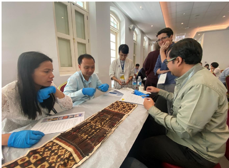
Workshop การตรวจสอบสภาพของวัตถุจัดแสดง