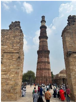
๑. กุตูบ มินาร์

ควบคุมดูแลของกระทรวงวัฒนธรรม รัฐบาลอินเดีย อาคารพิพิธภัณฑสถานเป็นอาคาร ๓ ชั้น ลักษณะเป็นรูปครึ่งวงกลม ตรงกลางเป็นลานสวน ภายในอาคารแบ่งห้องจัดแสดงตามยุคสมัยและรูปแบบศิลปกรรม เช่น ห้องอารยธรรม ฮาร์ปปา ห้องศิลปะโมริยะ ห้องศิลปะคุษาณะ ห้องศิลปะคุปตะ ห้องพุทธศาสนา ห้องจิตรกรรมภาพวาดอินเดีย ห้องถ้ำอชันตา ห้องเครื่องสำริด ห้องเครื่องทองแดง ห้องจารึก ห้องเหรียญกษาปณ์ ห้องอาวุธ ห้องเครื่องประดับ-อัญมณี ห้องเครื่องตกแต่ง-ผ้าทอ ห้องงานสลักไม้-งาช้าง ห้องชาติพันธุ์ชนเผ่า ห้องเครื่องดนตรี ห้องจัดแสดงชั่วคราวเรื่องรามายณะแบบภาพ VR และส่วนพื้นที่กิจกรรมให้ความรู้ สันทนาการแก่เยาวชนและผู้เข้าชม เป็นต้น ทั้งนี้มีส่วนของพื้นที่ห้องปฏิบัติการอนุรักษ์โบราณวัตถุ ศิลปวัตถุ ห้องคลังเก็บโบราณวัตถุ ห้องทำงานของเจ้าหน้าที่ และห้องประชุมสัมมนาที่ไว้ใช้ในการเรียนการสอนหรือฟังบรรยายในการอบรมของโครงการครั้งนี้ด้วย นอกจากนี้ พิพิธภัณฑสถานมีการจัดการเรื่องการรักษาความปลอดภัยโดยเจ้าหน้าที่ตำรวจดูแลห้องจัดแสดง ภายใน-นอกอาคาร ตลอดจนมีการสแกนกระเปาะของผู้เข้าชมและเจ้าหน้าที่เวลาเข้า-ออกอาคารอย่างเข้มงวด