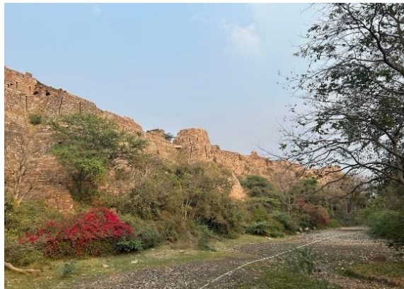
๒. Tughlaqabad Fort