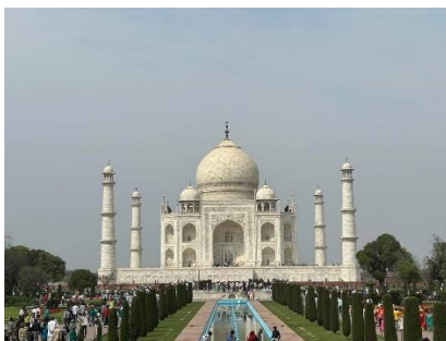
๔. ทัชมาฮาล