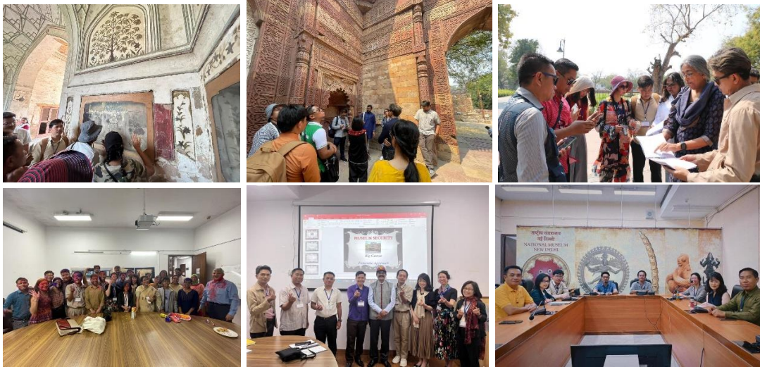
กิจกรรมของ ผู้เข้าร่วมอบรม