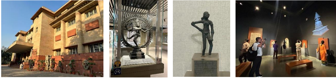
๖. พิพิธภัณฑ์สถานแห่งชาตินิวเดลี อินเดีย