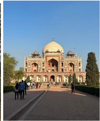
๓. สุสานหุมาયุง