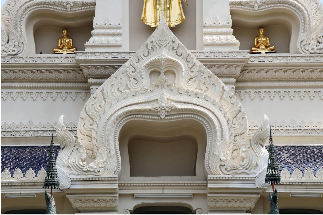
ภาพที่ ๒ พระอุโบสถ วัดบรมนิวาส