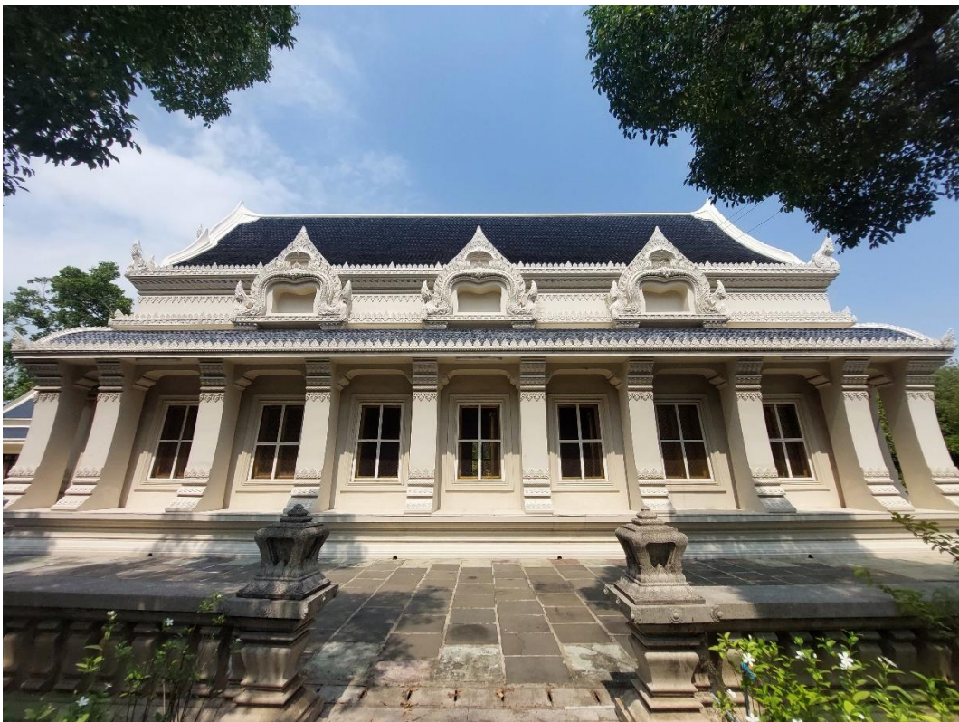
ภาพที่ ๓ ซุ้มประดับคอสอง ทำหน้าที่ค้ำจังหวะคอสอง และทำหน้าที่เป็นหลังคาของอาคารประกบ