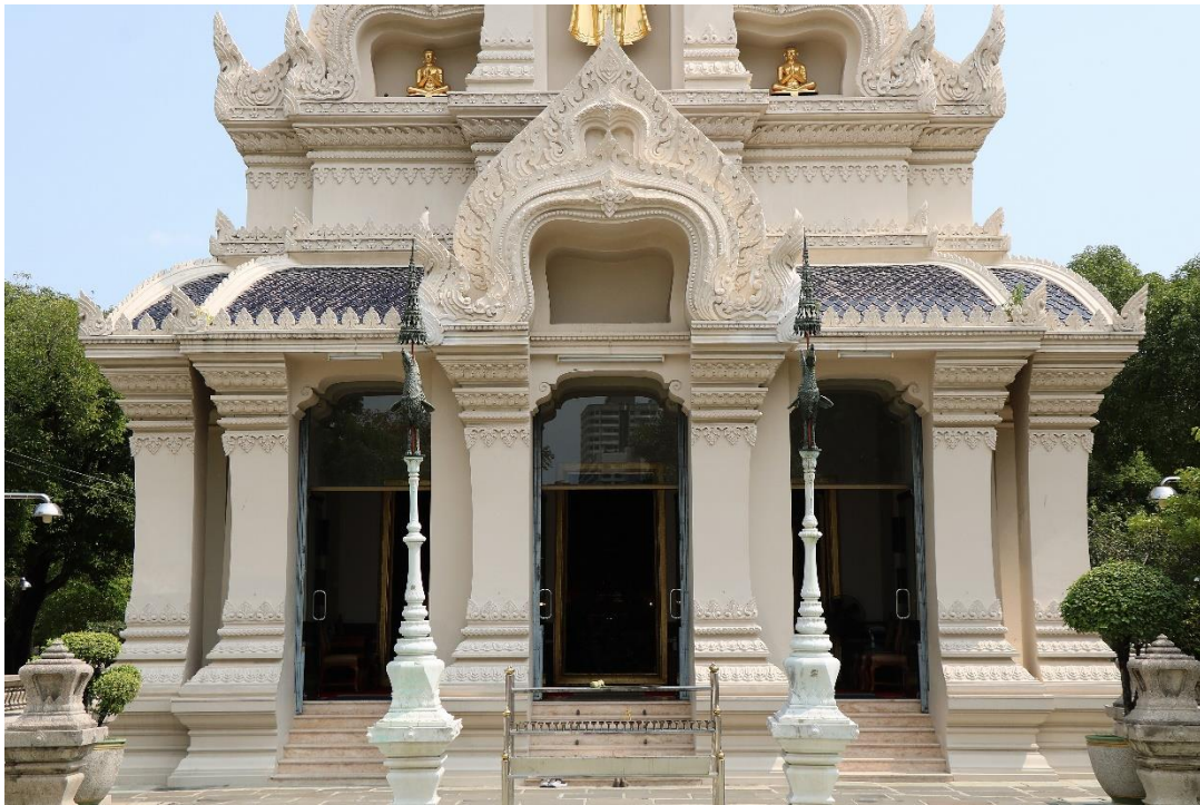
ภาพที่ ๕ มุขลดใต้ช่อ

มุขลดใต้ช่อไม่พบในศิลปะเขมร แต่มีมาแล้วตั้งแต่สมัยอยุธยาที่วิหารพระมงคลบพิตร และพบหลายแห่งในสมัยรัชกาลที่ ๓-๔ อย่างไรก็ตาม การทำมุขลดใต้ช่อแทรกในหลังคาปีกนกปรากฏครั้งแรกในสมัยรัตนโกสินทร์ แต่ไม่เป็นที่นิยม เช่น พระวิหารวัดกัลยาณมิตร สมัยรัชกาลที่ ๓ พระอุโบสถวัดปทุมวนาราม สมัยรัชกาลที่ ๔ ดังนั้น การทำมุขลดใต้ช่อแทรกในหลังคาปีกนกของพระอุโบสถวัดราชาธิวาส จึงสืบเนื่องมาจากรูปแบบงานช่างในรัชกาลก่อนหน้า ๗