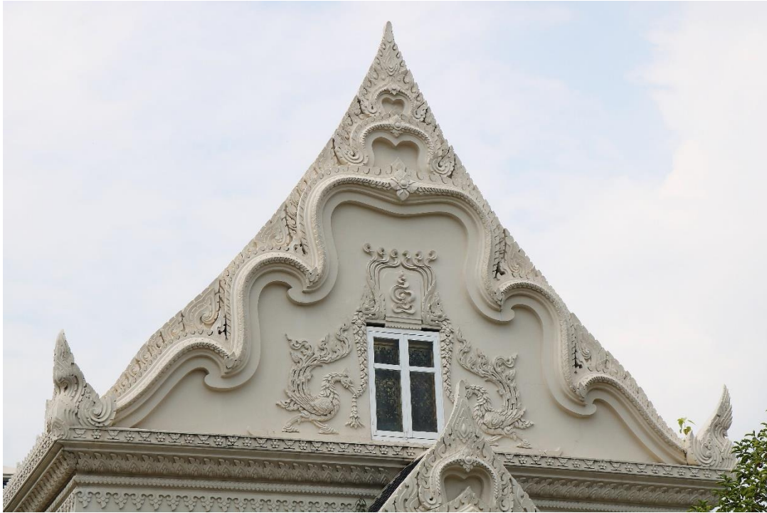
ภาพที่ ๕ หน้าบันด้านทิศตะวันออก (ด้านหลัง)

นอกจากนี้ เนื้อชองหน้าต่างยังประดับยันต์ “เตาะว” หรือ “เฮาะขัดตะหมาด” เป็นสัญลักษณ์แทนพระธรรม ๑๐ ขนาบด้วยรูปมกรคายพวงอุบะและมีหงส์คาบอยู่ด้านล่าง