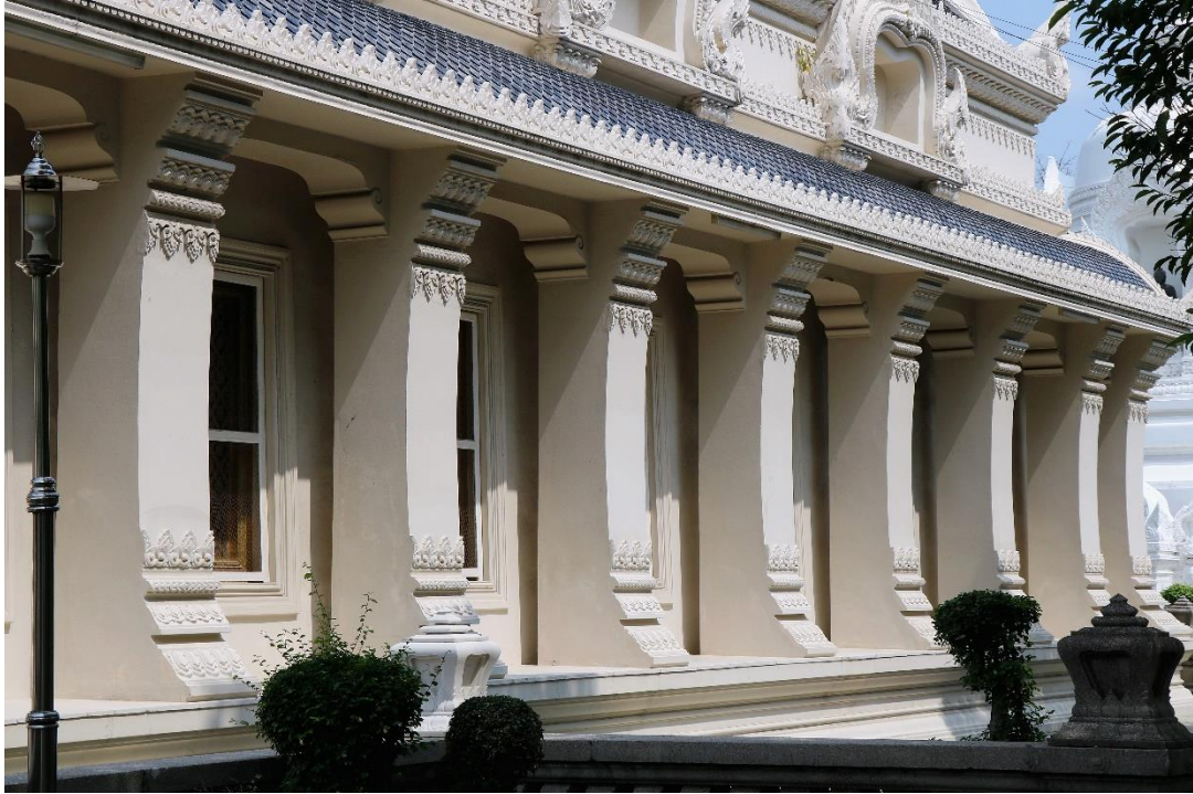
ภาพที่ ๒ พระอุโบสถ วัดบรมนิวาส