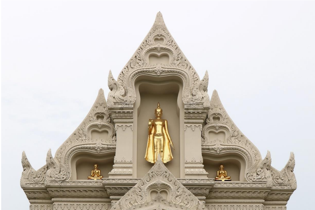
ภาพที่ ๕ หน้าบันด้านทิศตะวันตก (ด้านหน้า)

แสดงธรรม ส่วนซุ้มขนาดเป็นซุ้มแบบเดียวกัน แต่ไม่มีเสา และกรอบซุ้ม ๑ ใน ๔ ถูกซุ้มประธานบดบัง ทั้งนี้ เพื่อให้ซุ้มทั้งหมดประกบกันจนเกิดเส้นรอบนอกเป็นทรงสามเหลี่ยม และภายในซุ้มขนาดประดิษฐานพระสาวกนั่งพนมมือหันหน้าออก