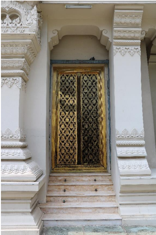
ภาพที่ ๓ ซุ้มประตู บันได และลายประดับเสา