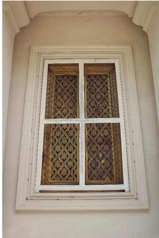
ภาพที่ ๗ กรอบหน้าต่าง