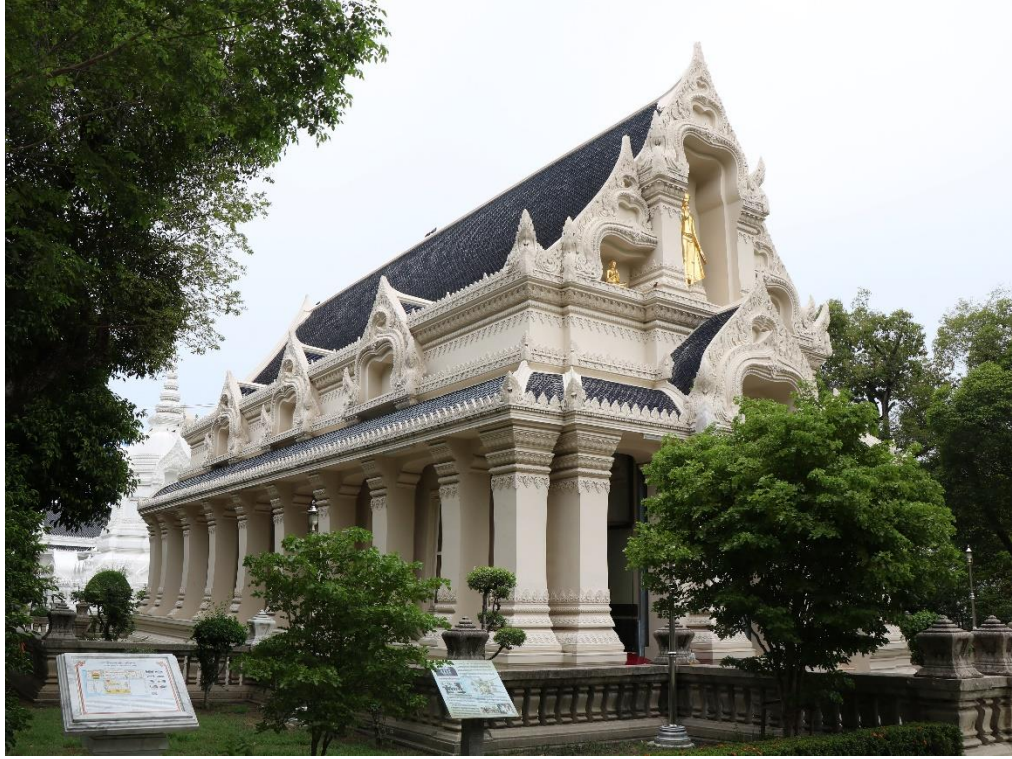
ภาพที่ ๒ พระอุโบสถ วัดราชาธิวาสวิหาร