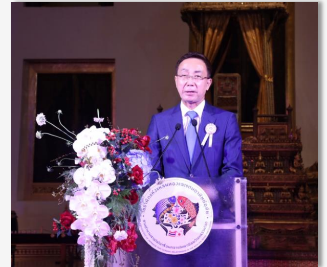
นายณานริ ทากาชิ รองผู้ว่าราชการจังหวัดซากะ ประเทศญี่ปุ่น