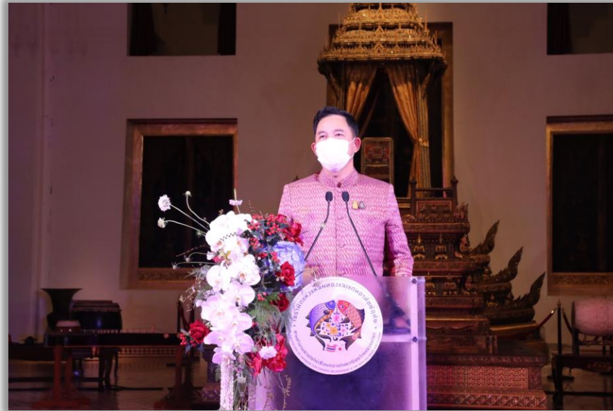
นายอิทธิพล คุณปลื้ม รัฐมนตรีว่าการกระทรวงวัฒนธรรม ประธานในพิธีเปิดนิทรรศการพิเศษ