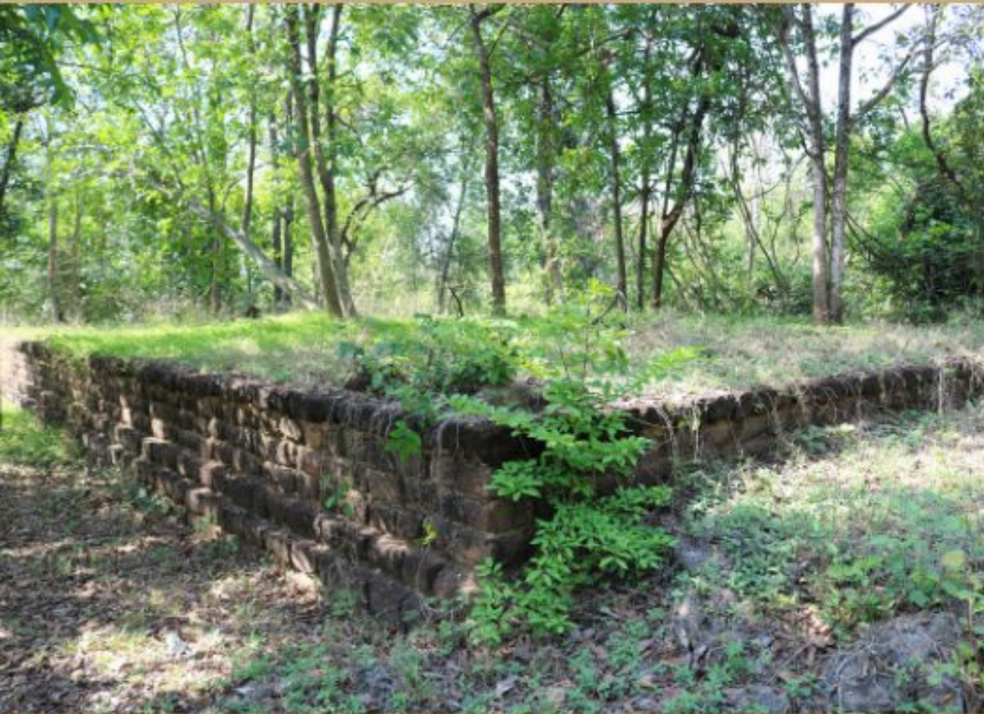
โบราณสถานคอกช้างดิน หมายเลข ๕