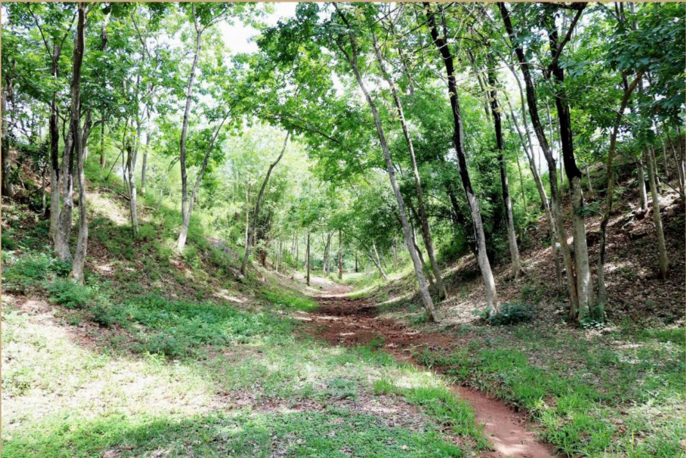
โบราณสถานคอกช้างดิน หมายเลข ๑

กลุ่มโบราณสถานคอกช้างดินที่สร้างเป็นคันดินมีทั้งหมด ๔ แห่ง ลักษณะเป็นคันดินคล้ายอ่างเก็บน้ำ เดิมเชื่อว่าเป็นคอกขังช้างหรือเพนียดคล้องช้าง แต่ปัจจุบันมีหลักฐานจากการดำเนินงานทางโบราณคดีที่โบราณสถานคอกช้างดินหมายเลข ๓ เมื่อปี พ.ศ. ๒๕๔๔ พบว่าสร้างขึ้นเพื่อกักเก็บน้ำที่ไหลมาจากเขาคอกทางทิศเหนือ