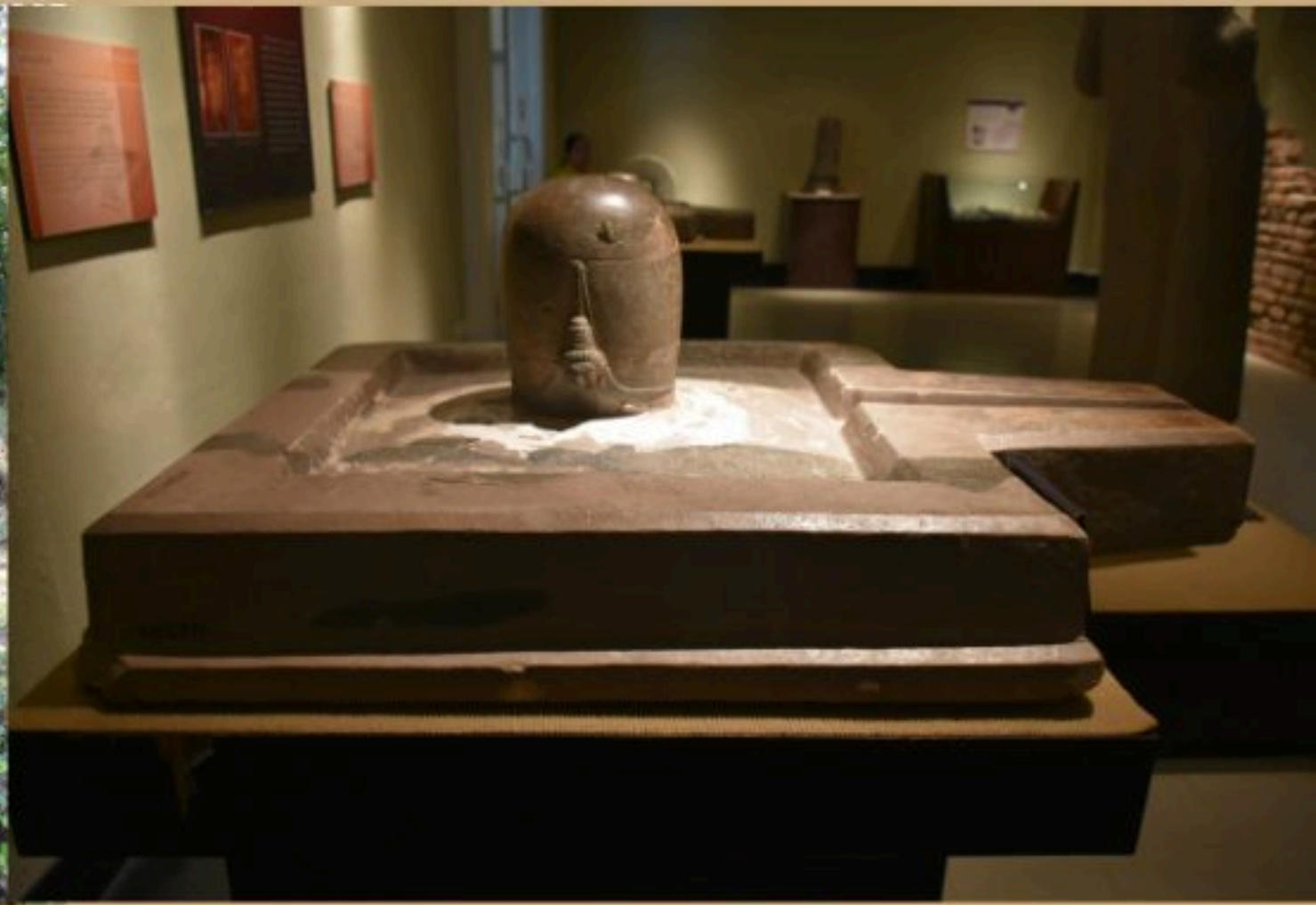
เอกमुखสิงค์