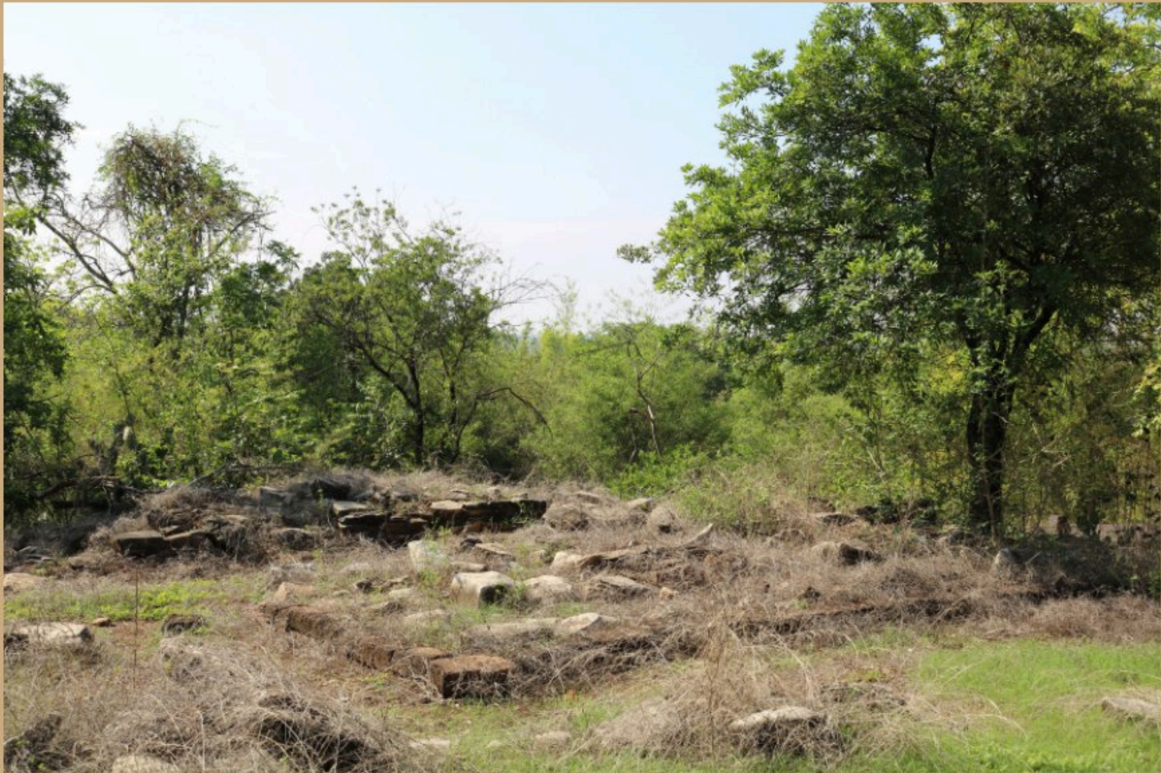
โบราณสถานคอกช้างดิน หมายเลข ๑๒

โบราณสถานที่สร้างด้วยอิฐ ศิลาแลง และอิฐ ตั้งอยู่บริเวณที่ราบเชิงเขาออก ปัจจุบันปรากฏเป็นเนินดิน แบ่งเป็นกลุ่มได้ ๑๖ กลุ่ม ส่วนมากยังไม่ได้ขุดศึกษา โบราณสถานคอกช้างดินที่สร้างด้วยอิฐ ศิลาแลง และอิฐ ซึ่งผ่านการดำเนินงาน ทางโบราณคดีและพบหลักฐานที่สำคัญ มีดังนี้