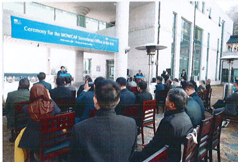
พิธีเปิดการตั้งสำนักงานเลขาธิการคณะกรรมการแห่งภูมิภาคว่าด้วยแผนงานความทรงจำแห่งโลก ภูมิภาค เอเชีย - แปซิฟิก ณ The Korean Studies Institute (KSI)