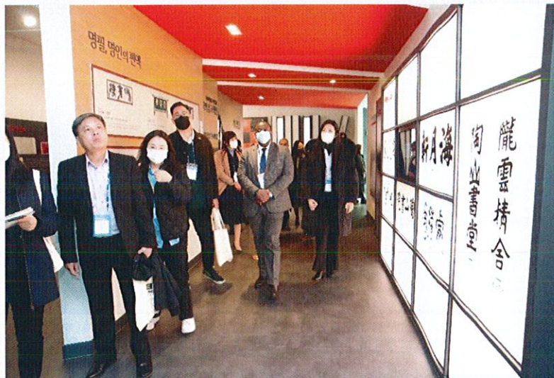
การเยี่ยมชม The Korean Studies Institute (KSI)