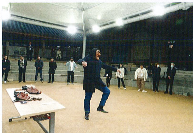
ศึกษาดูงานทางด้านวัฒนธรรม Hahoe Folk Village และ Hahoe Mask Dance: UNESCO ICH (TBC)