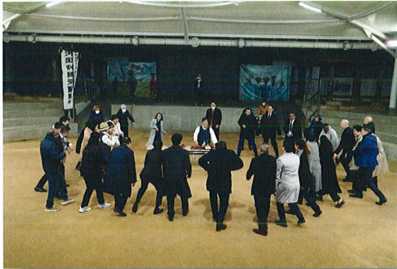
ศึกษาดูงานทางด้านวัฒนธรรม Hahoe Folk Village และ Hahoe Mask Dance: UNESCO ICH (TBC)