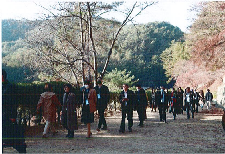
การเยี่ยมชม Dosan Confucian Academy