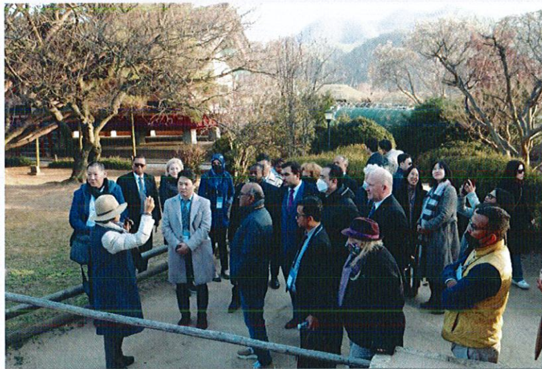
ศึกษาดูงานทางด้านวัฒนธรรม Hahoe Folk Village และ Hahoe Mask Dance: UNESCO ICH (TBC)