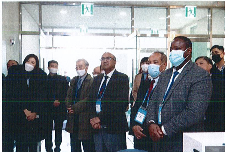
การเยี่ยมชม The Korean Studies Institute (KSI)