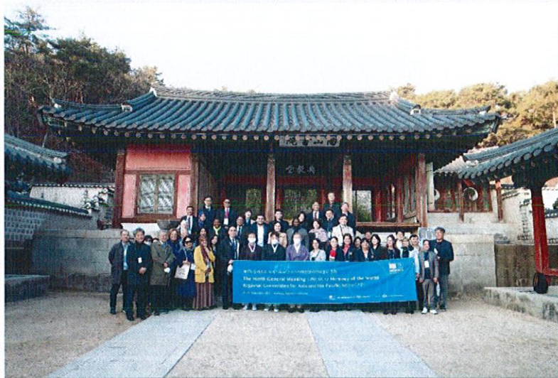
การเยี่ยมชม Dosan Confucian Academy