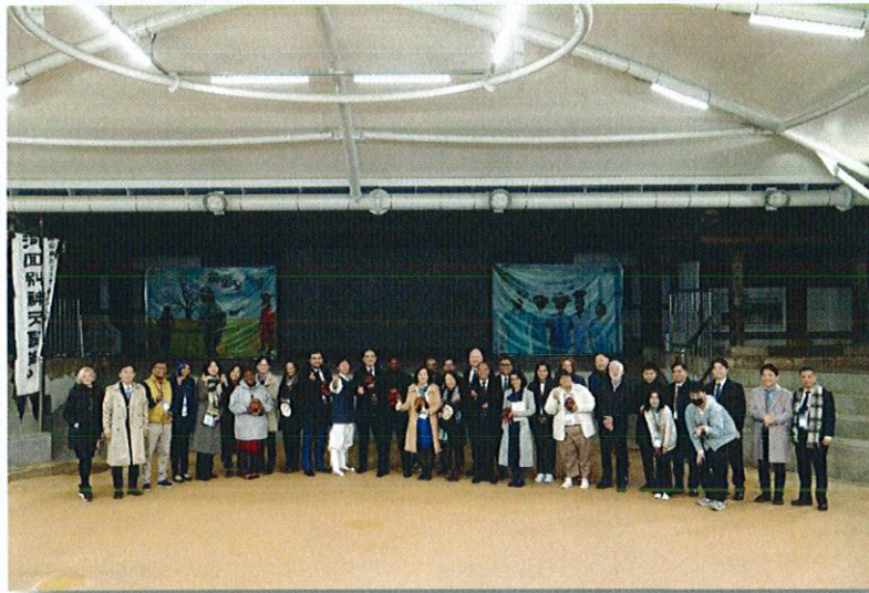
ศึกษาดูงานทางด้านวัฒนธรรม Hahoe Folk Village และ Hahoe Mask Dance: UNESCO ICH (TBC)