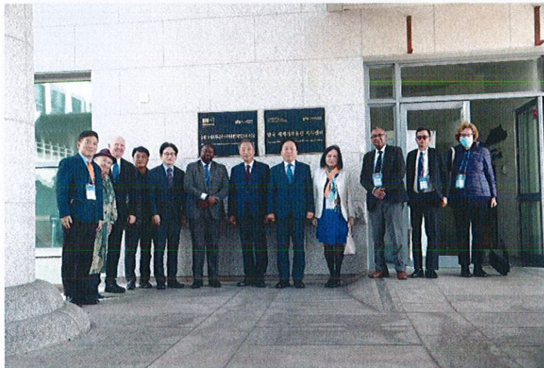
พิธีเปิดการตั้งสำนักงานเลขาธิการคณะกรรมการแห่งภูมิภาคว่าด้วยแผนงานความทรงจำแห่งโลก ภูมิภาคเอเชีย - แปซิฟิก ณ The Korean Studies Institute (KSI)