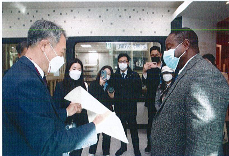
การเยี่ยมชม The Korean Studies Institute (KSI)