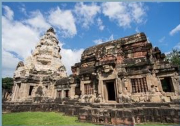
ปราสาทประธานและมณฑป

ปราสาทพนมวันตั้งอยู่ที่ตำบลบ้านโพน อำเภอมេือ่ง จังหวัดนครราชสีมา จากรายงานการบูรณะปราสาทพนมวัน ปีงบประมาณ 2542 ช่วงการดำเนินงาน หรือหินบริเวณฐานเชิงของมณฑปและปราสาทประธาน ชั้นที่ 4 พบหลักฐานโบราณวัตถุฝังอยู่ใต้หินทรายรอบแท่นอิฐทั้งสิ้น 11 ชิ้น ประกอบด้วย แผ่นทองรูปสี่เหลี่ยม แผ่นทองรูปใบไม้ แผ่นเงินรูปใบไม้ และแผ่นสำริดรูปใบไม้