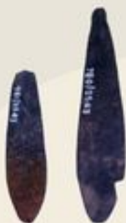
แผ่นเงินรูปใบไม้