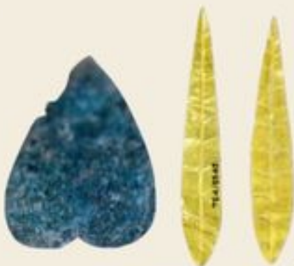
แผ่นสำริดรูปใบไม้ แผ่นทองรูปใบไม้

ตำแหน่งลักษณะการพบโบราณวัตถุที่ฝังใต้หินทรายรอบแท่นอิฐ