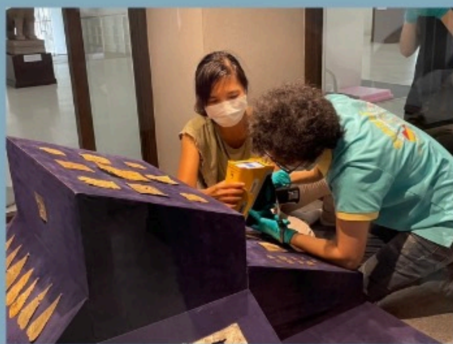
เครื่องวิเคราะห์ธาตุแบบพกพา (Vanta M Series XRF analyzer)

กรมศิลปากรและสถาบันวิจัยแสงซินโครตรอน (องค์การมหาชน) มีข้อตกลงความร่วมมือทางวิชาการ เพื่อนำกระบวนการทางวิทยาศาสตร์มาศึกษาวิจัยและพัฒนางานทางโบราณคดี การศึกษาในครั้งนี้ได้ร่วมมือกับพิพิธภัณฑ์สถานแห่งชาติ พินาย ทำการตรวจวิเคราะห์ธาตุองค์ประกอบของแผ่นทองจากแหล่งโบราณคดี ด้วยเครื่องมือทางวิทยาศาสตร์ของสถาบันวิจัยแสงซินโครตรอน ได้แก่ เครื่องวิเคราะห์ธาตุแบบพกพา (Vanta M Series XRF analyzer) และเครื่องกำเนิดแสงสยาม (Siam Photon Source) เครื่องกำเนิดแสงซินโครตรอนในส่วนงานระบบลำเลียงแสงที่ 8 โดยใช้ลำแสงซินโครตรอนผ่านกระบวนการขั้นตอนทางวิทยาศาสตร์ ในการหาค่าองค์ประกอบธาตุวัตถุประเภทแผ่นทอง ผลจากการวิจัยกลุ่มตัวอย่างแผ่นทองของปราสาทพนมวันพบค่าทองเป็นจำนวนมากโดยมีองค์ประกอบทอง 97.3% ธาตุที่พบรองลงมาคือ ทองแดง และเงิน