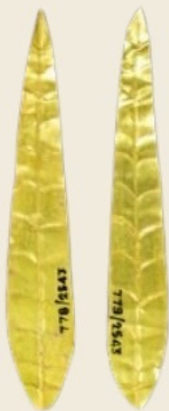
ตัวอย่างแผ่นทองรูปใบไม้ที่มีองค์ประกอบทอง 97.3% ยาว 13 ซม. กว้าง 2 ซม. พบที่ฐานเชิงมณฑปปราสาทประธาน ทิศตะวันออก