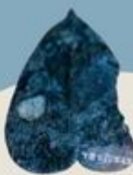
แผ่นสำริดรูปใบไม้