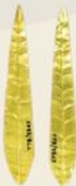
แผ่นทองรูปสี่เหลี่ยม แผ่นทองรูปใบไม้