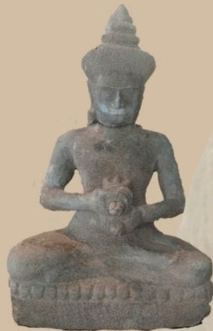
รูปพระโกษัชยคุรุฑูรยประภา ตถาคต