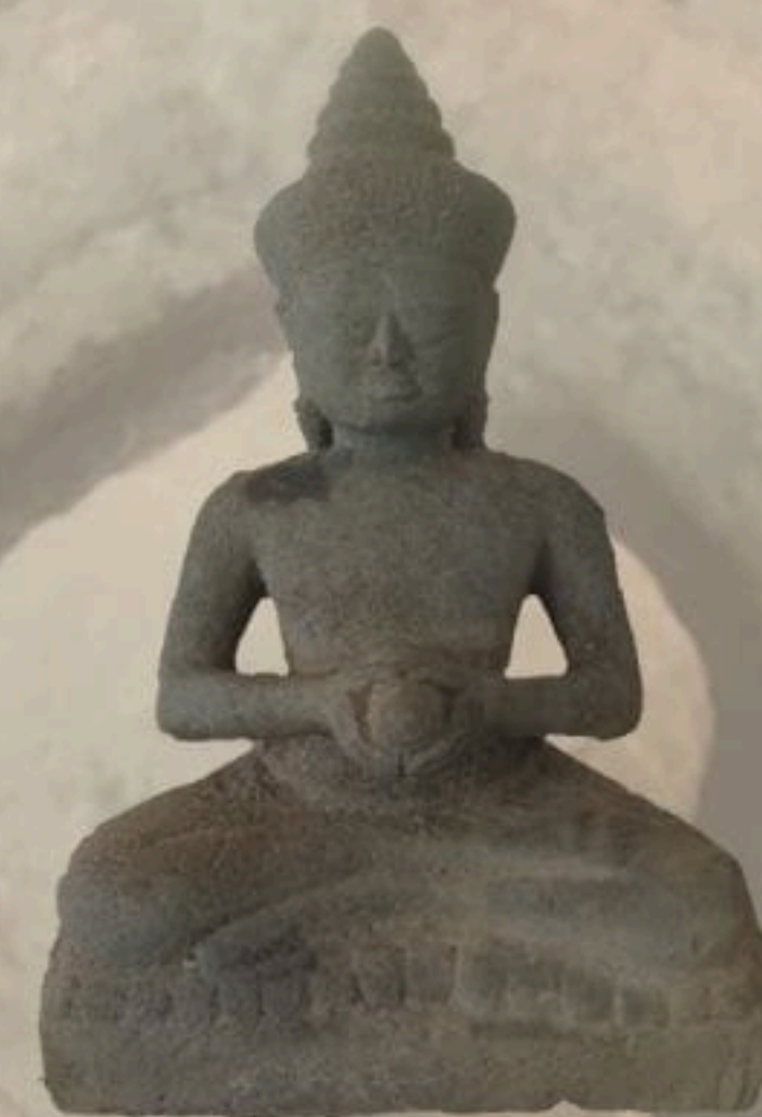
รูปพระไวโรจนะโพธิสัตว์ หรือ พระจันทรไวโรจนะโพธิสัตว์

'พระองค์ได้สร้างโรงพยาบาล และรูปพระโพธิสัตว์โกษัชยสุคตพร้อมด้วย รูปพระ ชีโนรสทั้งสองโดยรอบ เพื่อความสงบแห่งโรคของประชาชนตลอดไป '