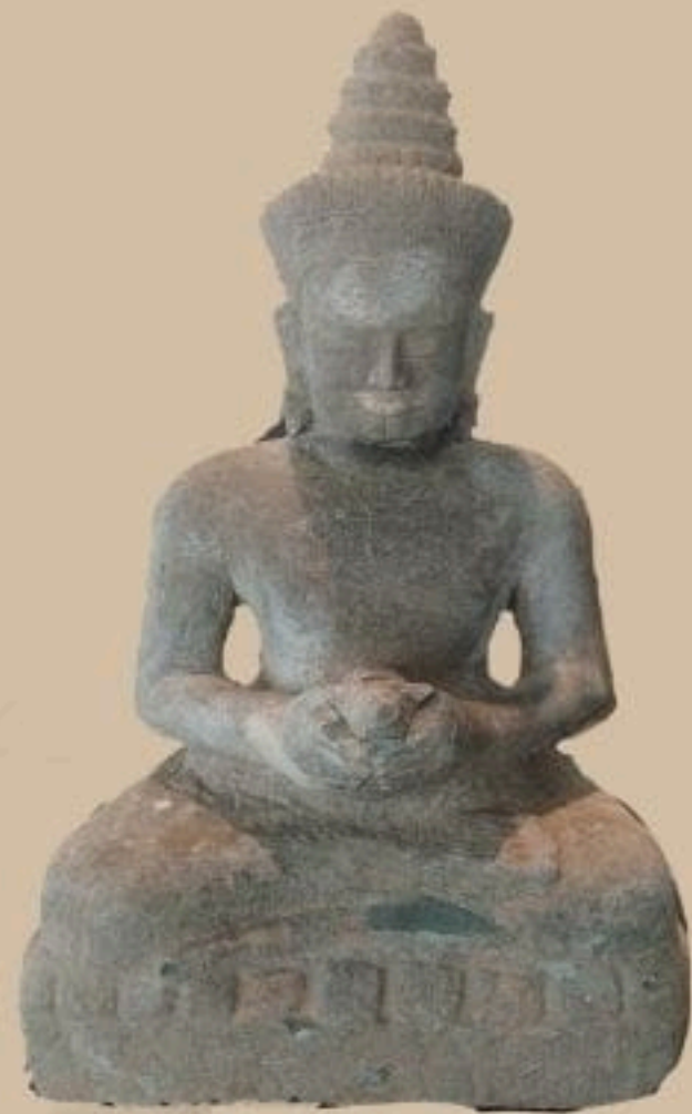
รูปพระไวโรจนะโพธิสัตว์ หรือ พระจันทรไวโรจนะโพธิสัตว์