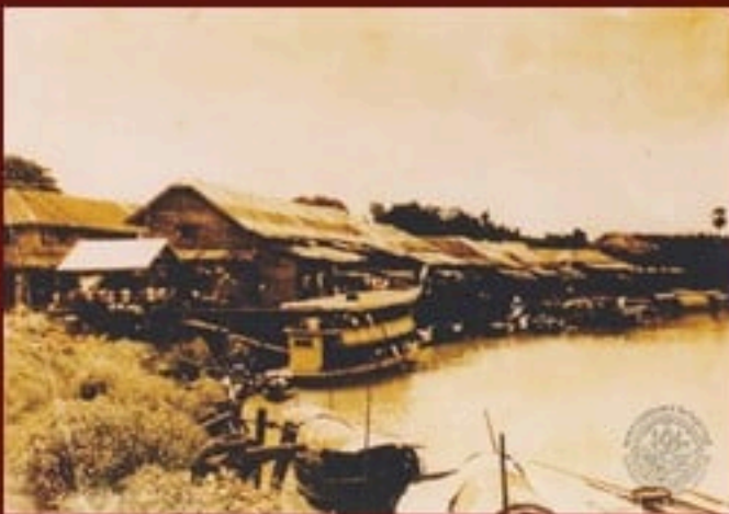
ภ ลพ ๑๖๒๒.๒/๑๓๔ เรือเมล์ ๒ ชั้นที่ตลาดบางปลาหมอ ปี ๒๕๐๐

เส้นทางเรือเมล์จากกรุงเทพถึงสุพรรณบุรี จากท่าเตียนและจิวรายให้บริการโดย บริษัท สุพรรณบุรีขนส่ง ซึ่งเป็นบริษัทเดินเรือที่ใหญ่ที่สุดในเส้นทางแม่น้ำเจ้าพระยาและท่าจีน ก่อตั้งเมื่อ พ.ศ. ๒๔๕๖ โดยเรือประกอบด้วย ตัวเรือต่อด้วยไม้ตะเคียนและไม้สัก หัวเรือคล้ายเตารีดแบบโบราณ หลังคาแบน มีเสารองรับ มีผ้าผูกชายคาเรือ เครื่องยนต์กลางลำเรือ มีท่อไอเสียบนหลังคา พวงมาลัยที่หัวเรือ มีห้องสุขาท้ายเรือ ภายนอกทาด้วยสีแดงทองเรือสีดำ จึงเรียกกันว่า “เรือเมล์แดง” เรือสุพรรณขนส่งมีทั้งแบบชั้นเดียว ชั้นครึ่ง สองชั้น และเรือด่วน โดยที่ท่าการบริษัทอยู่ที่ท่าเรือจิวรายเป็นแม่ข่าย และมีสาขากระจายออกไปหลายแห่ง มีท่าเรือเมล์ เช่น ที่สุพรรณบุรี สามชุก บางเลน บางหลวง แต่ละที่มีนายท่าเป็นผู้จัดการ