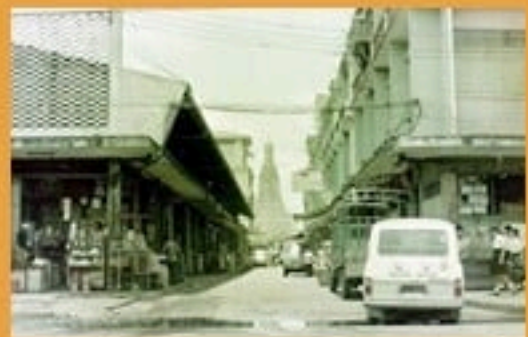
ชอยท่าเรือสุพรรณ หรือท่าเรือสีเลือดหมู ถ.มหาสาร พ.ศ. ๒๕๑๖ ๓๓๗1๓๗ 77PPP

เรือเมล์ของบริษัทสุพรรณบุรีขนส่งเลิกให้บริการ เนื่องจากการเดินทางทางถนนสะดวกขึ้น