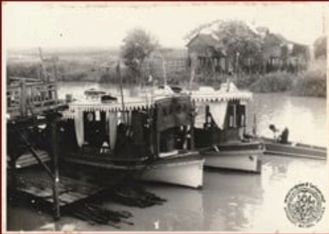
ภ ลพ ๗๘/๒๕ เรือโดยสารบริเวณท่าเรือบ้านลุด บางปลาหมอ