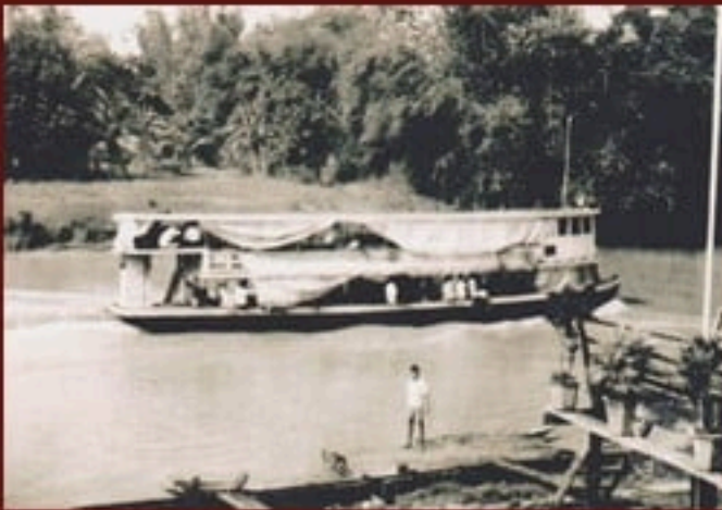
ภ ลพ ๑๖๒๒.๘/๑ เรือเมล์ ๒ ชั้น