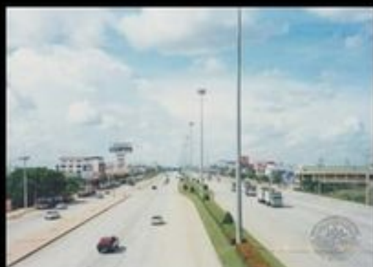
ภ ๓๗ ๓๖ ๒.๒/๖๗ ถนนหมายเลข ๓๕๐ ถ่ายเมื่อ ๕ กันยายน พ.ศ. ๒๕๔๕