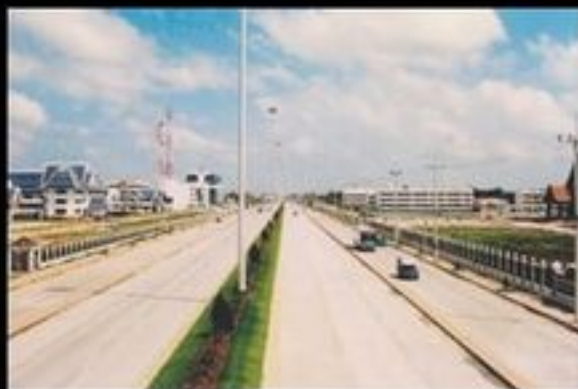
ภ ๓๗ ๓๖ ๒.๒/๕๕๓ ถนนทางหลวงแผ่นดิน ๓๕๐ บริเวณศูนย์ราชการ ถ่ายเมื่อ พ.ศ. ๒๕๕๕

จากเอกสารจดหมายเหตุ บันทึกสำนักงานเศรษฐกิจการคลัง ระบุว่า คณะรัฐมนตรีได้มีมติเมื่อวันที่ ๒๖ พฤศจิกายน พ.ศ.๒๕๐๖ ให้ดำเนินการปรับปรุงทางสายสุพรรณบุรี-ชัยนาท ซึ่งเป็นการปรับปรุงถนนดินที่ทางจังหวัดทำไว้ให้เป็นถนนถาวร เนื่องจากเส้นทางสายนี้มีความจำเป็นและสำคัญในทางเศรษฐกิจมาก เพราะบริเวณนี้มีพืชผลมากแต่ขาดเส้นทางคมนาคมทางบก แต่มีมติคณะกรรมการพิจารณาปรับปรุงโครงการทางหลวงนั้นให้รอการดำเนินการไว้ก่อน จนกว่าโครงการทางหลวงแผ่นดิน ๘ ปี (พ.ศ. ๒๕๐๖ - ๑๕๑๓) จะแล้วเสร็จ เนื่องจากถนนสายนี้อยู่ในที่ลุ่ม มีทางขนส่งทางน้ำ ทำให้ค่าก่อสร้างมาราคาสูงมาก