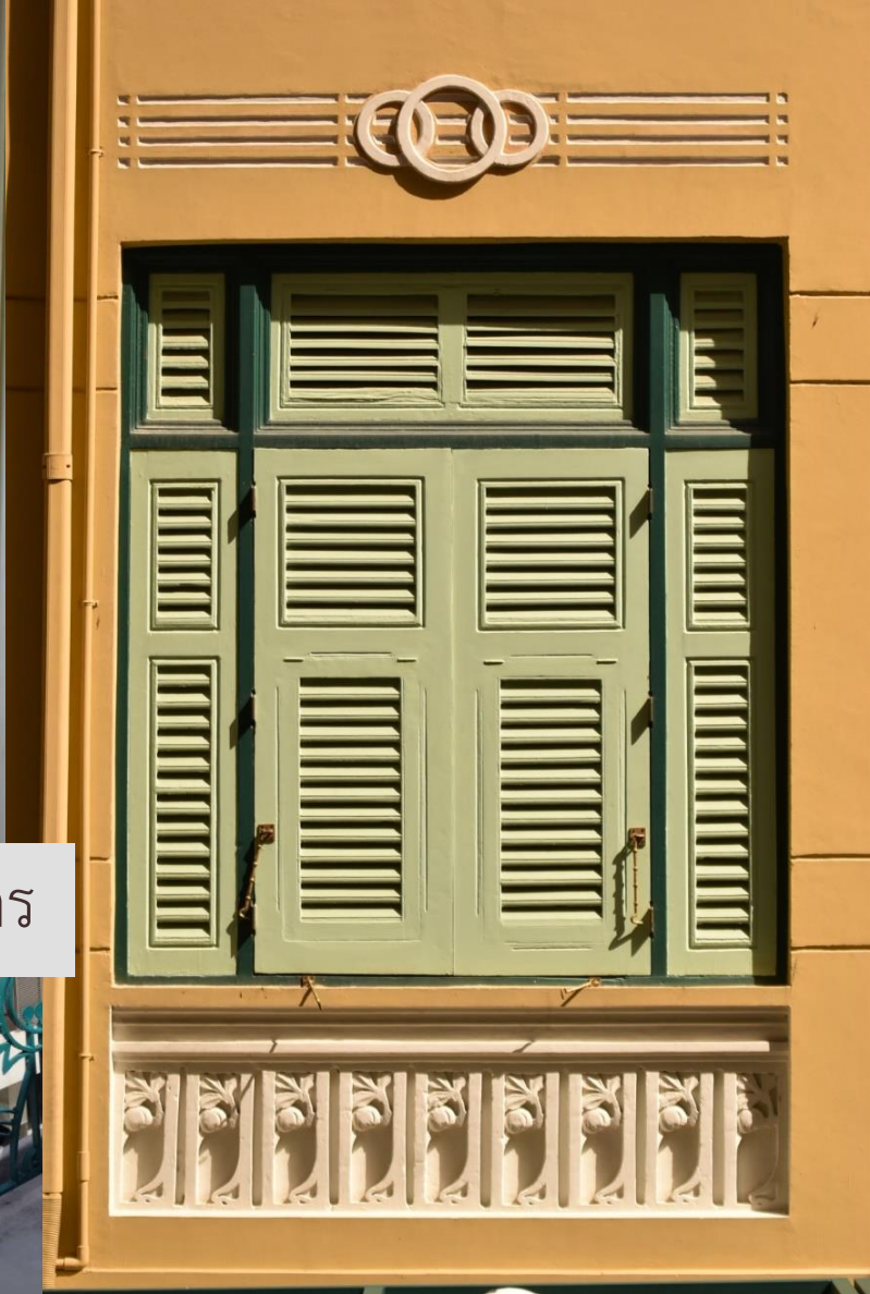
ตัวอย่างลวดลาย แบบนวลศิลป์หรืออาร์ตนูโว (Art Nuveau) ของตึกสุริยานุวัตร