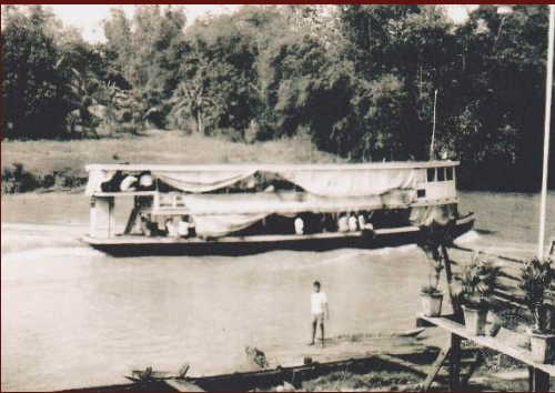
ภ สพ สบ๒๔/๑ เรือเมล์ ๒ ชั้น