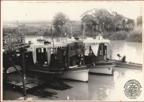
ภ สพ พ๔/๒๕ เรือโดยสารบริเวณท่าเรือบ้านลุด บางปلام้า