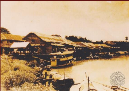
ภ สพ สบ๒๒/๑๓๔ เรือเมล์ ๒ ชั้นที่ตลาดบางปلام้า ปี ๒๕๐๐

เส้นทางเรือเมล์จากกรุงเทพถึงสุพรรณบุรี จากท่าเตียนและจี่วรายให้บริการโดย บริษัท สุพรรณบุรีขนส่ง ซึ่งเป็นบริษัทเดินเรือที่ใหญ่ที่สุดในเส้นทางแม่น้ำเจ้าพระยาและท่าจีน ก่อตั้งเมื่อ พ.ศ. ๒๔๕๖ โดยเรือประกอบด้วย ตัวเรือต่อด้วยไม้ตะเคียนและไม้สัก หัวเรือคล้ายเตารีดแบบโบราณ หลังคาแบน มีเสารองรับ มีผ้าผูกชายคาเรือ เครื่องยนต์กลางลำเรือ มีท้อไอเสียบนหลังคา พวงมาลัยที่หัวเรือ มีห้องสุขาท้ายเรือ ภายนอกทาด้วยสีแดงทองเรือสีดำ จึงเรียกกันว่า “เรือเมล์แดง” เรือสุพรรณขนส่งมีทั้งแบบชั้นเดียว ชั้นครึ่ง สองชั้น และเรือด่วน โดยที่ทำการบริษัทอยู่ที่ท่าเรือจี่วรายเป็นแม่ข่าย และมีสาขากระจายออกไปหลายแห่ง มีท่าเรือเมล์ เช่น ที่สุพรรณบุรี สามชุก บางเลน บางหลวง แต่ละที่มีนายท่าเป็นผู้จัดการ