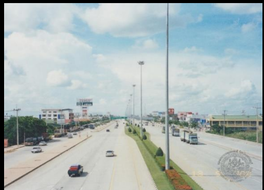
ภ สพ สบ ๒.๒/๖๘ ถนนหมายเลข ๓๔๐ ถ่ายเมื่อ ๑ กันยายน พ.ศ. ๒๕๔๕