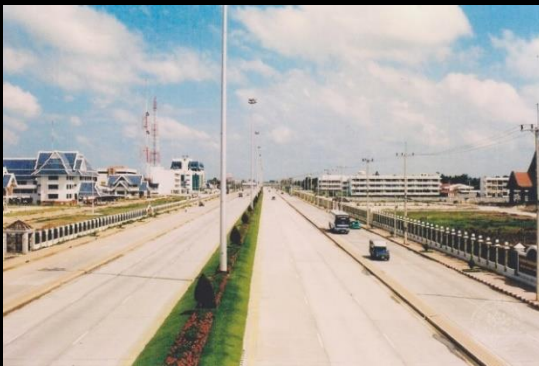
ภ สพ สบ ๒.๒/๑๑๓ ถนนทางหลวงแผ่นดิน ๓๔๐ บริเวณศูนย์ราชการ ถ่ายเมื่อ พ.ศ. ๒๕๔๑

จากเอกสารจดหมายเหตุ บันทึกสำนักงานเศรษฐกิจการคลัง ระบุว่า คณะรัฐมนตรีได้มีมติเมื่อวันที่ ๒๖ พฤศจิกายน พ.ศ.๒๕๐๖ ให้ดำเนินการปรับปรุงทางสายสุพรรณบุรี-ชัยนาท ซึ่งเป็นการปรับปรุงถนนดินที่ทางจังหวัดทำไว้ให้เป็นถนนถาวร เนื่องจากเส้นทางสายนี้มีความจำเป็นและสำคัญในทางเศรษฐกิจมาก เพราะบริเวณนี้มีพืชผลมากแต่ขาดเส้นทางคมนาคมทางบก แต่มติคณะกรรมการพิจารณาปรับปรุงโครงการทางหลวงนั้นให้รอการดำเนินการไว้ก่อน จนกว่าโครงการทางหลวงแผ่นดิน ๘ ปี (พ.ศ. ๒๕๐๖ - ๑๕๑๓) จะแล้วเสร็จ เนื่องจากถนนสายนี้อยู่ในกลุ่ม มีทางขนส่งทางน้ำ ทำให้ค่าก่อสร้างมาราคาสูงมาก