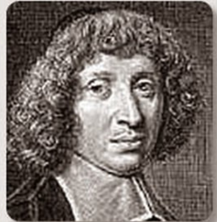
Simon de la Loubere

กรุงศรีอยุธยาไว้อย่างกว้างขวาง จากการอยู่อาศัย ๓ เดือน ๒ วัน