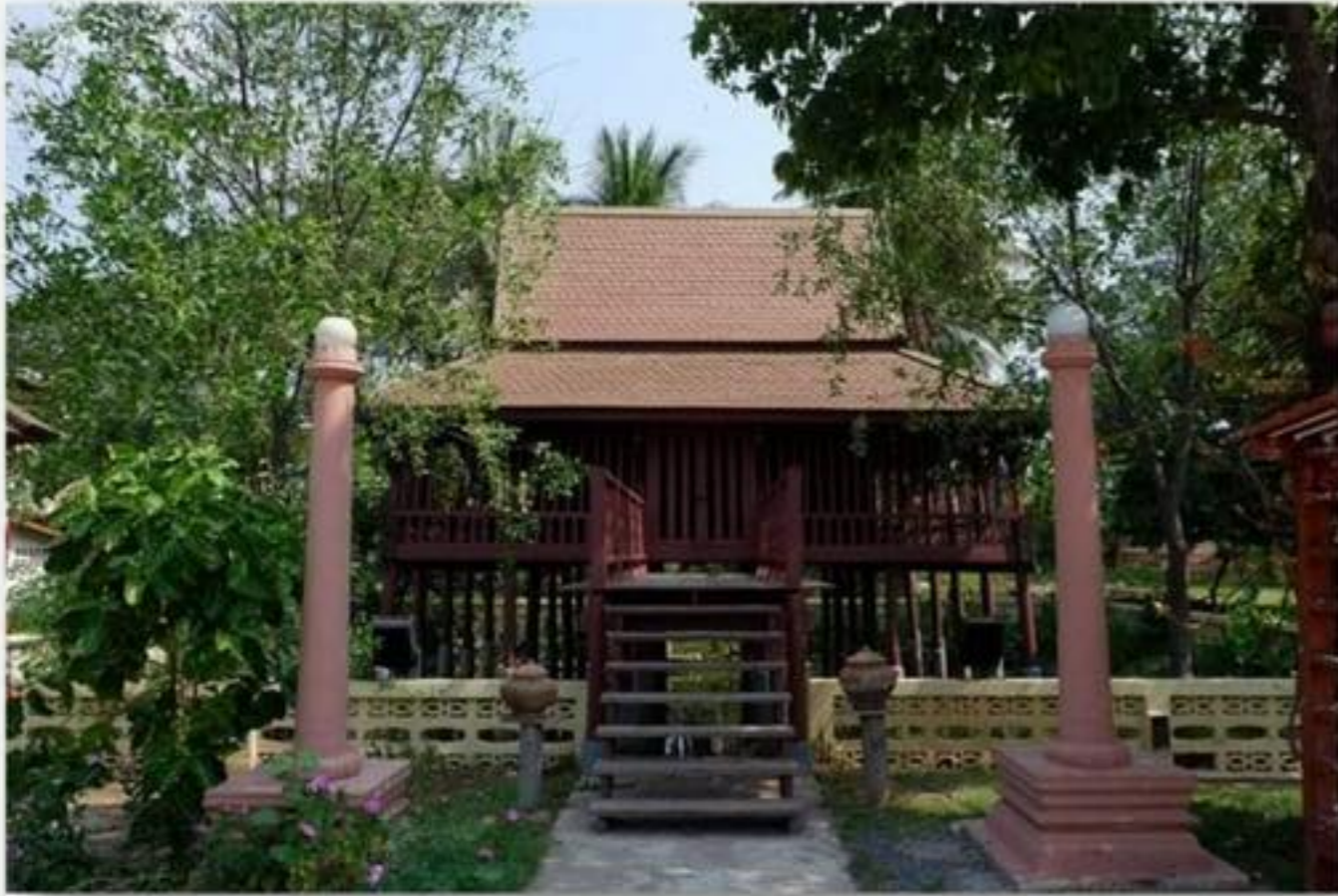
วัดมหาชัย จังหวัดหนองบัวลำภู