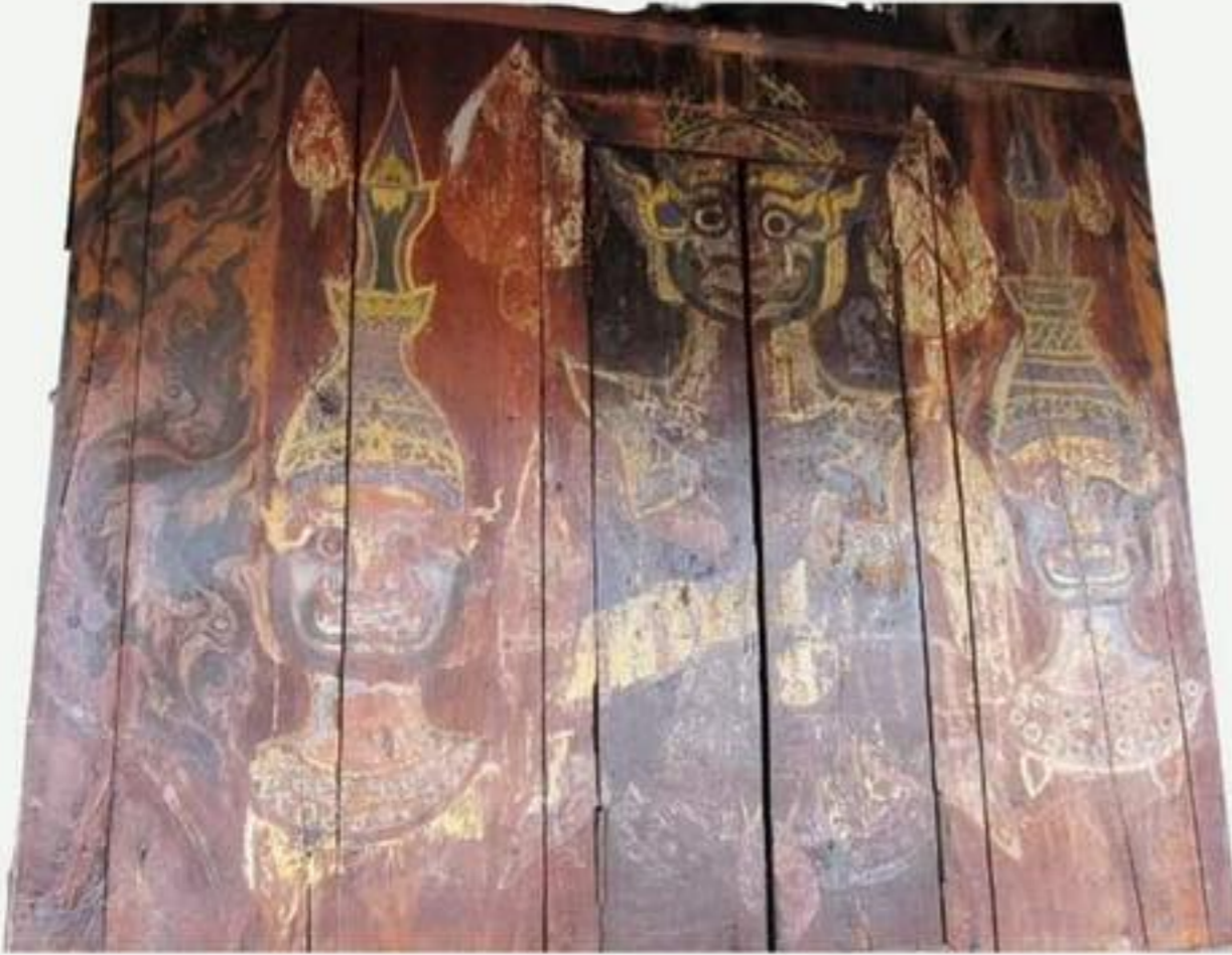
ผนังด้านหน้า เป็นภาพยักษ์ 3 ตน