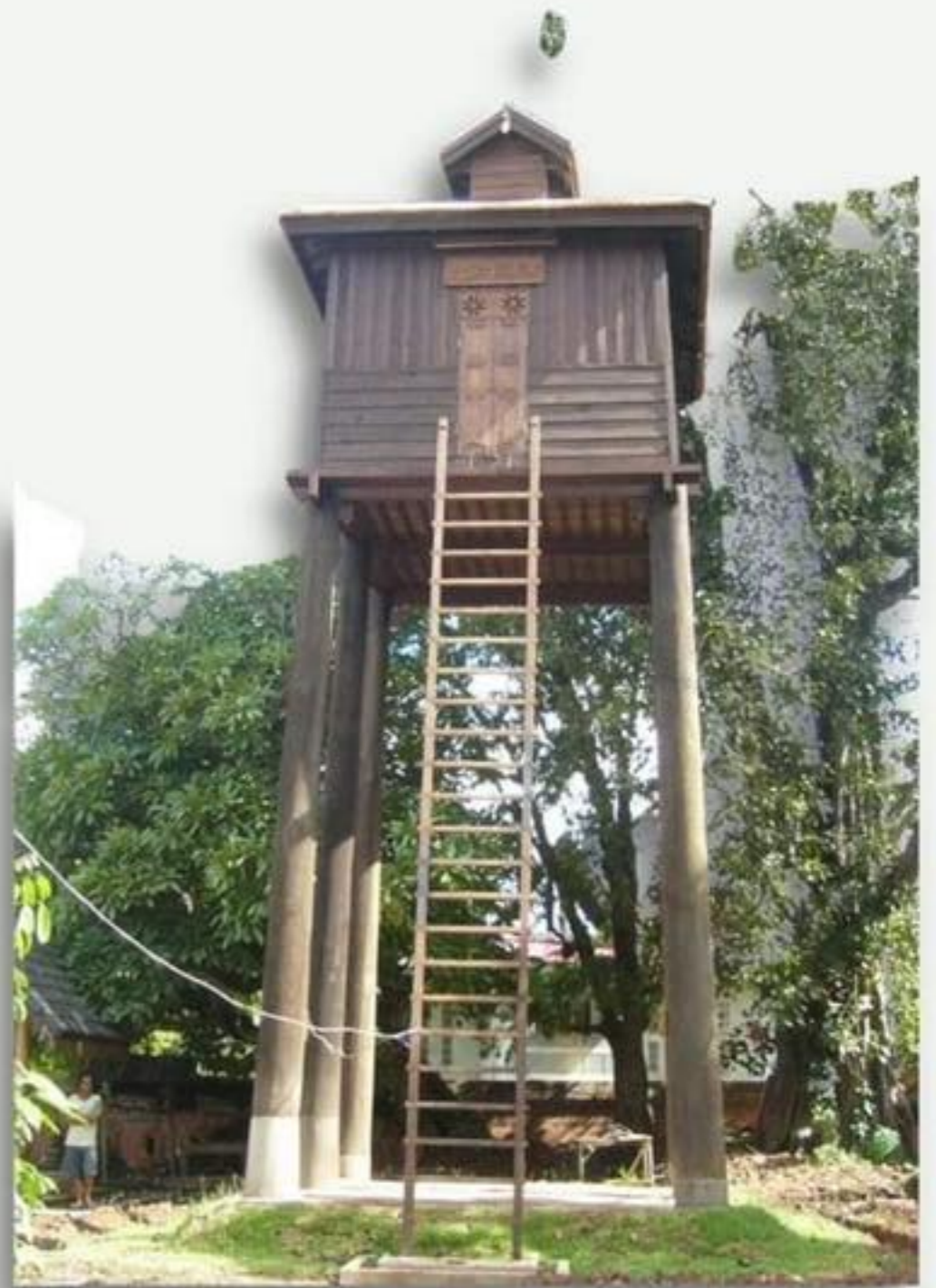
วัดโพธิ์ชัย จังหวัดเลย