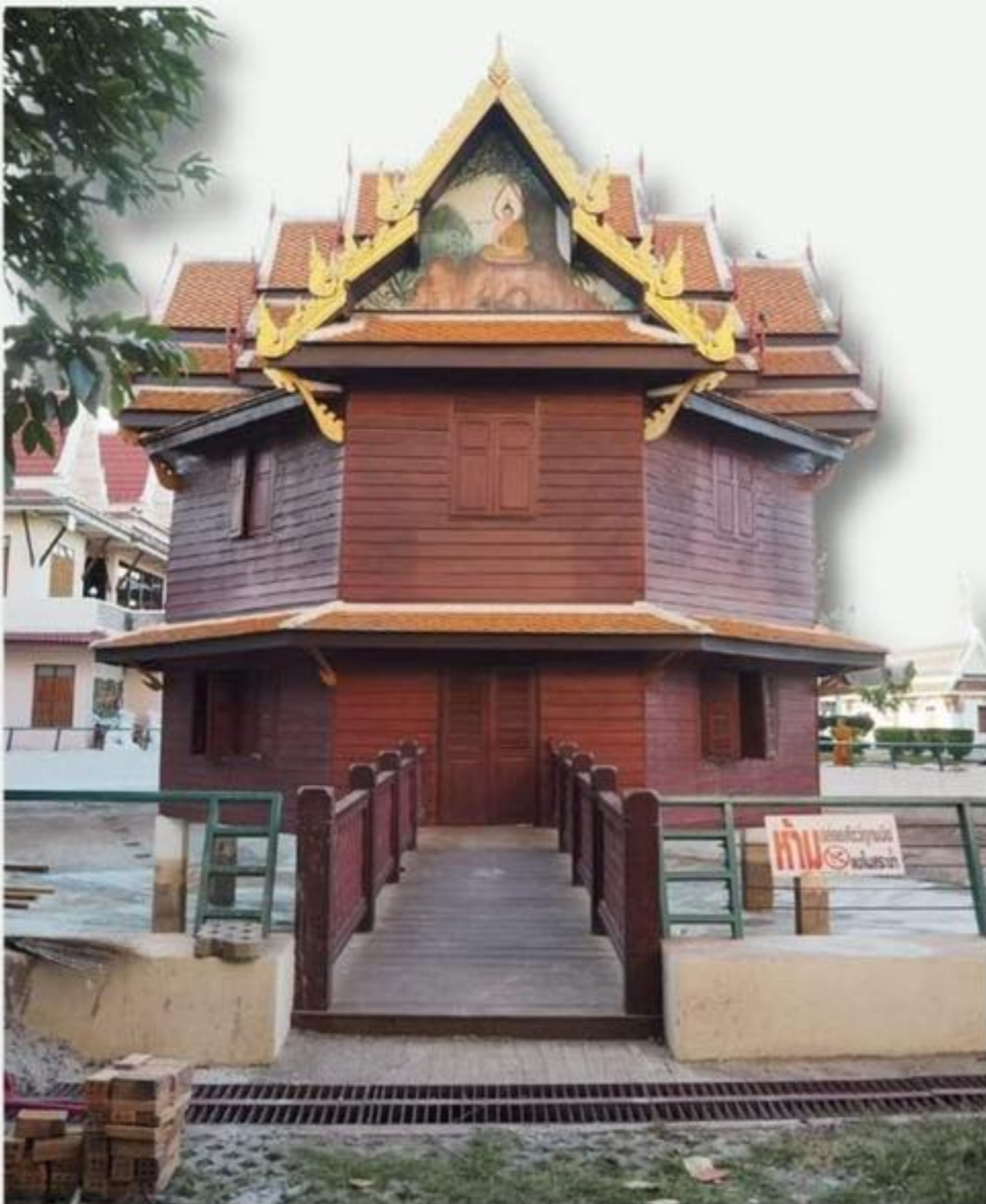
วัดพระธาตุเชิงชุมวรวิหาร จังหวัดสกลนคร