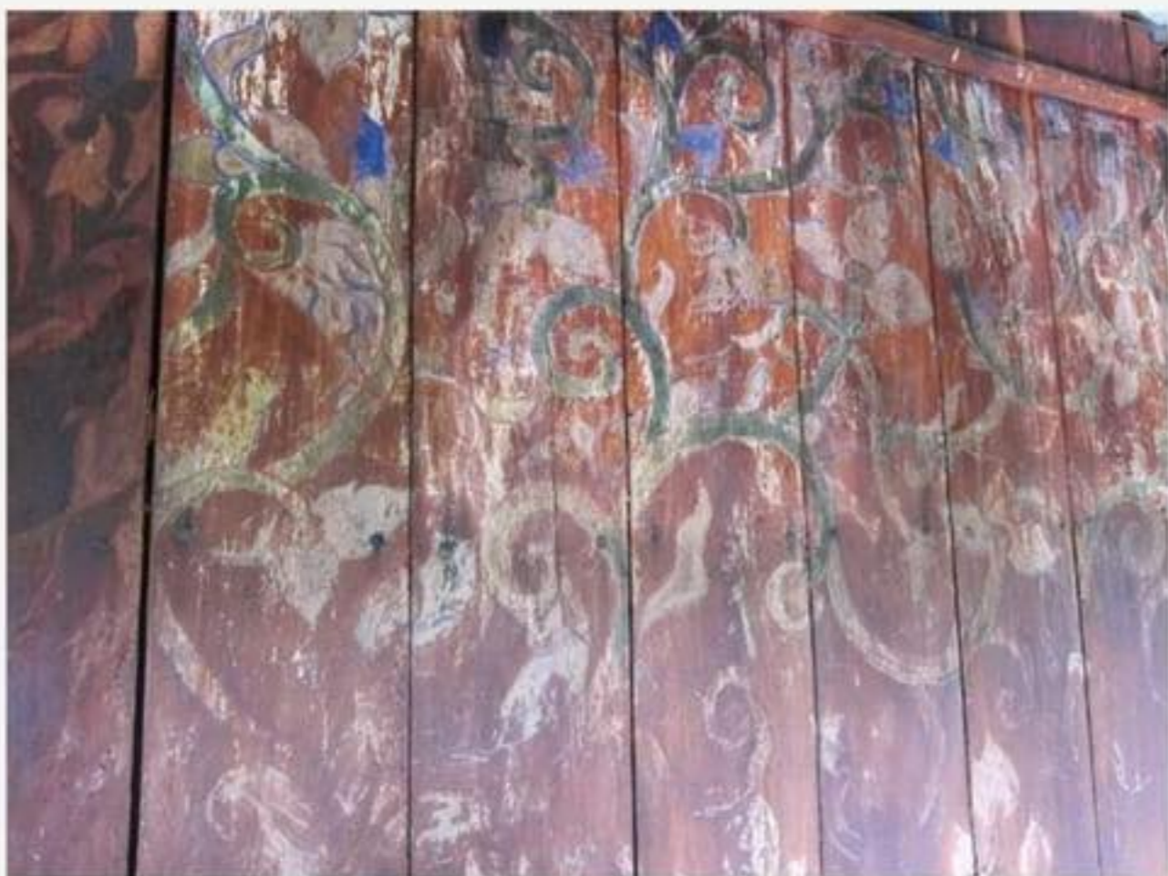
ผนังด้านหลังเป็นภาพเขียนลายก้านขด ออกช่อเป็นกลีบดอกไม้บาน