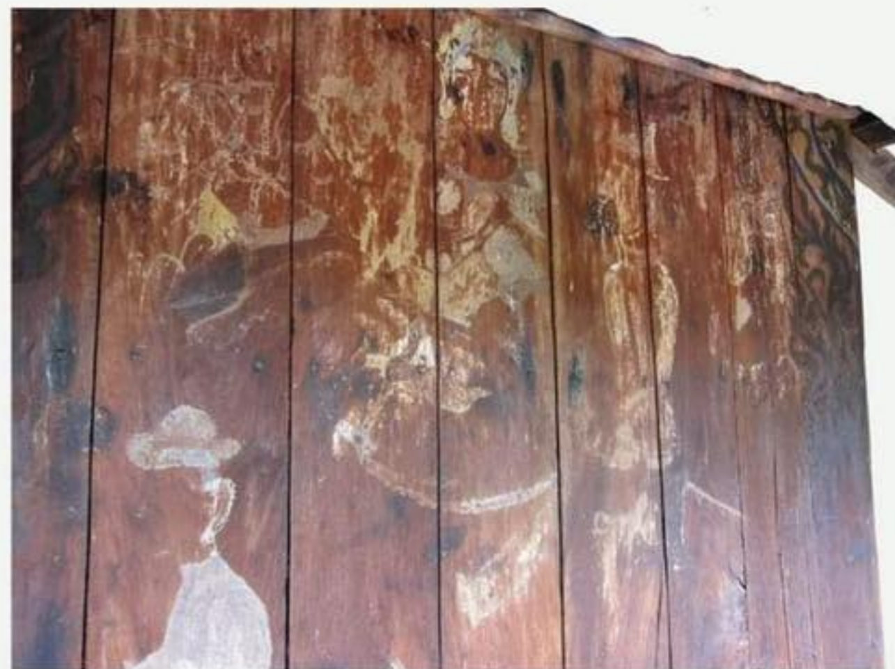
ผนังด้านตะวันตก เป็นภาพเทวดาทั้ง 4 องค์