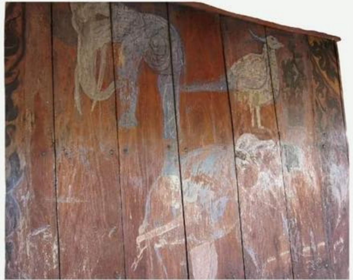
ผนังด้านทิศตะวันออก เป็นภาพสัตว์ รูปช้างและนกยูง