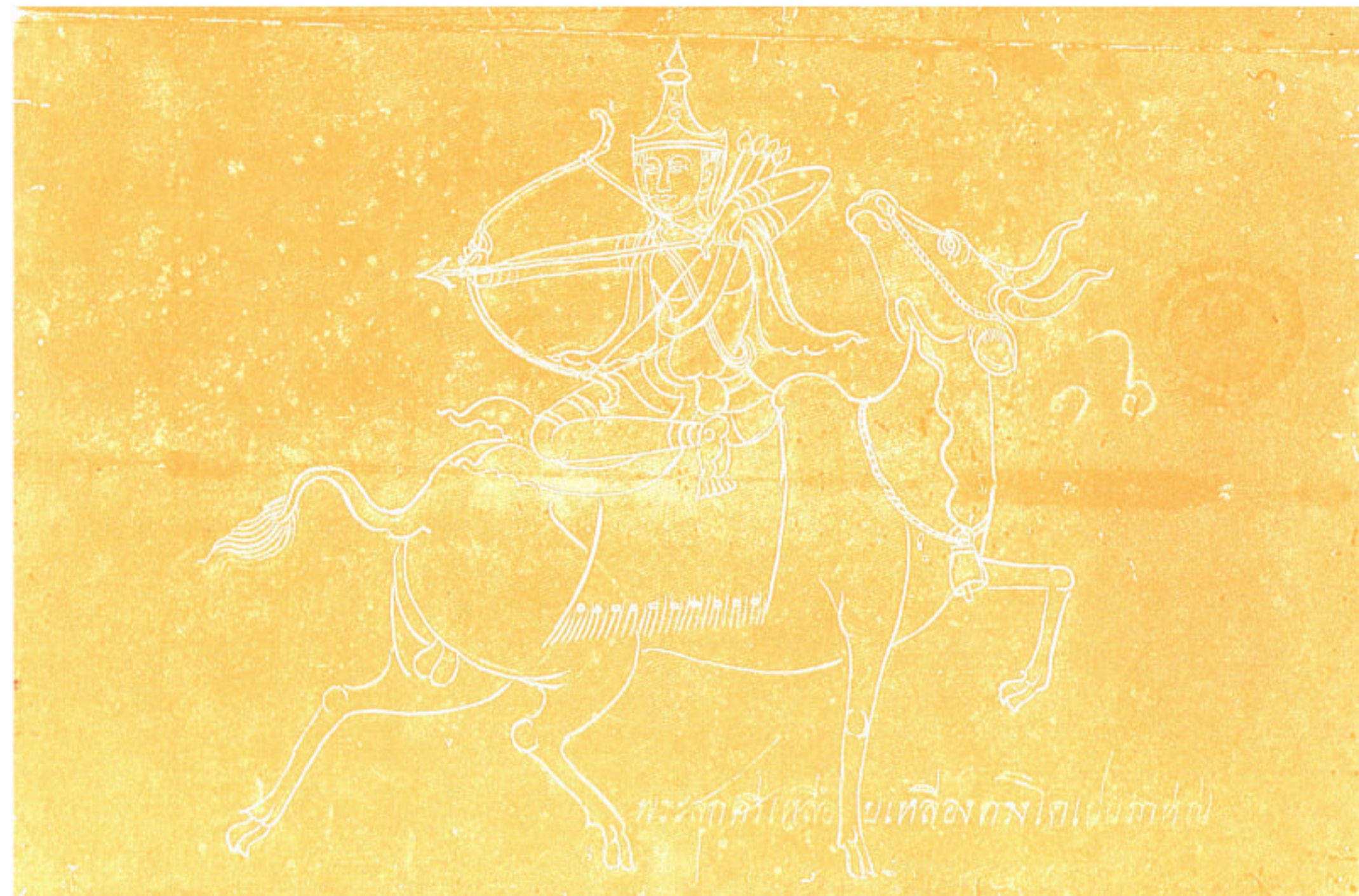
พระสุกศรีเหลือบเหลื่องทรงโคเปนภาน์