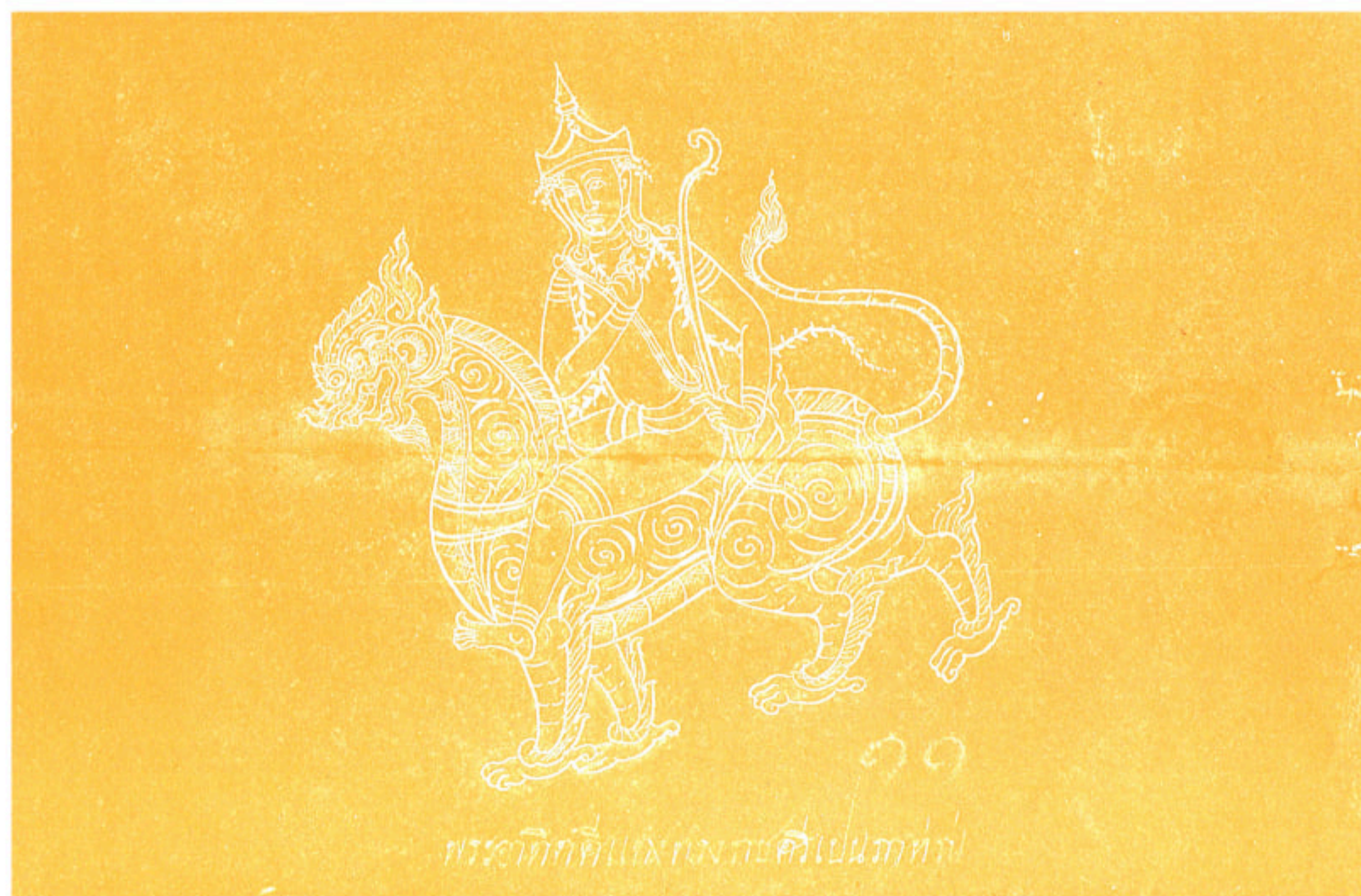
พระอาทิตย์แดงทรงราชสีห์เป็นภาทอง

รวมภาพเทวดานพเคราะห์ ๙ องค์ จากหนังสือสมุดไทยของหอสมุดแห่งชาติ หนังสือสมุดไทยดำ สมุดพระเทวารูป เลขที่ ๓๑