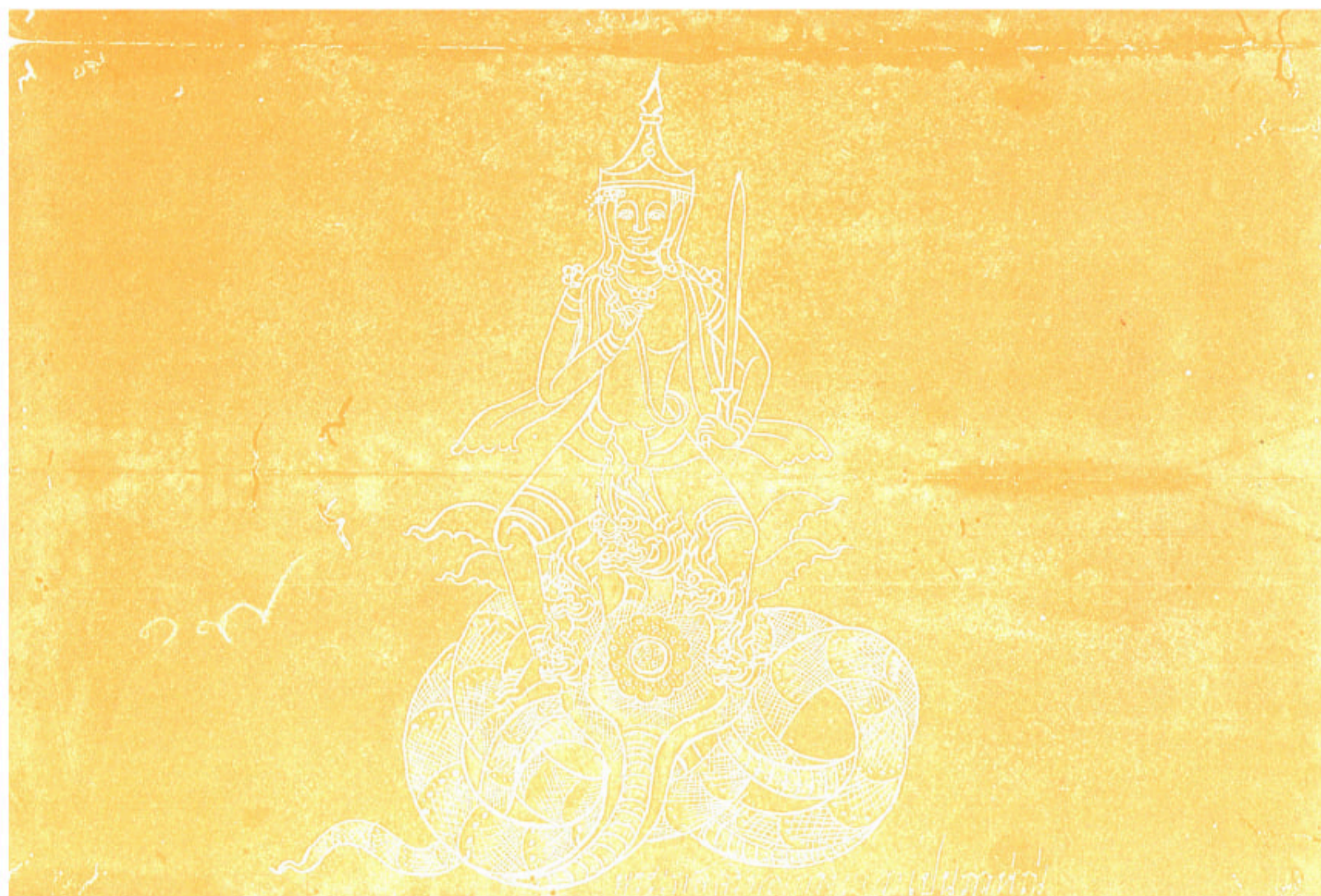
พระเกสรีทองทรงนาคาเป็นภาพหน้า

รวมภาพเทวดานพเคราะห์ ๙ องค์ จากหนังสือสมุดไทยของหอสมุดแห่งชาติ หนังสือสมุดไทยดำ สมุดพระเทวารูป เลขที่ ๓๑