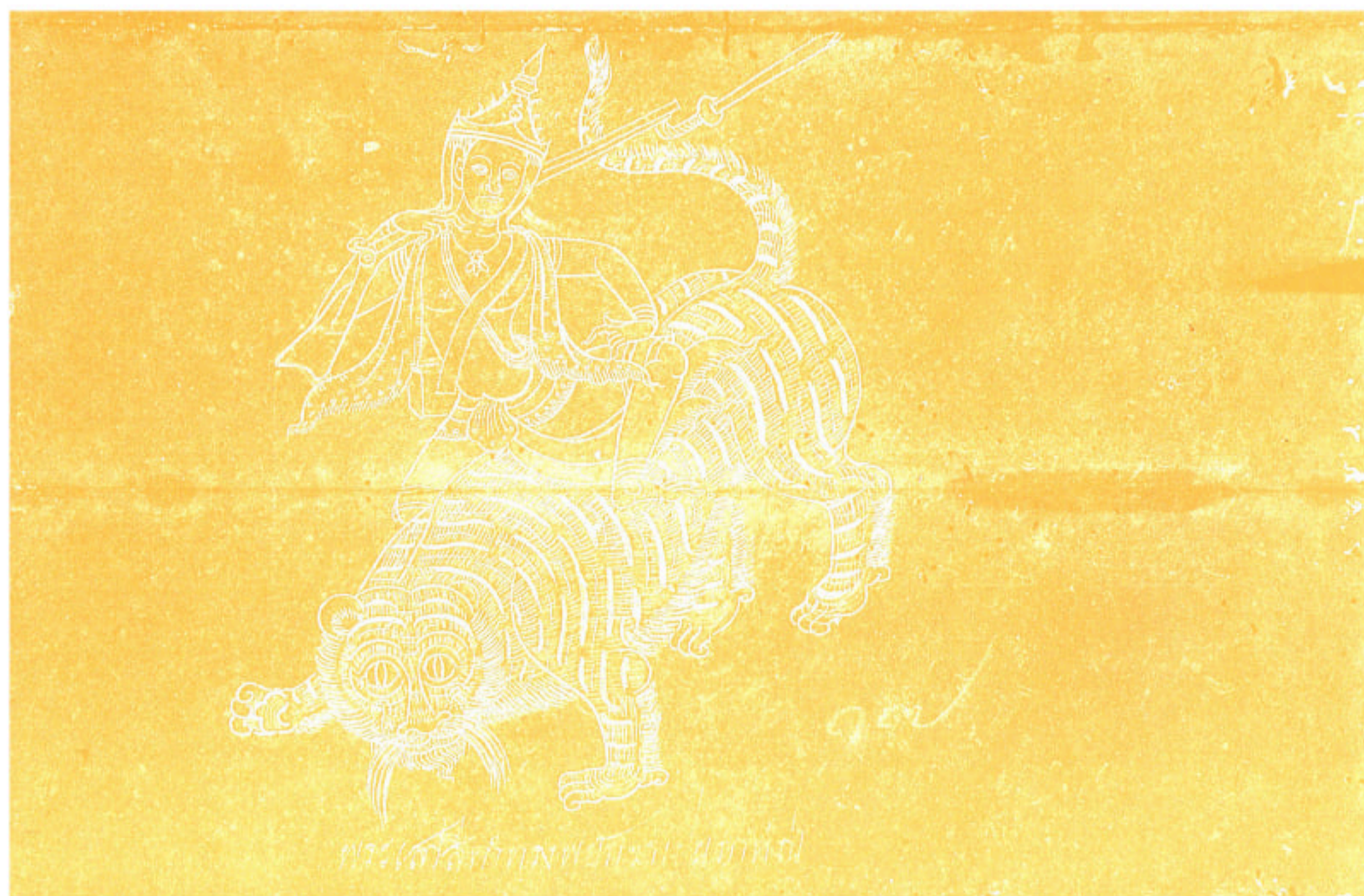
พระเสาสีดำทรงพญากษัตริย์เป็นภาท่อน

รวมภาพเทวดานพเคราะห์ ๙ องค์ จากหนังสือสมุดไทยของหอสมุดแห่งชาติ หนังสือสมุดไทยดำ สมุดพระเทวารูป เลขที่ ๓๑