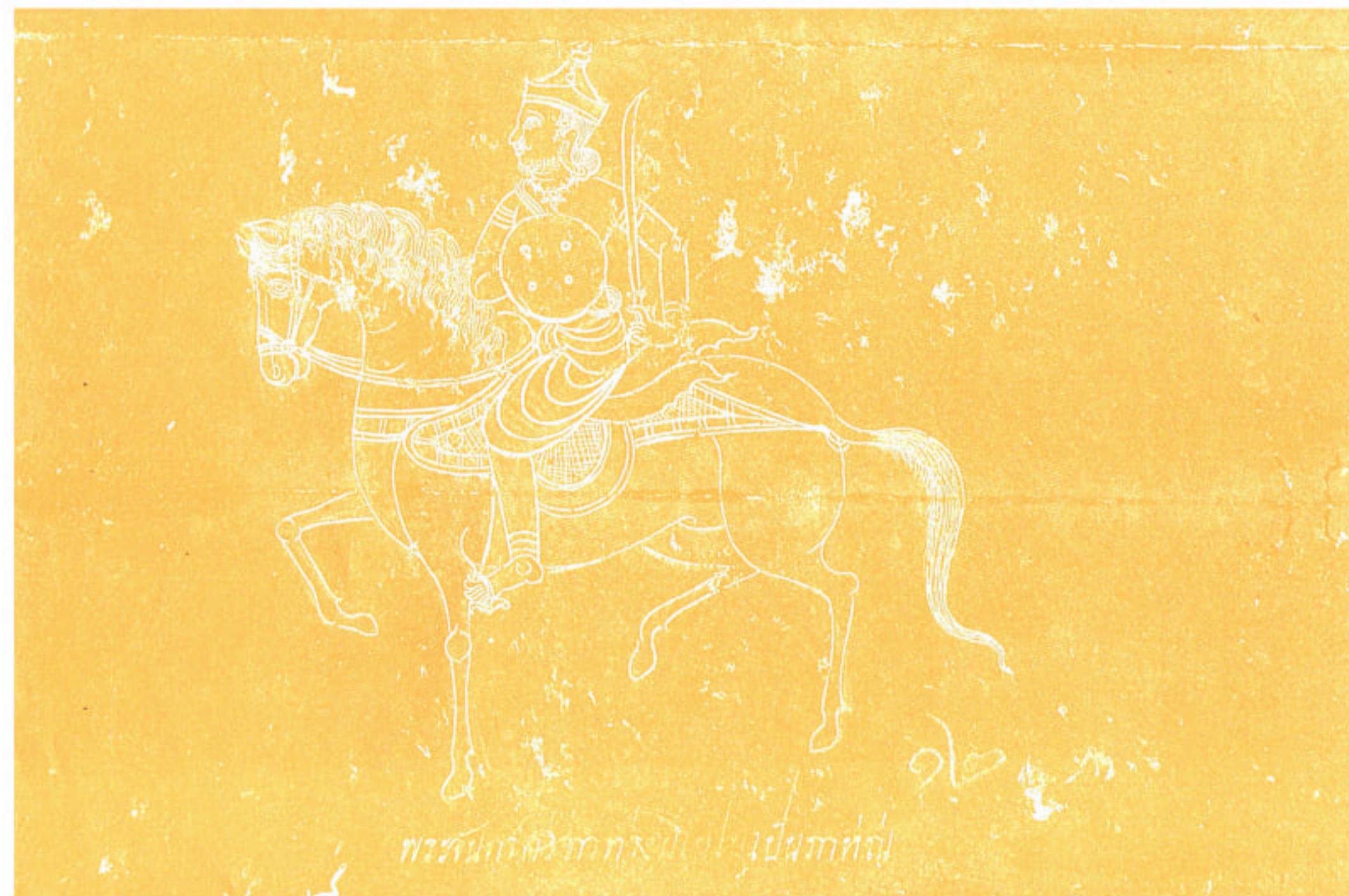
พระจันทร์สีขาวทรงมโนไม้เป็นภาทอง