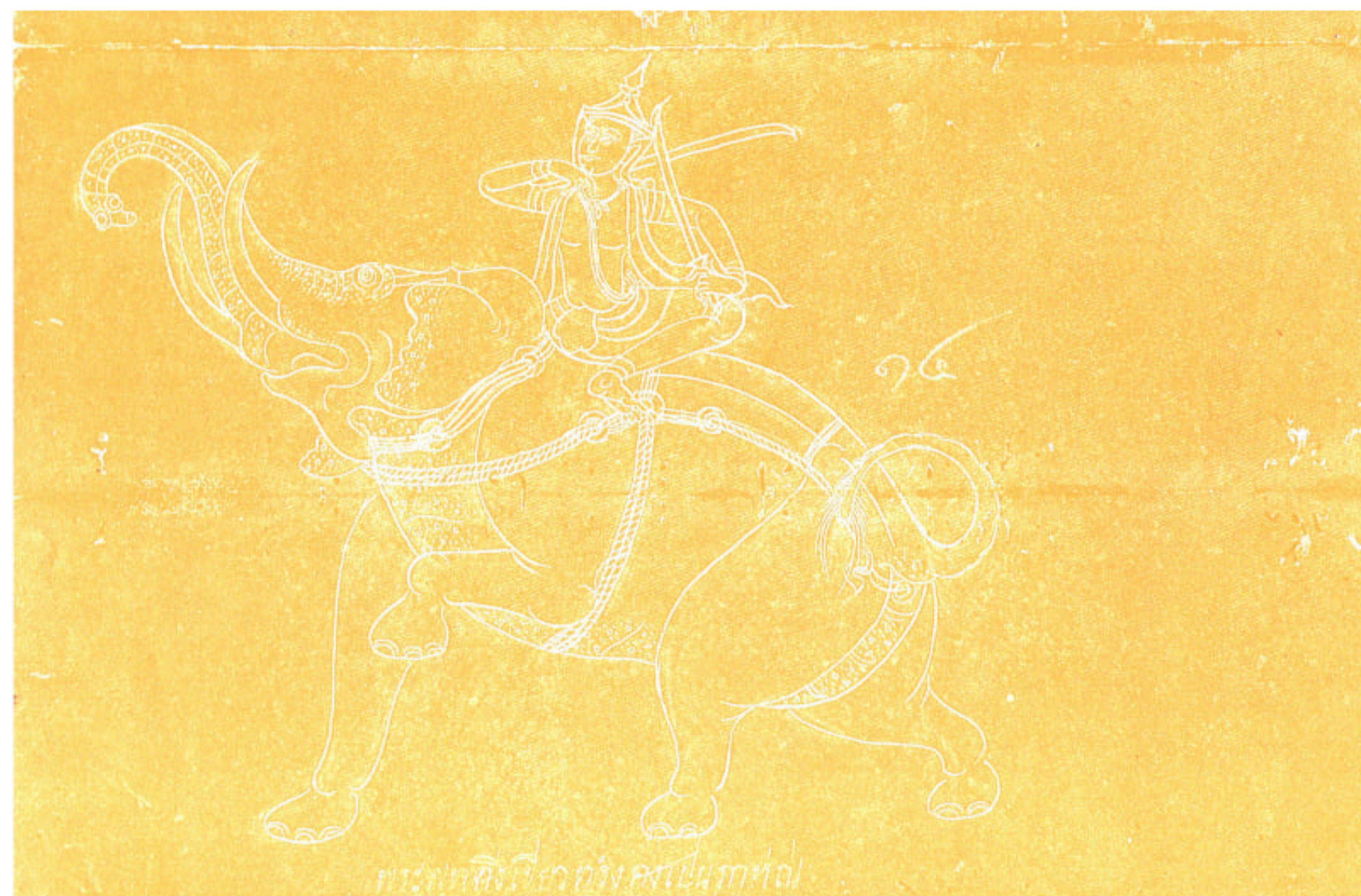
พระพุธศรีเขียวทรงช้างเป็นภาท่อน