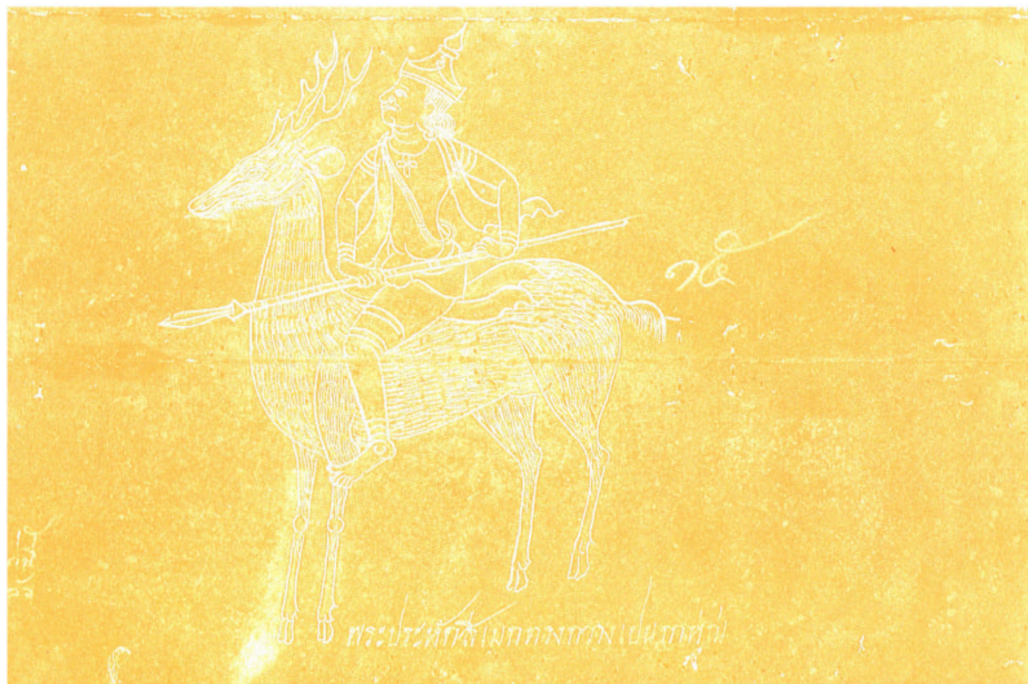
พระประหัตสีเมกทรงกวางเปนภาน์

รวมภาพเทวดานพเคราะห์ ๙ องค์ จากหนังสือสมุดไทยของหอสมุดแห่งชาติ หนังสือสมุดไทยดำ สมุดพระเทวารูป เลขที่ ๓๑