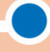
กลุ่มที่ 3