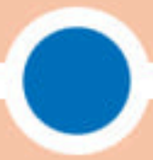
กลุ่มที่ 1