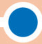
กลุ่มที่ 2