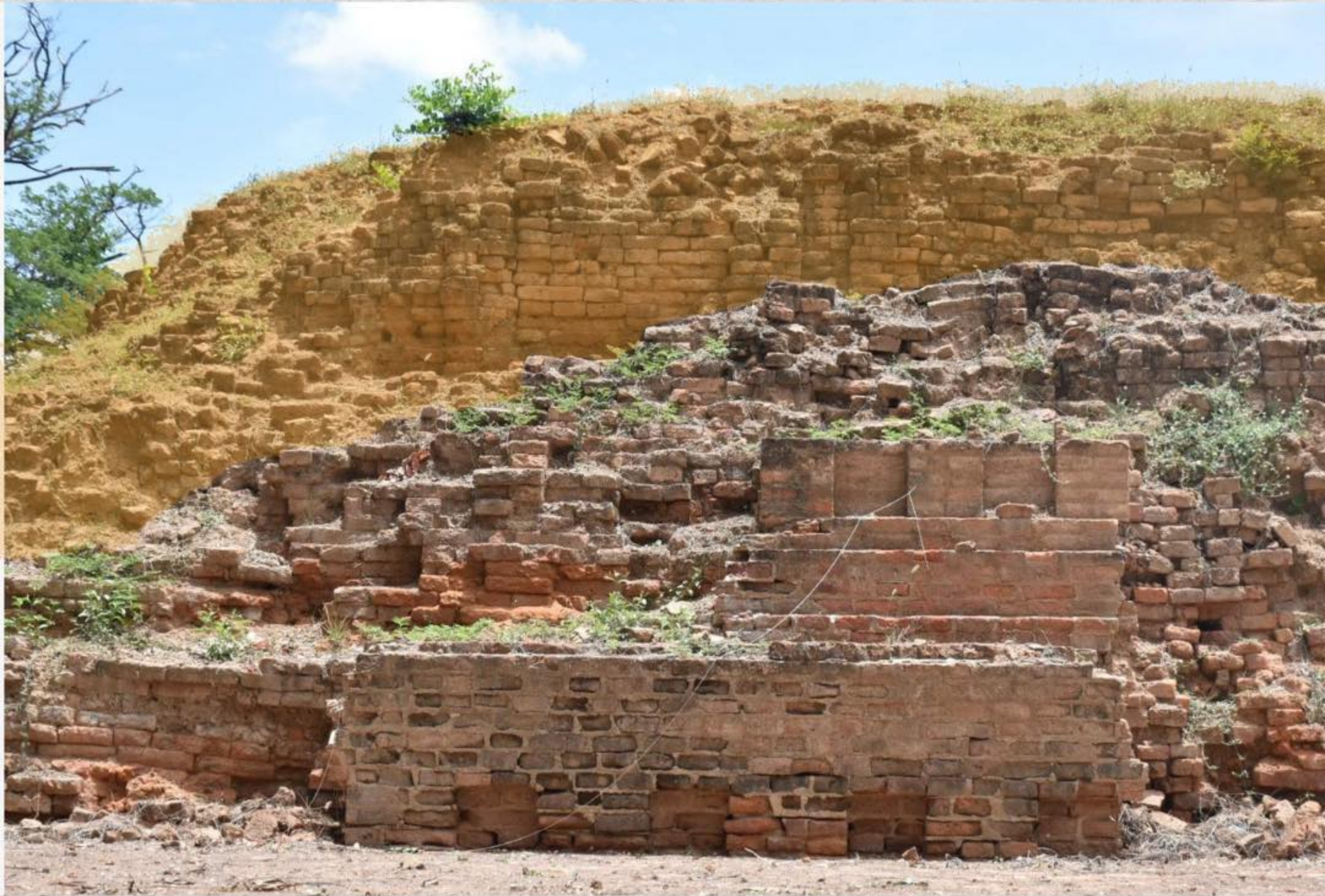
ภาพเจดีย์หมายเลข ๑

ที่แสดงให้เห็นถึงการสร้างและซ่อมแซมมสร้างสมัยทวารวดี