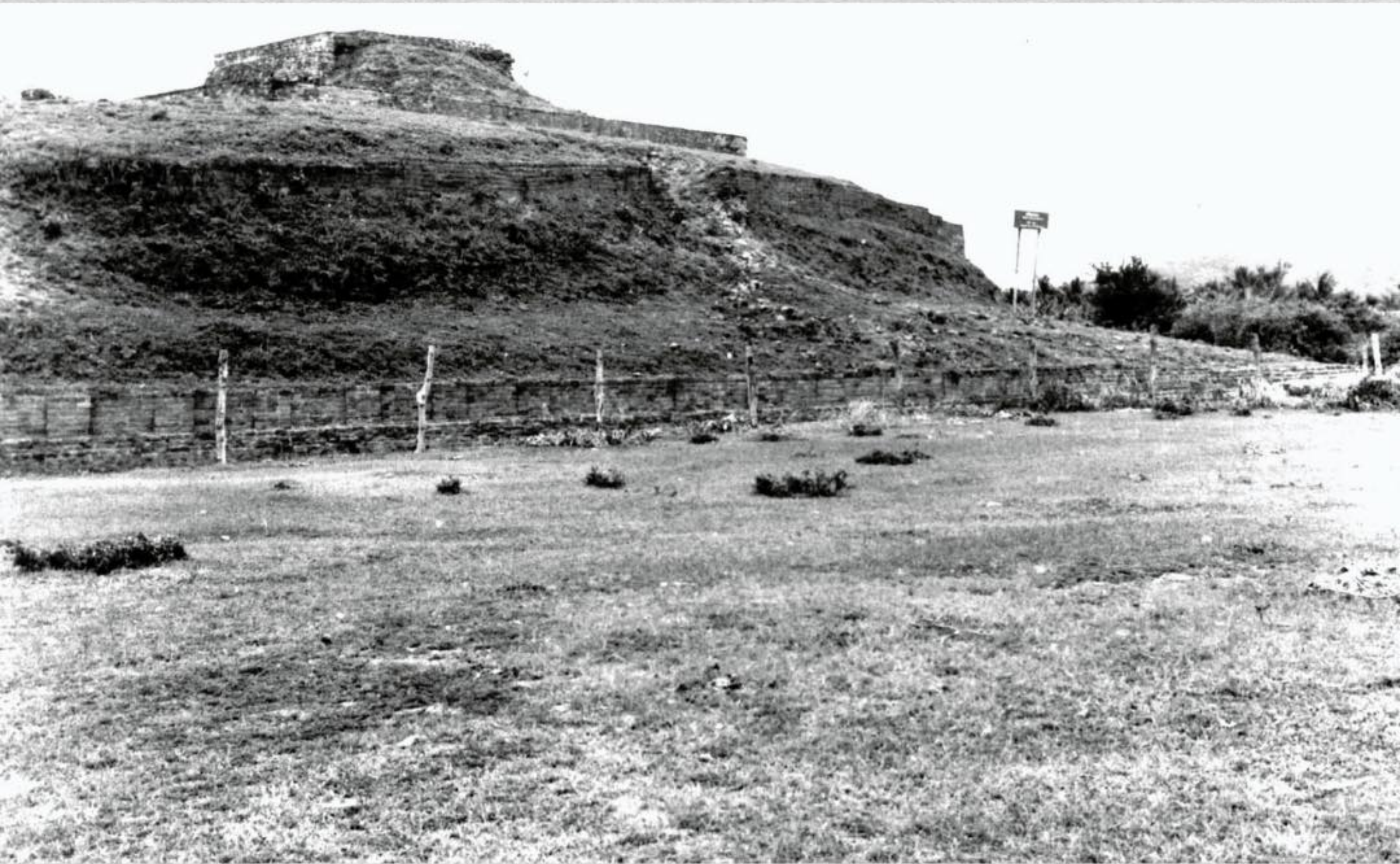
ภาพถ่ายเก่าเจดีย์หมายเลข ๑ ระหว่างดำเนินงานทางโบราณคดี เมื่อ พ.ศ. ๒๕๐๗ - ๒๕๐๙