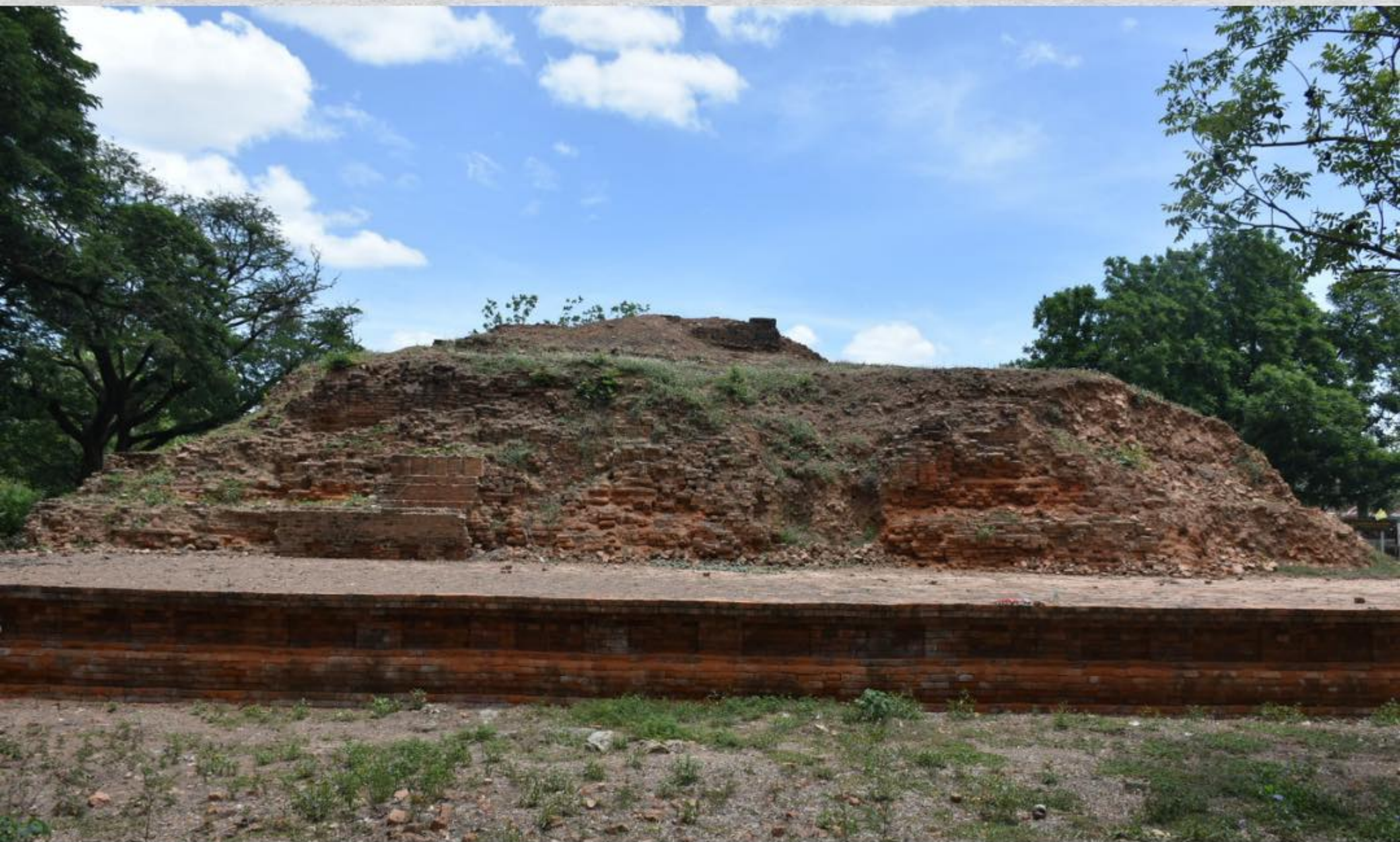
ภาพเจดีย์หมายเลข ๑ ปัจจุบัน