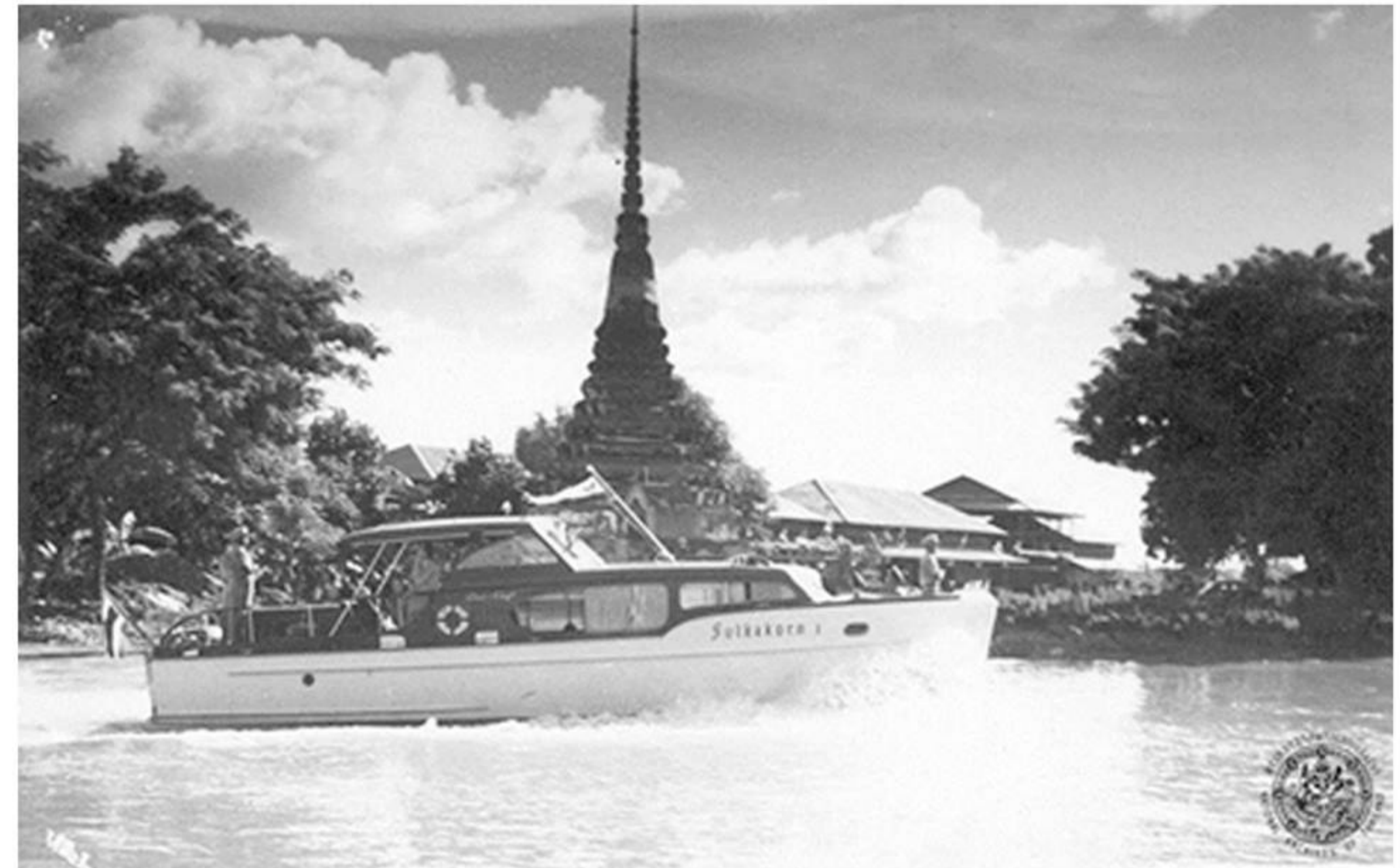
ผ่านวัดบ้านกร่าง อำเภอศรีประจันต์