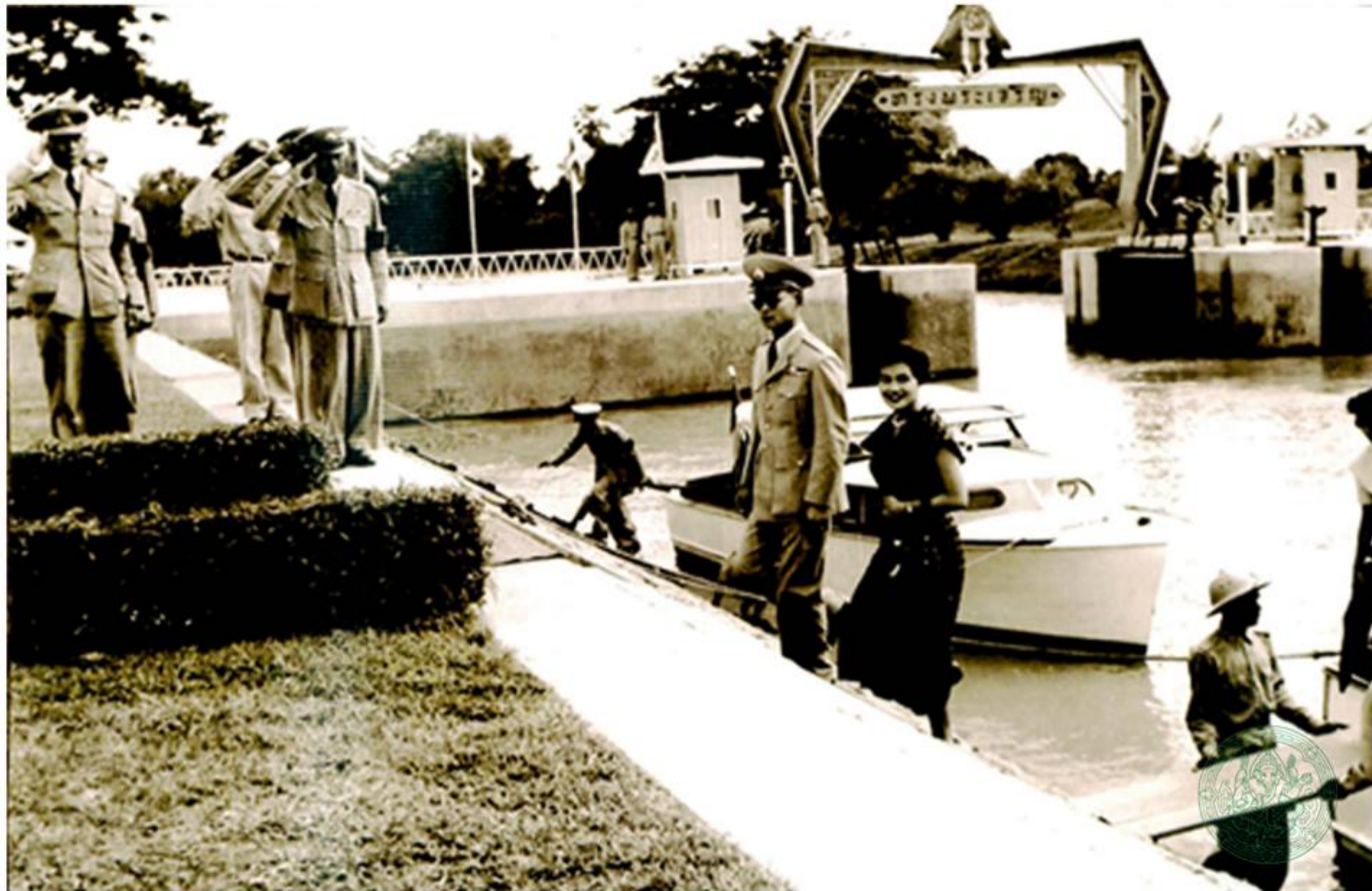
เรือพระที่นั่งผ่านประตูน้ำโพธิ์พระยา