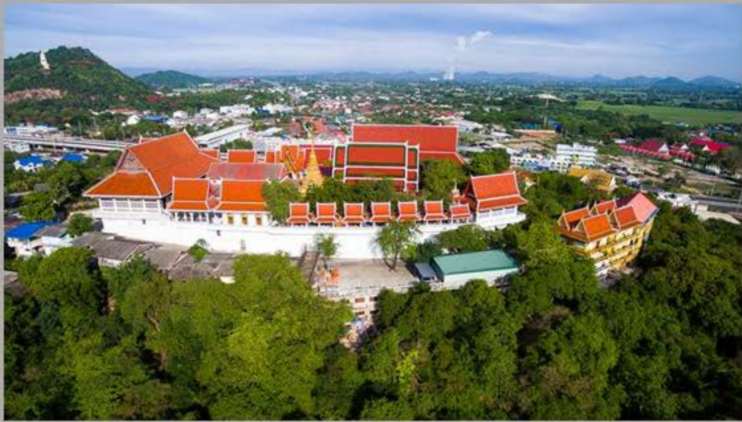
วัดเขาวังราชบุรี ปัจจุบัน

พระราชวังบมบยอตเขาสัตนารณ ในสมัยรัชกาลที่ ๕