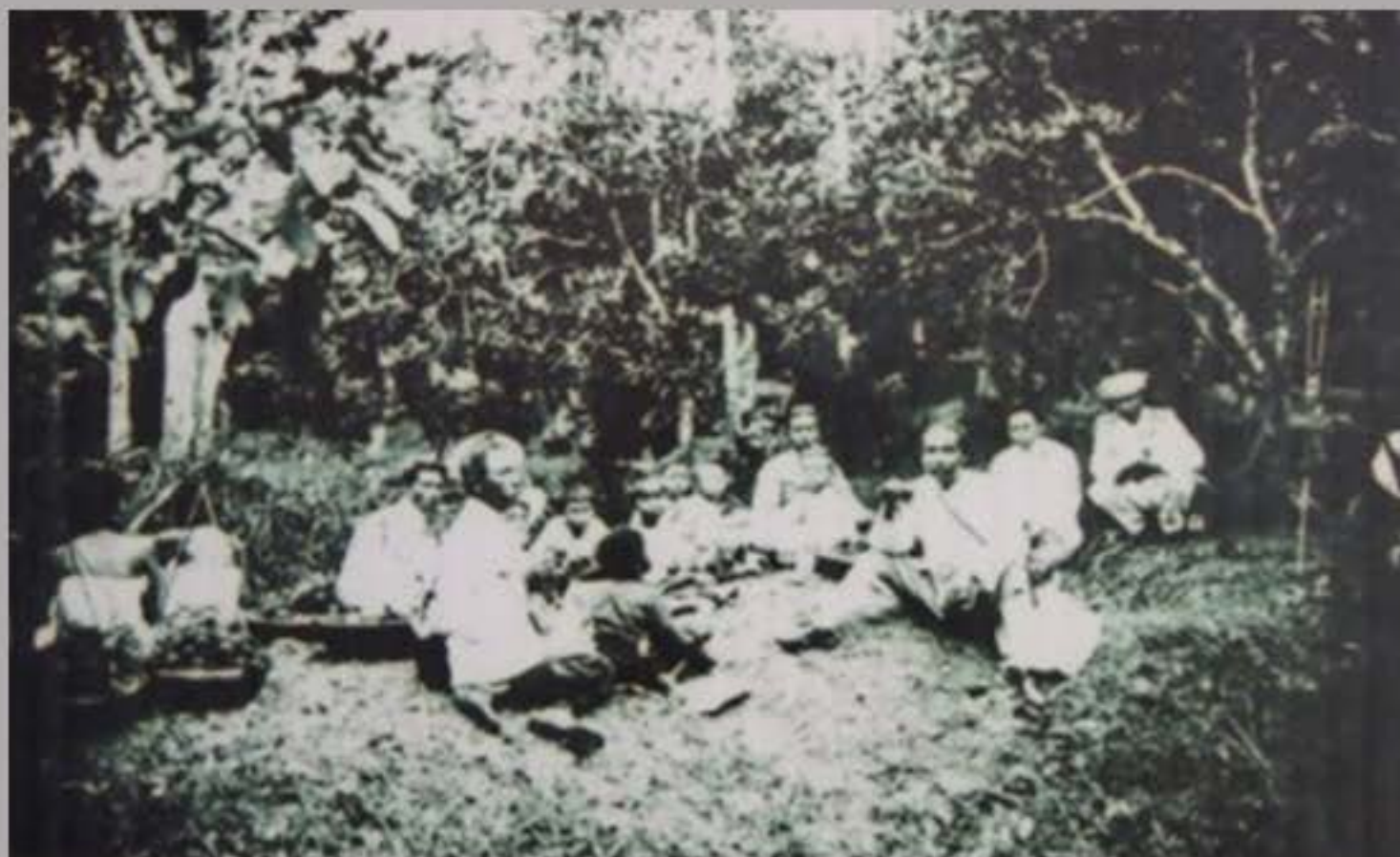
พระบาทสมเด็จพระจุลจอมเกล้าเจ้าอยู่หัว (รัชกาลที่ ๕) ทรงฉายพระรูปพร้อมกับพระราชโอรส และข้าราชการบริพารบริเวณพระราชวังบวรสถานพิมุข