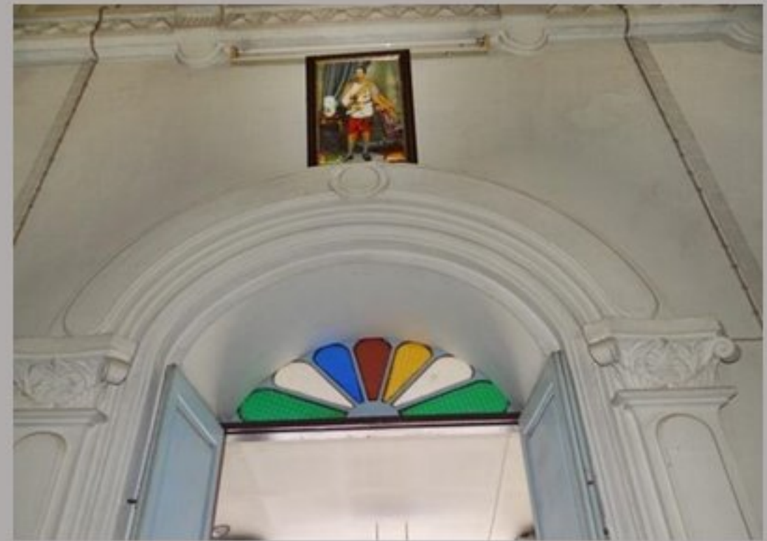
สถาปัตยกรรมของตึกห้องพระโรง ปัจจุบันใช้เป็น วิหารประดิษฐานพระพุทธรูป